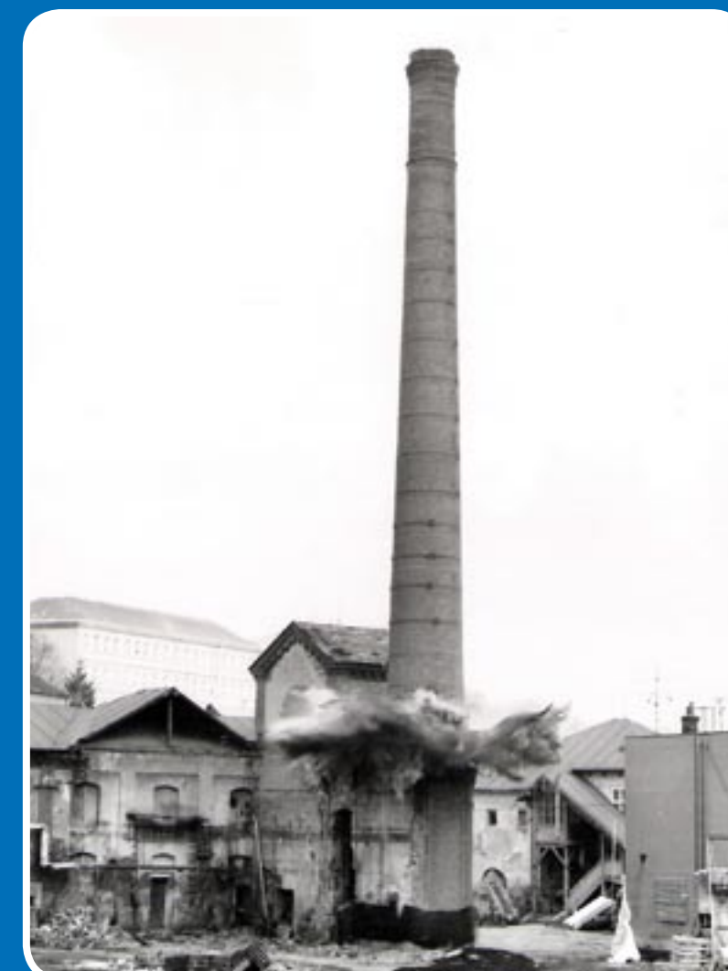
Demolice komína, 1945 Demolition of chimney, 1945 Schornsteinabriss, 1945

The TERO Rosice company accomplished a large reconstruction and modernization of the pasta production at the end of 1992. The new pasta production building was equipped with two lines for the production of short pasta and a year later with a line for the production of spaghetti and macaroni. TERO Rosice became part of the PENAM spol. s r.o. company in 2000. Toast breads from Rosice have won plenty of awards, for example at the Země živilka exhibition in České Budějovice. Many products have also obtained the Klasa brand for quality domestic products.