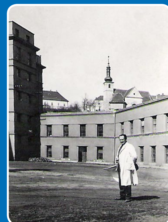
Nová těstárna před válkou New pasta production facility before war Neue Teigfabrik vor dem Krieg