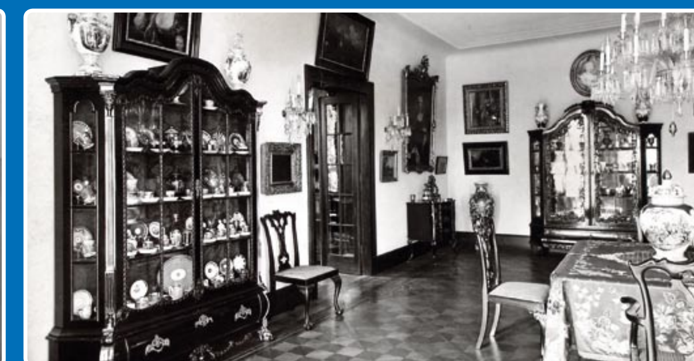
Interiéry vily před rokem 1939 * Villa interiors before 1939 * Villa-Interieurs vor dem Jahr 1939