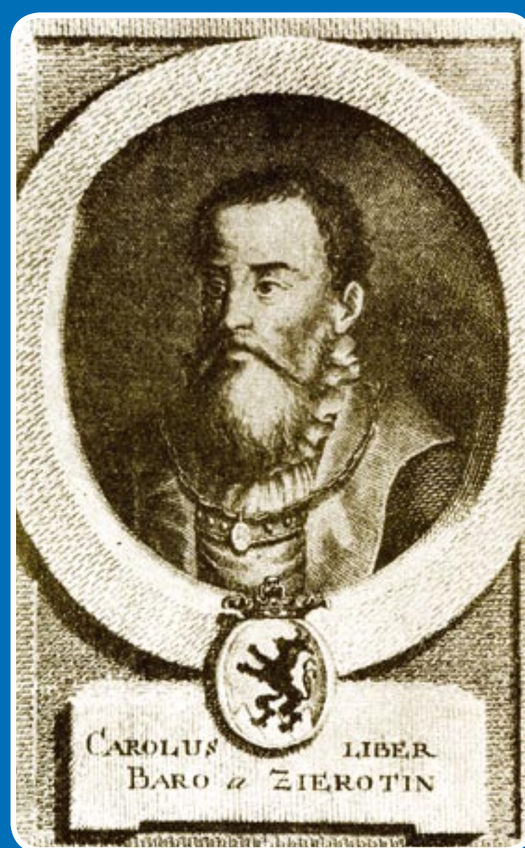
Karel Starší ze Žerotína Karel the Elder of Žerotín Karl der Ältere von Žerotín