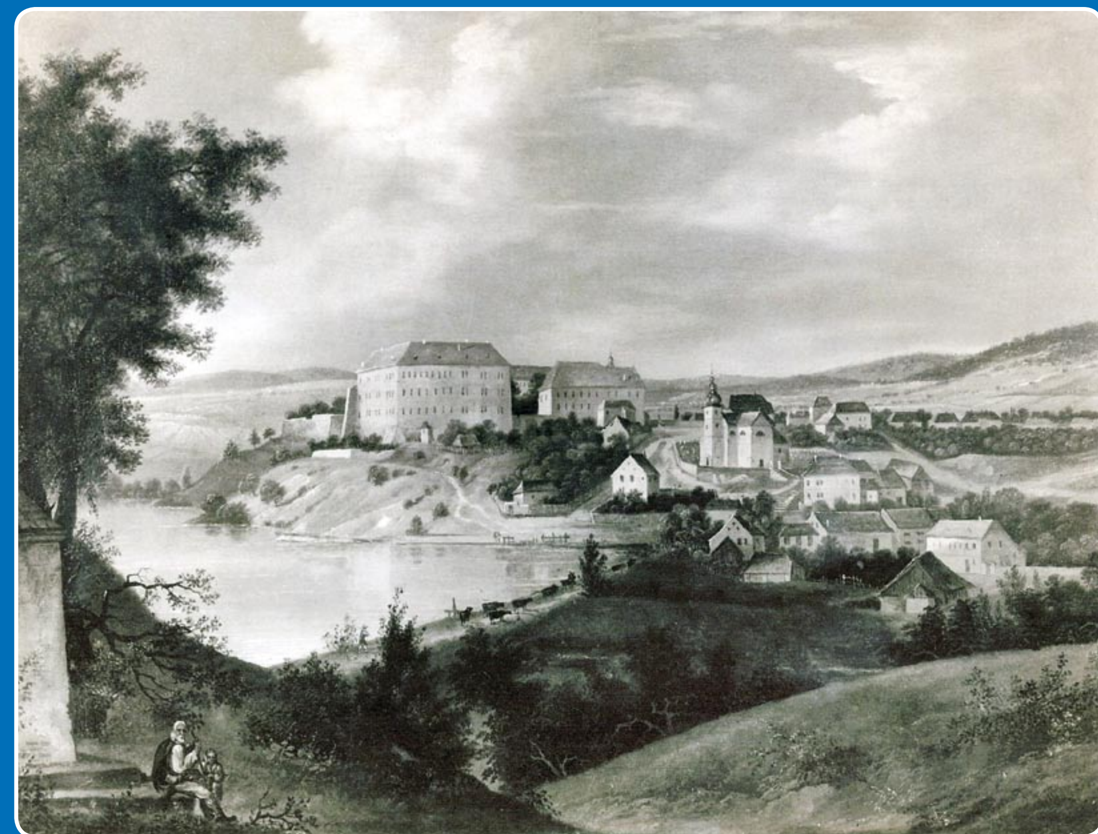
Zámek obklopený rybníky, 1742 * Castle surrounded by ponds, 1742 * Das Schloß umgeschlossen von Teichen, 1742

Zámek je zpřístupněn veřejnosti dvěma prohlídkovými trasami. K vidění je 20 místností a protiatomový kryt, který je situován pod zámeckou zahradou. Je známý školními výlety do historie a historickým festivalem Rytířské klání zakončeným bitvou o pevnost vždy poslední srpnový víkend.