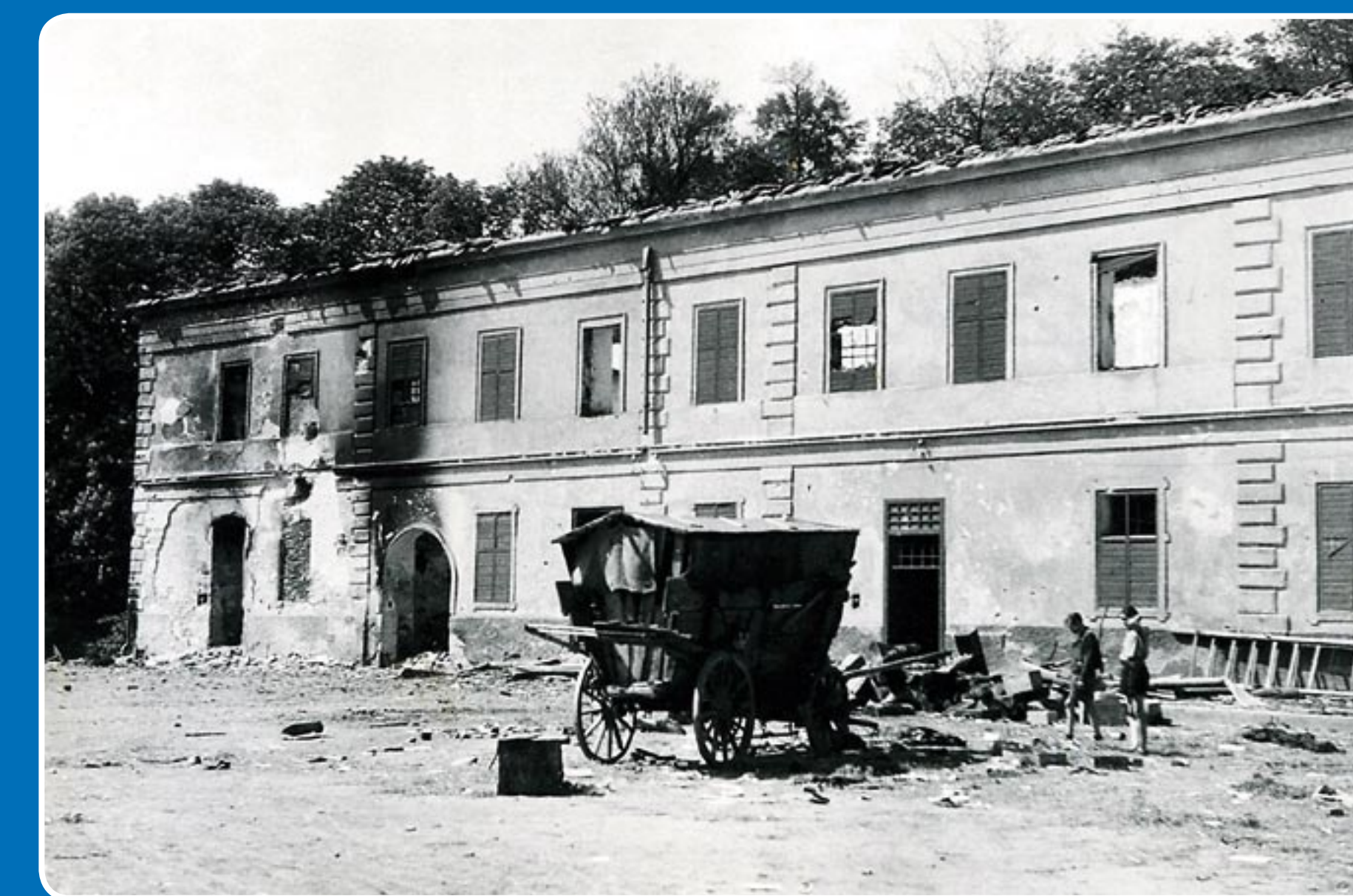
Severní křídlo, 1945 * Northern wing, 1945 * Nördlicher Flügel, 1945