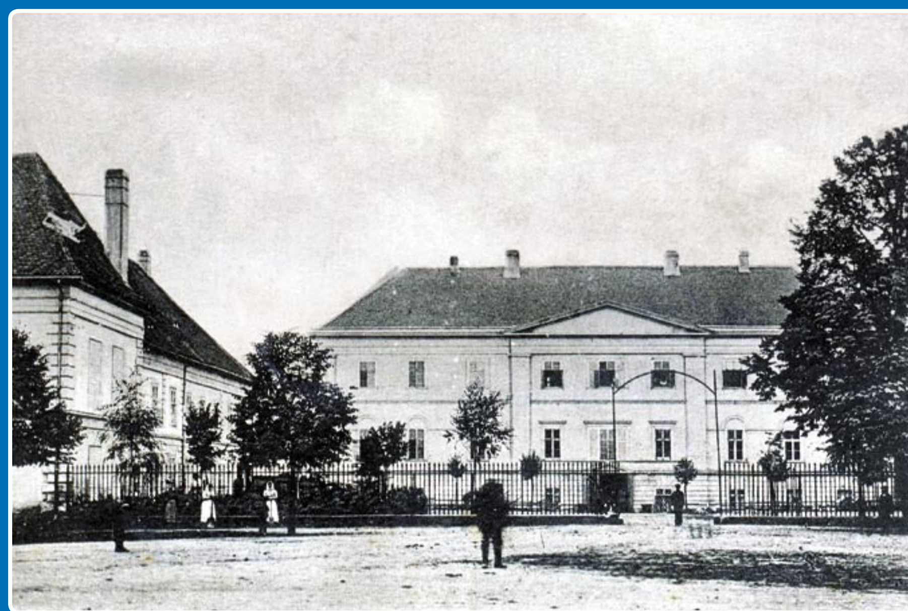
Pohlednice z roku 1916 * Postcard from 1916 * Ansichtskarte von 1916