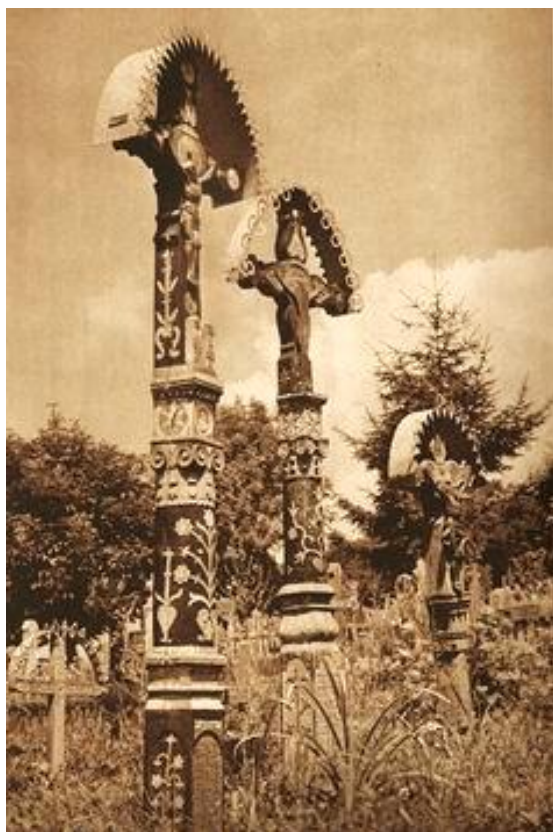
Kríže na cintoríne v Detve.

Sú jedinečnou súčasťou kultúrneho dedičstva Detvy, Hriňovej a obcí Podpoľania. Jedná sa o pozoruhodné prejavy tradičnej drevorezby, diela miestnych ľudových majstrov. Vyrábané sú ručne, najčastejšie z dubového dreva, zdobené kolorovaným vruborezom jednofarebným alebo viacfarebným. Prícestné kríže sa nachádzajú hlavne vedľa ciest v obciach regiónu a náhrobné kríže na cintoríne a Kalvárii v Detve.