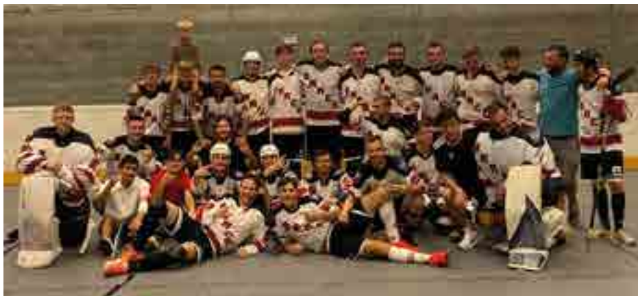
A tým Dobřan 15. 8. po zápase s Kertem Praha

Opět, a vlastně se dá říct, že i v poslední víc než dekádě let, pravidelně prolínáme mládež-