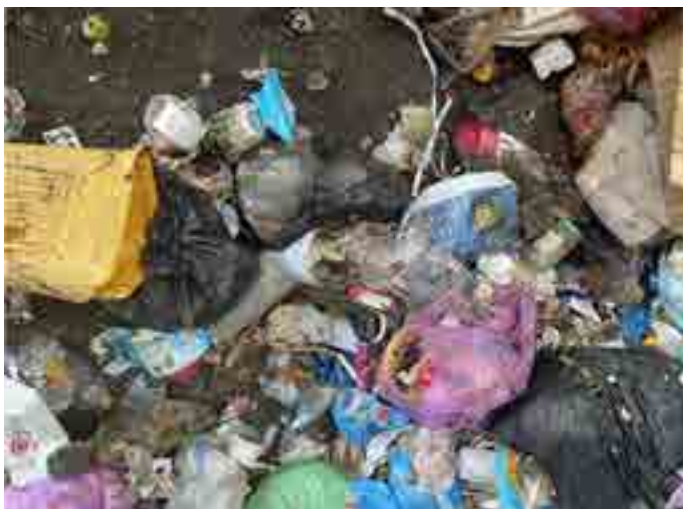
Směsný komunální odpad vysypaný z popelářského vozu

I další statistika je zajímavá, v průměru se u nás vyváží popelnice s 10 kg odpadu, průměr v jiných městech, kde jezdí stejná společnost, je 16 kg, do nádoby se v pohodě vejde ještě více.