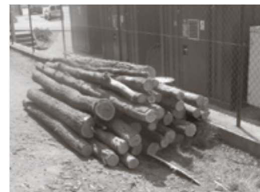
Krádež dřeva z lesa na Střížově – pachatel zjištěn.

• Dne 1. 5. ve 13.09 h byla hajným oznámena krádež dřeva v městském lese na Střížově. Na místě zjištěni dva bratři, kteří se pokusili dřevo odvézt v dodávkovém automobilu. Dřevo na místě vyloženo a krádež řešena v blokovém řízení.