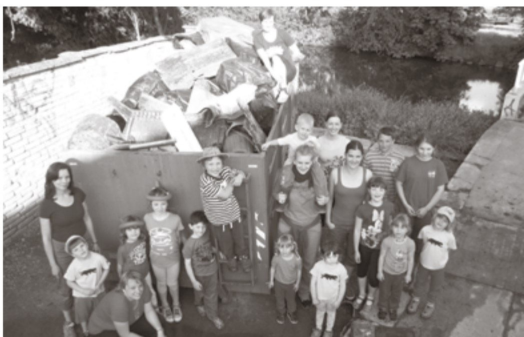
Po dobře vykonané práci se sluší společná fotka u kontejneru se sebraným odpadem.

z tras. „Opakují se stejná místa, lidé se prostě zbavují odpadu nejkratší cestou a nehladají cestu do sběrných dvorů. Oproti minule byly čisté rybářské fleky. Ale zase, mezi Borovy a Lužany někdo vyklízel autodílnu, sebrali jsme plno součástek. Pak jsme našli skládku starého ertenu. Jinak ne všichni vodáci pro dnešek opustili loď, část se na řeku vydala právě v nich, aby navigovala a dirigovala úklid z druhé strany, od vody. Bylo by zajímavé mít oči, které prohlédnou vodu. Asi bychom se divili, co vše řeka před námi skrývá,“ povzddechla si. (Šat)