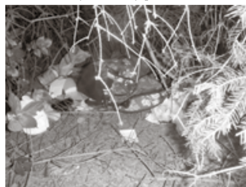
Odcizený batoh z vozidla na Masarykově náměstí – pachatel zjištěn.

ně napadla jinou ženu, která odmítla přispět – všichni vykáženi z místa – vše řešeno v blokovém řízení. Dne 11. 5. v nočních hodinách na rušení nočního klidu hlasitou hudbou z provozovny Na Kosině a dne 31. 5. v 5.10 h na osoby rušící noční klid v ul. V Brance – nepotvrzeno. Dne 24. 5. ve 22.48 h na pachatele rozbíjející okna v „modrém domě“, zjištěny podezřelé osoby, věc na místě předána policii • městským kamerovým systémem bylo zachyceno: 2x dopravní nehoda na Masarykově nám. a v ul. Mlýnská, jejichž řidiči z místa ujeli, zatažení nálezu peněženky s fin. hotovostí na Masarykově nám., krádež batohu s doklady a osobními věcmi z neuzamčeného vozidla zahradnické firmy na Masarykově nám. čtyřiatřicetiletým mladíkem z Nýrska, který poté batoh uschoval