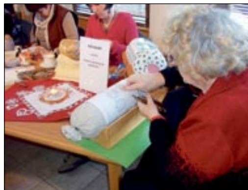
V rámci adventních akcí se v Domě historie Přešticka o stříbrné neděli představily členky přeštického klubu paličkářek. Před zraky návštěvníků jim pod rukama vznikaly krásné krajkové motivy. (šat)