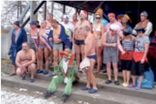
Otužilecké setkání začalo společným focením a pak již vyrazili otužilci k řece a postupně s radostí se do studených vod nořili.

Dotaz „Jaká byla voda?“ zodpověděla nejupřímněji jedna z koupajících úplně normálně: „No přece mokrá!“ (šat)