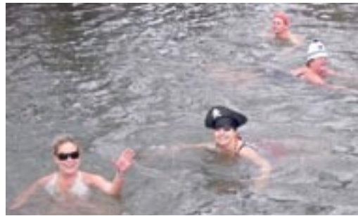
Při pohledu na milovníky koupání v ledové vodě mnohým přihlížejícím ještě více začaly mrznout uši a hledali rukavice, zatímco oni na ně z vody vesele mávali a volali.