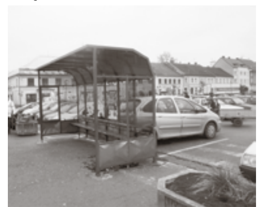
Poškozená autobusová zastávka na Masarykově náměstí.

Masarykově nám. mladík v bílých kalhotách rozbil skleněnou výplň autobusové zastávky. Hlídka na místě ihned zadržela osmnáctiletého mladíka z Merklína, kterého „chytl záchvat zuřivosti“ a poté vykopl sklo autobusové zastávky. Jelikož mladík v tentýž den poškodil hrací automat v jednom z místních barů, byl předán hlídce policie pro podezření z trestného činu výtržnictví. Jako důkazní materiál v tomto případě posloužil záznam z městského kamerového systému a svědectví občanů, za což jim městská policie děkuje.