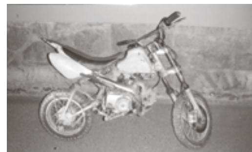
Zadržení pachatele trestného činu na odcizeném motocyklu.

Provedeným šetřením bylo zjištěno, že motocykl byl odcizen ve Vodokrtech.