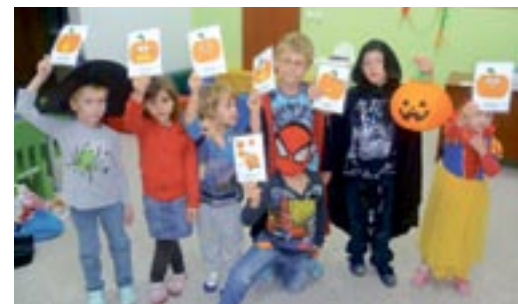
Halloween 2013 – mladší dětičky.

Závěrem zbývá jen dodat: „ Kolik jazyků umíš, tolikrát jsi člověkem. “