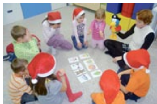
Vánoce s plyšovým kamarádem Jackem.