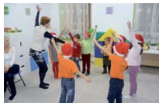
Učíme se části těla, pravá, levá...