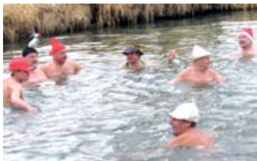
Všichni se ve vodě tvářili jako by nemrzlo a teplota vody nebyla jen lehce nad nulou, srandičky a společné foto nechyběly.