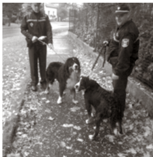
Odchyt psů MP Přeštic.

Městská policie Přeštic provádí odchyt toulavých a zaběhnutých psů v katastrálním území města Přeštic a městských částech Skočice, Žerovice a Přeštic Zastávka. Odchyt provádějí odborně vyškolení strážníci za použití odchytových pomůcek - odchytové tyče, narkotizační pušky atd. Odchycený volně pobíhající pes je umístěn do pohotovostního kotce městské policie a poté do městské záhytné stanice v Přešticích, ul. V Háječku (objekt vodárny).