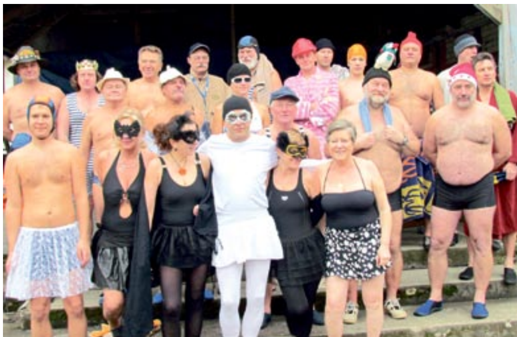
Při setkání otužilců vše začalo společným fotografováním, pak teprve otužilci zamířili do vody (v zadní řadě čtvrtý zleva host otužilců herec Pavel Nový).