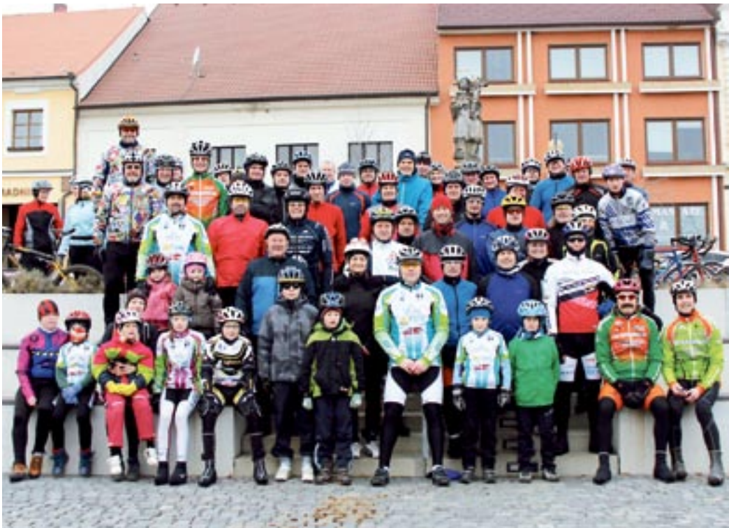
Tradiční novoroční cyklistická vyjížďka.