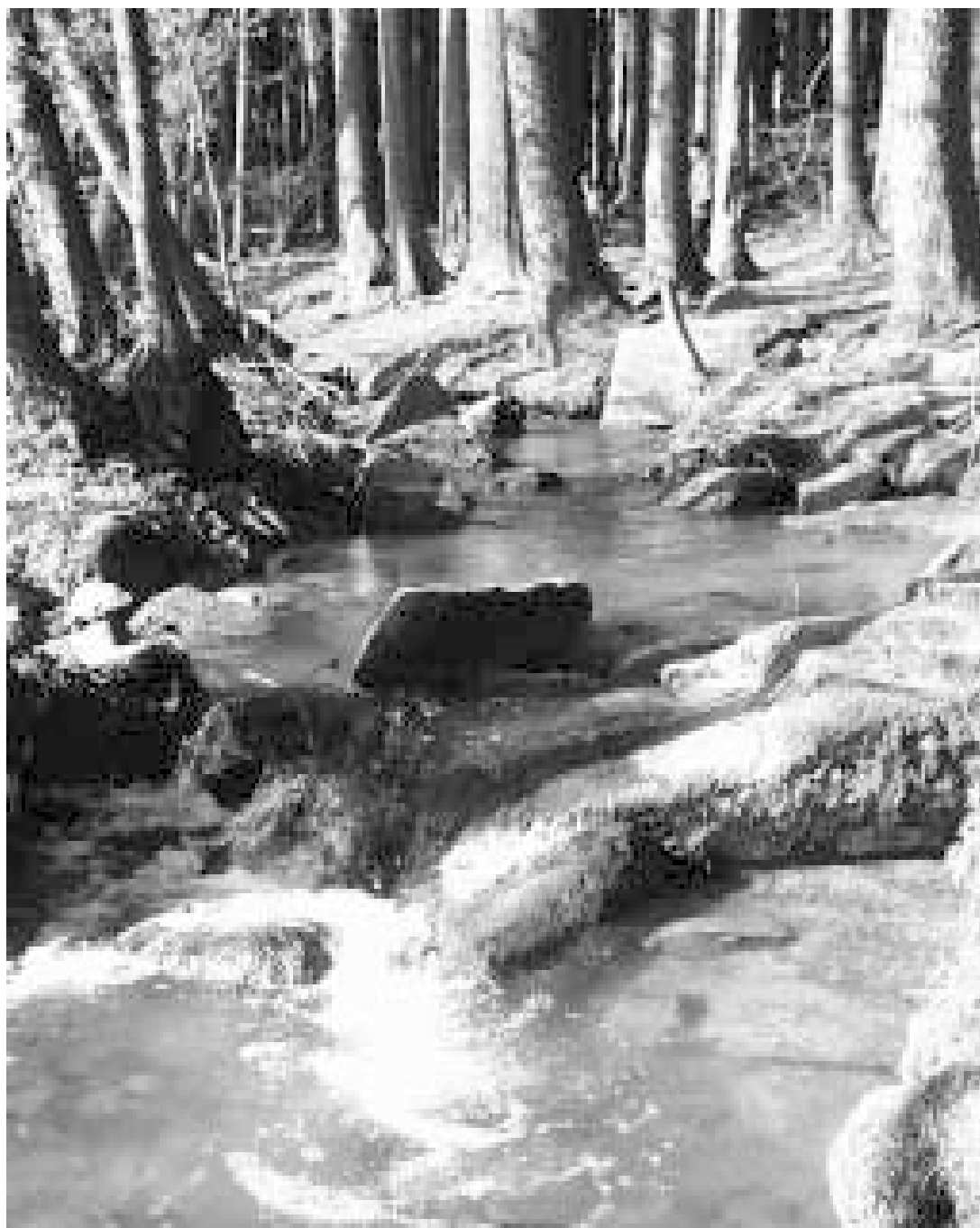
Z Rozkošného údolí

MĚSÍČNÍK MĚSTSKÉHO ÚŘADU • BŘEZEN 2003 • CENA 10,- Kč