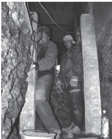
Osazování kamenných zárubní

Písemné prameny o tomto podzemí a jeho účelu nejsou známy. V roce 1934 byl v novinách Národní politika uveřejněn článek a fotografie podzemní chodby ve Světlé nad Sázavou. „Nedaleko kostela se hledal kryt a našli zajímavý labyrint chodeb. Jsou vytesány do skály, křížují se a mají mnoho slepých výběžků. Vedou pod několika soukromými domy, jsou asi