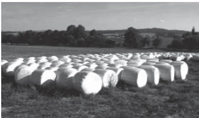
Je po sklizni