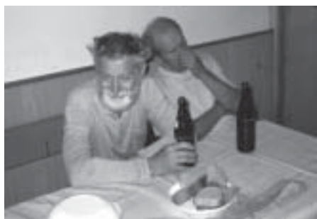
Nejvzdálenější účastník přijel až z Popradu

V pátek navečer byl start na nejdelší trasu – 100 kilometrů. První dálkoplaťové se k zimnímu stadionu v Pěšínkách scházeli kolem 17. hodiny, celkem se sešlo 27 stovkařů, z nichž jeden po noční pětadesátce skončil. V sobotu od šesté hodiny ranní vycházeli účastníci postupně na trasy 50, 35, 20 a 10 km. Ironií je, že několik týdnů před pochodem nepršelo, až tento pátek večer a pak zase v sobotu ráno. V obou případech sice déšť netrval dlouho, nicméně vliv na účast měl, zejména cyklistů.