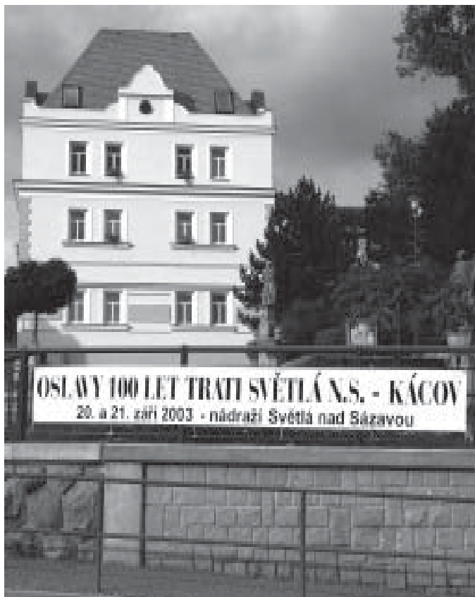
Transparent zvoucí k oslavám