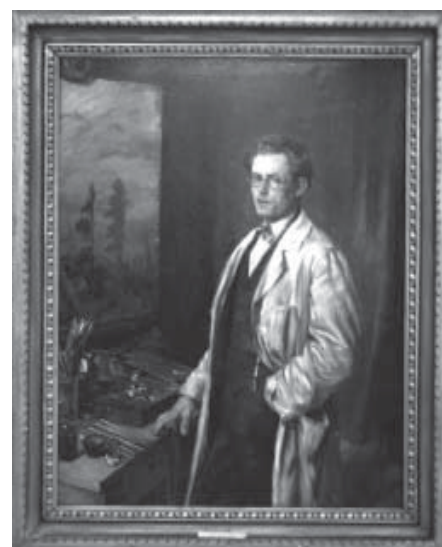
Portrét od F. A. Jelínka

Od narození mnohostranného umělce uplyne příští rok sto dvacet let. Na domě v Mánesově ulici 20 v pražských Vinohradech, kde žil a spolu s manželkou zahynul při spojeneckém náletu v únoru 1945, bude odhalena pamětní deska. Vyjde také jeho monografie a souborné vydání ex libris. V havlíckobrodském Muzeu Vysočiny bude výstava k vidění až příští rok v září. Předtím totiž zavítá na Slovensko a Havlíčkův Brod bude posledním z řady měst, kde se výstava zastaví.