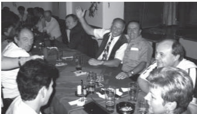
Pivnice Malý Honza – setkání spolužáků po 35 letech od ukončení základní školní docházky