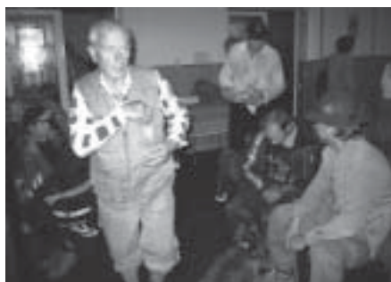
Ruch na startu

O celkem 171 startujících se staralo 21 pořadatelů, kteří byli na startu a na kontrolách v Brtné, na Lipnici, na Melechově a v Hojanovicích. Pěších účastníků bylo 136, cyklistů přijelo pětaticet. Nejvíce zájemců z řad pěších turistů (54) bylo o dvacetikilometrovou trasu.