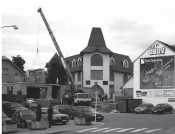
Stavba polyfunkčního domu na místě čp. 162 pokračuje