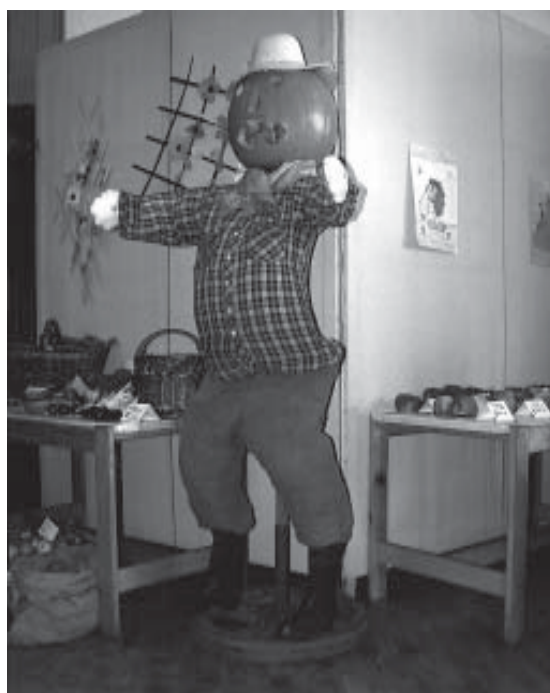
"Zahrádkář" v montérkách – dílo Luboše Maška

Za ZO ČZS: Josef Skala