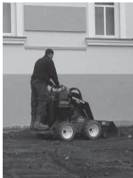
Úprava terénu před radnicí