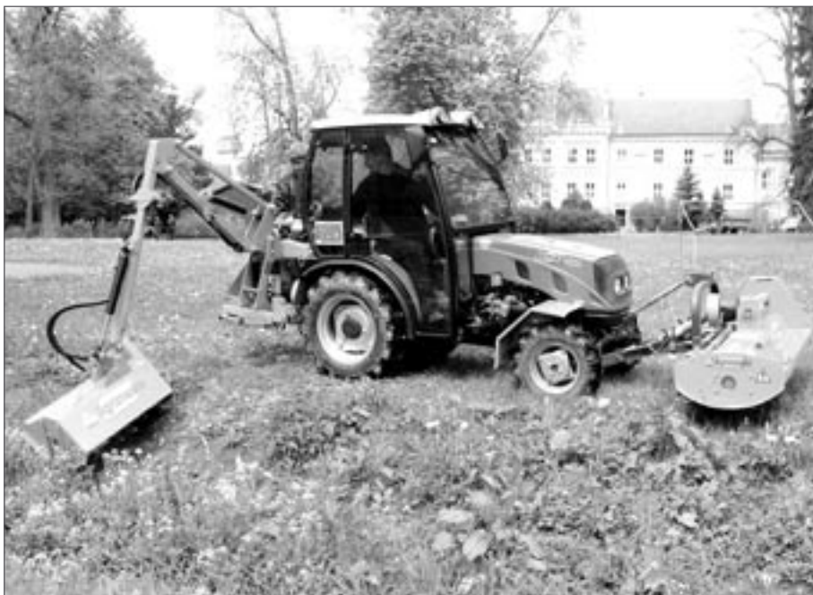
Malotraktor s ramenem Green Shark

V členitém terénu prokázaly své uplatnění v péči o trávníky mulčovače YOYO a Peruzzo, který je vybavený sběrným košem. Pneumatické nůžky ukázaly, jak si usnadnit namáhavou práci s průklestem stromů, a štěpkovač Pezzolato, jak pořezané větve a kmeny zpracovat na drobnou štěpku, použitelnou jako vylehčující komponent do