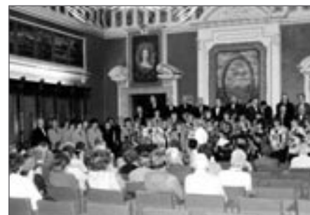
Soubory Gaudeamus a Bendl v Rytířském sále