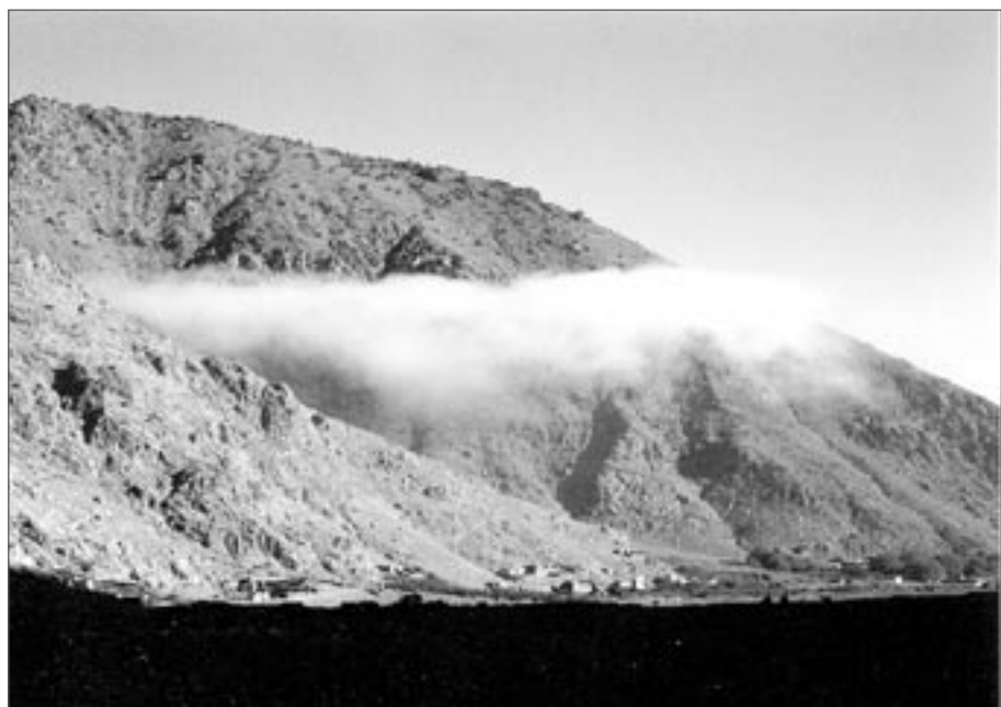
Mrak v údolí

krásná vyhlídka hluboko do údolí, na jehož dně se chata Neltner jeví jako malá krabička a naše stany jako malé tečky. Přeskok přes potok je ještě horší, než když jsme šli nahoru, protože máme mokré podrážky. V poledne vcházím do chaty a přijímám pozvání na mátový čaj. V Maroku mu říkají berberská whisky,