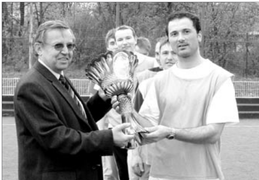
Kapitán vítězných Křepin přebírá pohár od starosty

V malém finále o třetí místo zvítězilo ROSSI nad Maximem přesvědčivě 6:1, velké finále Premium Světlá – Křepiny skončilo bez branek a o majitelích poháru starosty musely rozhodnout penalty.