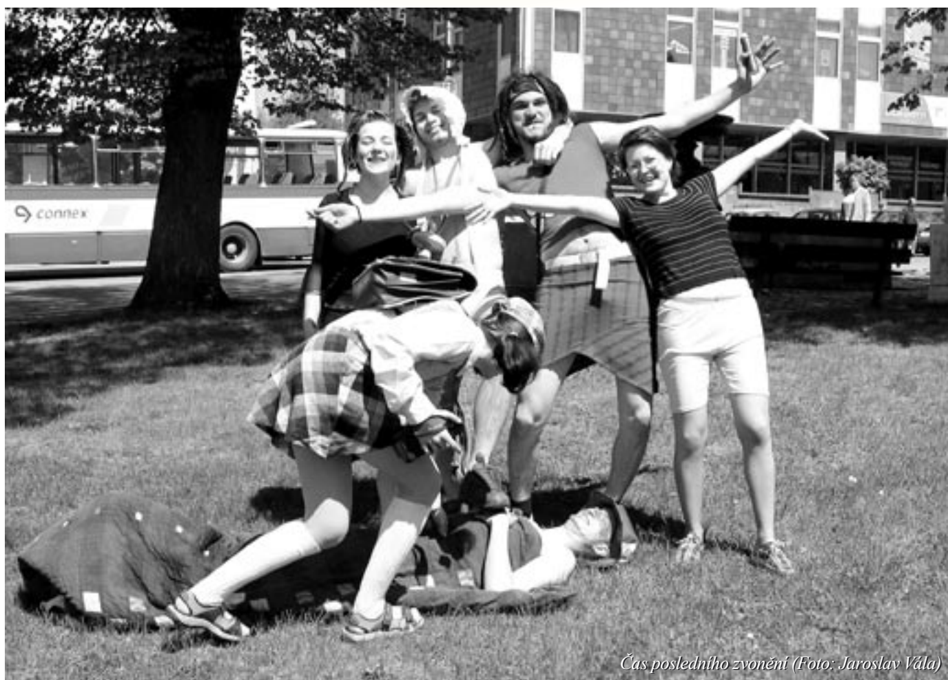
Čas posledního zvonění

měsíčník městského úřadu • červen 2005 • cena 10,- Kč