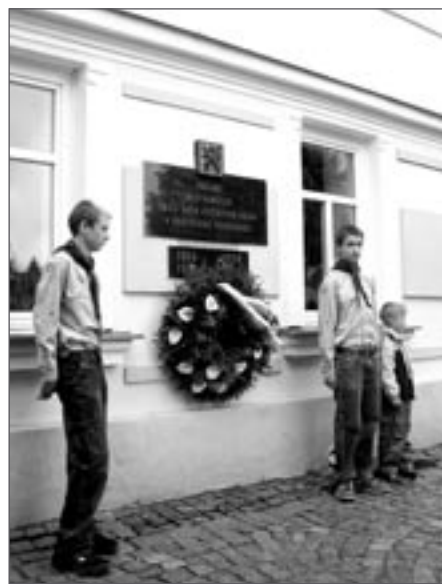
U pamětní desky na radnici