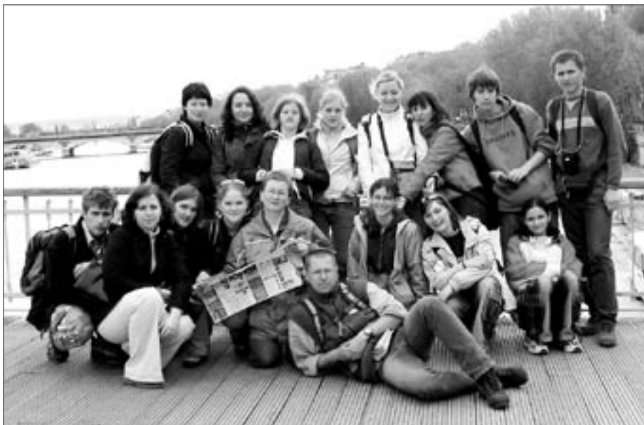
Světělští studenti nad Seinou