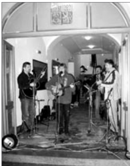
Hraje country skupina Fernet

časovým odstupem říci, že zdařile. Ať už to byla výstava s tematikou války a osvobození Světlé n. S., výstava malířů neprofesionálů, slavnostní akademie světelských základních škol a umělecké