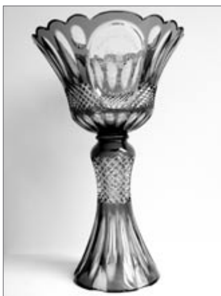
Pohár pro vítězné mužstvo vyrobila sklárna Caesar Crystal Josefodol

Výsledky čtvrtfinále play off: ROSSI Havlíčkův Brod – Hokejky Havlíčkův Brod 1:0, Křepiny – King Humpolec 2:1, Premium Světlá – Team Světlá 2:0, Maxim Světlá – Úsobí 5:1. Semifinále: Křepiny – ROSSI Havlíčkův Brod 1:0, Premium Světlá – Maxim Světlá 2:1.