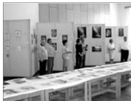
Z vernisáže ve společenském sále