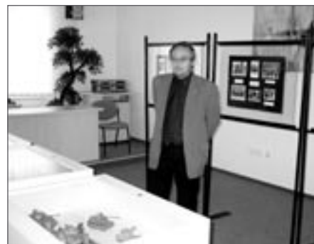
Z vernisáže na radnici

byly pod sklem vystaveny různé dobové písemnosti a dokumenty, jako zatykače nebo papírové protektorátní peníze, v sousedních vitrínách byly umístěny trojrozměrné exponáty, pocházející ze soukromé sbírky: přilba Mk1 (GB), plynová maska vz. 1938, polní láhev, jídelní miska vz. 1931, přilba jednotek Luftwaffe vz. M 42 či knoflíky k uniformě válečného letectva RAF, a také několik medailí, např. Za osvobození Prahy, Za vítězství nad Německem nebo Válečný kříž 1939 a medaile Za zásluhy, založené československou vládou v Londýně. Zaslouženou pozornost také poutaly modely letadel ze sbírky Pavla Svobody,