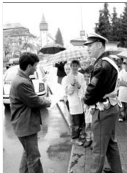
Jezdíme s úsměvem – pokutujeme s úsměvem