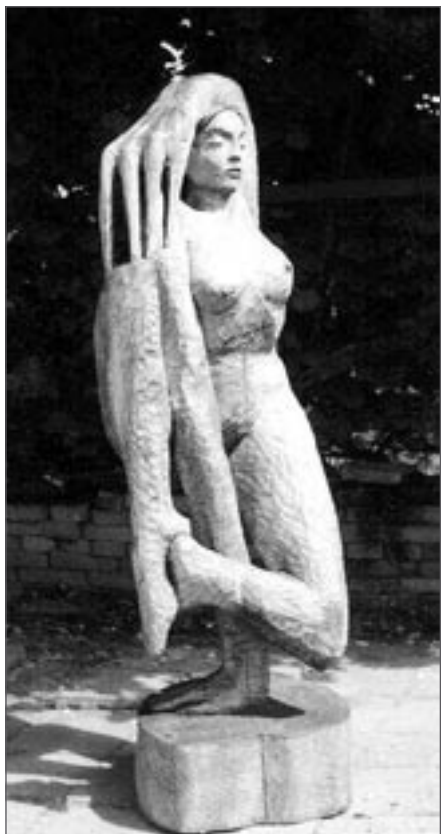
Skulptura z lipového dřeva