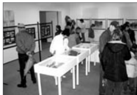
Poslední možnost zhlédnout výstavu