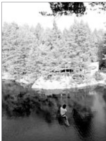
Bývalý lom Hřebeny

Z náměstí se vydáte po červené turistické značce kolem zahrádkářské kolonie a přes Dolní Březinku k zastávce ČD Mrzkovice. Po žluté turistické značce se vydáte přes Mariadol, údolím Pstružného potoka k Malému Mlýnku a dál až do Radostovic. Přejdete silnici Světlá n. S. – Humpolec a budete pokračovat