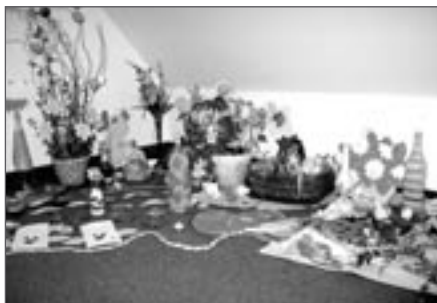
Výstava na téma Jaro