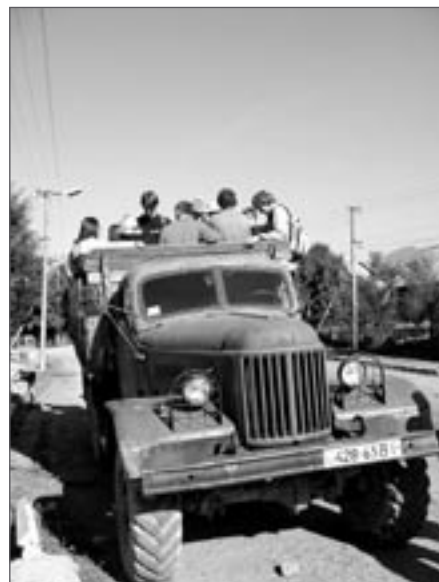
„Gruzavík“ ZIL s drahocenným nákladem českých studentů