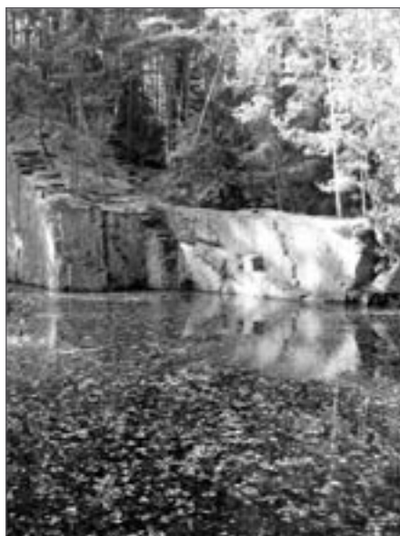
Sousední zatopený lom

V tradici dobývání a zpracování žuly dnes pokračuje společnost Granit Lipnice s.r.o. Vyrábí dlažbu venkovní i vnitřní, schodiště, obklady schodišť a stěn, obrubníky a krajníky, soklový kámen na budování opěrných zdí a soklů budov a nakonec regulační kámen, který se po-