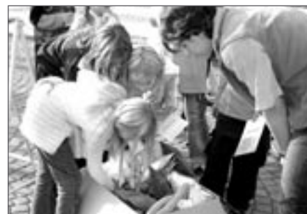
Při výběru hračky