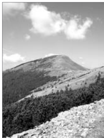
Strimba – dominantní hora okolí Koločavy