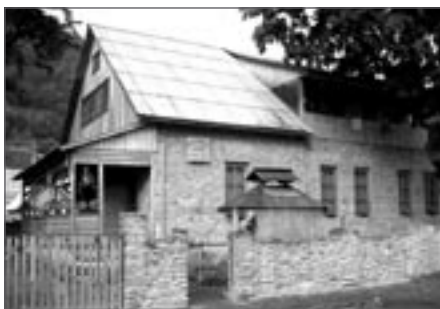
Bývalá četnická stanice v Koločavě, nyní penzion a hospůdka provozovaná Natálií Tumarec

V neděli ráno vyrážíme pěšky k místní škole, kde nás čeká „gruzavík“, tedy po česku nákladňák – starý, ale výkonný třinápravový vyřazený vojenský ZIL. Většina z nás cestuje na třesoucí se korbě