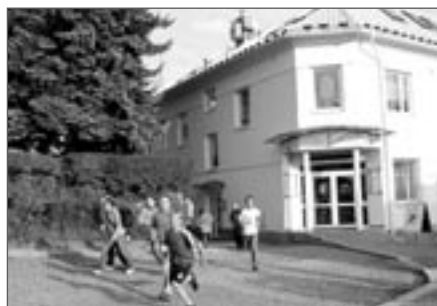
V polovině trasy

V letošním roce, tak jako v roce loňském, se do této akce zapojila také Věznice Světlá n. S.