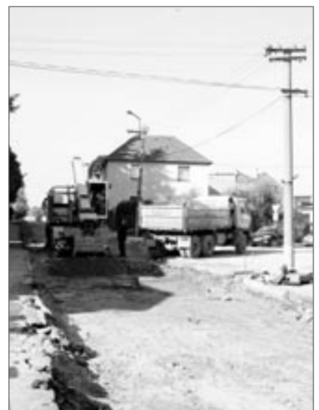
Pracovalo se i v neděli (foto z 9. října)