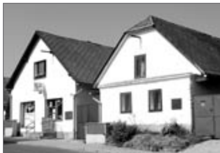
Dům čp. 108 druhý zleva

Zatím nejstarší nalezená zmínka je z roku 1836. V roce 1857 jsou uvádě-