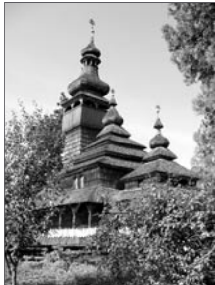
Pravoslavný kostelík v užhorodském skanzenu