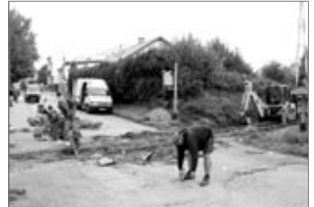
V pondělí 26. září

Hned po skončení Svatováclavské pouti došlo na další část – od křižovatky s Čapkovou ulicí k železničnímu přejezdu a následně od železničního přejezdu až ke křižovatce s Nádražní ulicí.