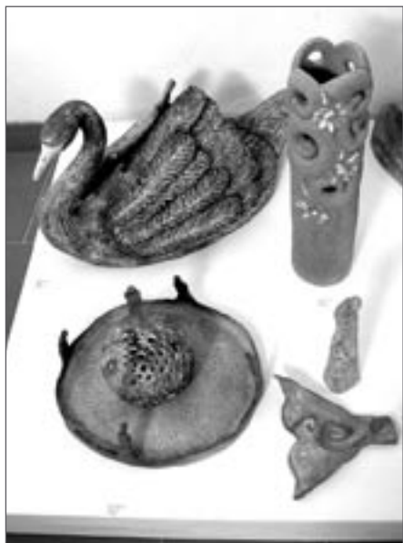
Ilustrační foto: archiv školy