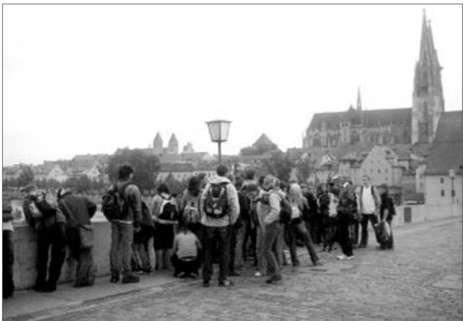
Studenti naslouchají výkladu průvodce, v pozadí chrám sv. Petra

až ze středověku, k nejvýznamnějším samozřejmě patří dominanta města – gotický chrám sv. Petra, dále budova arcibiskupství, několik klášterů, stará