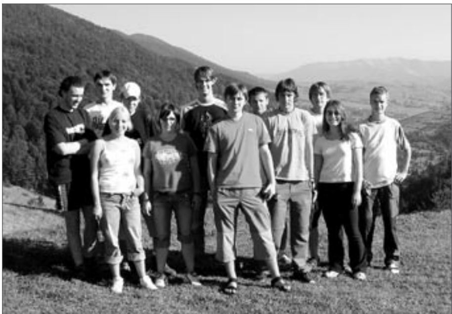
Studenti v sedle nad Siněvirem