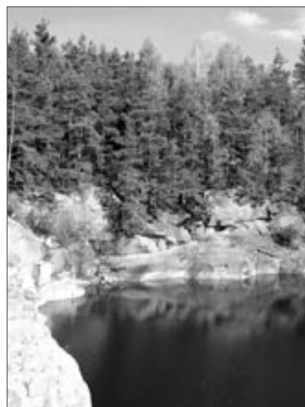
Jeden z mnoha

Kromě jiných činností pořádá ČTU tábornické školy, na nichž si zájemci osvojí znalosti a dovednosti z mnoha oborů, které jsou ve vztahu k přírodě a tábornické filozofii: orientace v terénu, topografie a práce s mapou a buzou, pohyb v nebezpečném terénu, základy horolezectví, práce s provazem, tábornickým náčiním a náradím, poznávání přírody, lesa, rostlin, základy ekologie, tábornické astronomie a meteorologie, zdravotvěda, přežití a bivak v lese, základy potápění, sebeobranu, fotografování a mnohé jiné tábornické dovednosti, jako je lasování, ovládání biče, hod bumerangem, nožem atd.