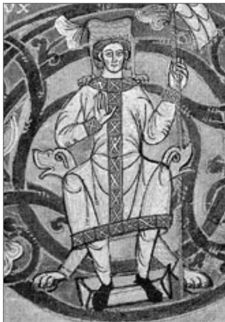
Iniciála D se sv. Václavem z Vyšehradského kodexu

Velkým otazníkem je však rok, kdy vitraj s podobou patrona kostela okno v presbytáři ozdobila. Jediný zápis v Sei-