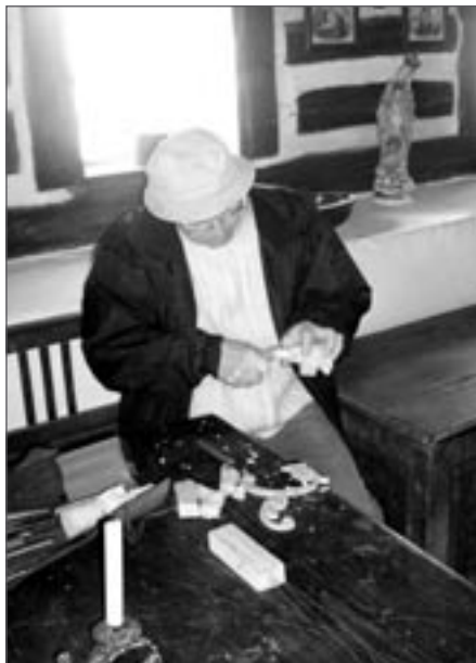
Lidový řezbář při práci

Velice vydařenou kulturní akcí Světelska byly o posledním předvánočním víkendu již druhé Staročeské Vánoce v muzeu lidových staveb na Michalově statku v Pohledí.