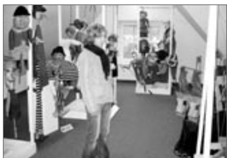
Na výstavě