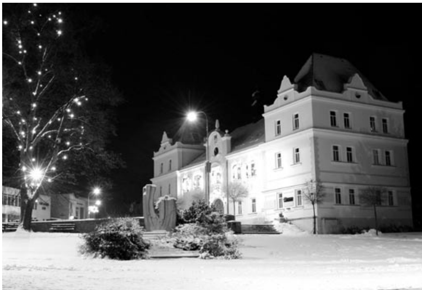
Zimní idyla

měsíčník města • leden 2006 • cena 10 Kč