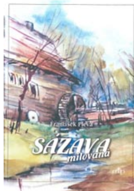
Obálka nové knihy

vylepena poštovní známka s přítiskovým kupónem v podobě obálky křtěné knihy a s otištěným poštovním datumovým razítkem. Další, tentokrát příležitostné razítko si mohli zájemci nechat otisknout na titulní stranu knihy, což také mnozí udělali – ještě před tím, než se zařadili do dlouhé fronty na podpis autora.