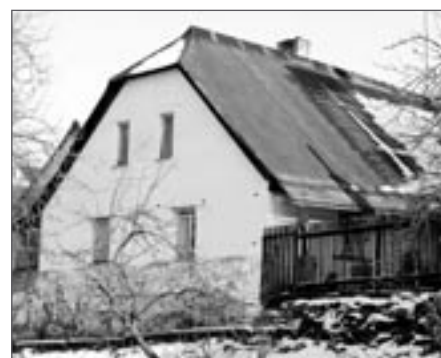
Pohled od řeky