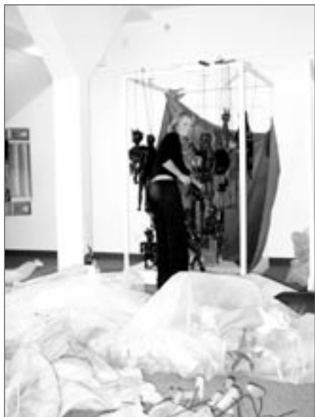
Instalace výstavy