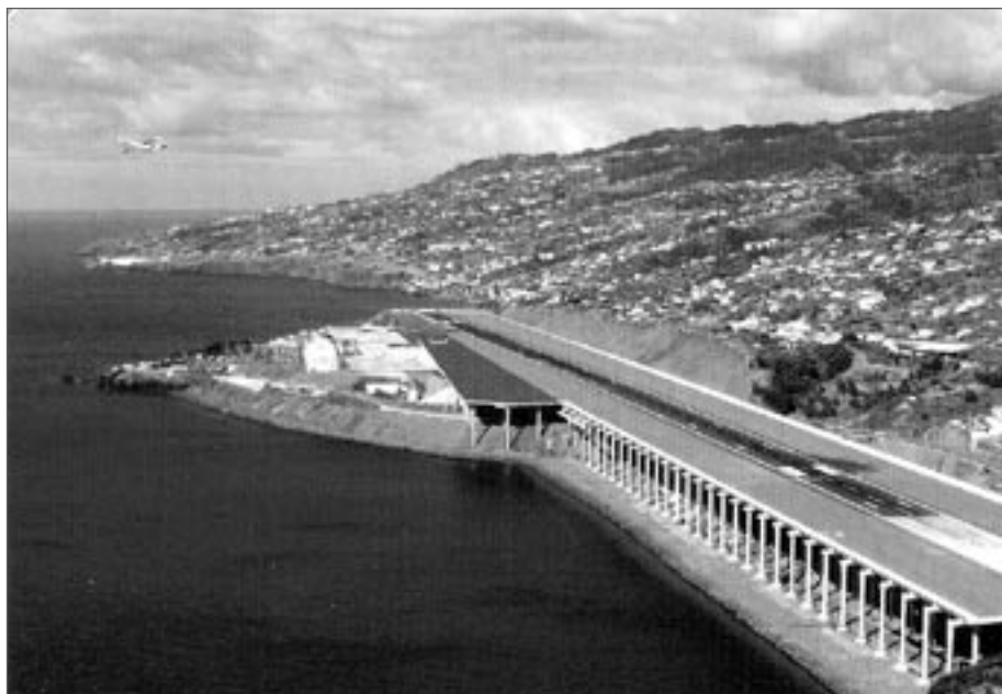
Letiště Santa Catarina

dobných letním. Má nádhernou, téměř 10 kilometrů dlouhou pláž se zlatavým pískem. Na této pláži se nemůžete spálit, protože písek je radioaktivní s léčivými účinky, zvláště účinný je prý při