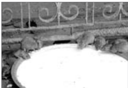
Krysa v chrámu v Deshnoku