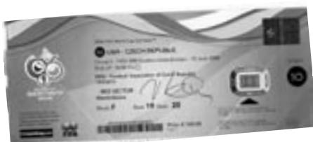
Vstupenka s podpisem prezidenta ČR