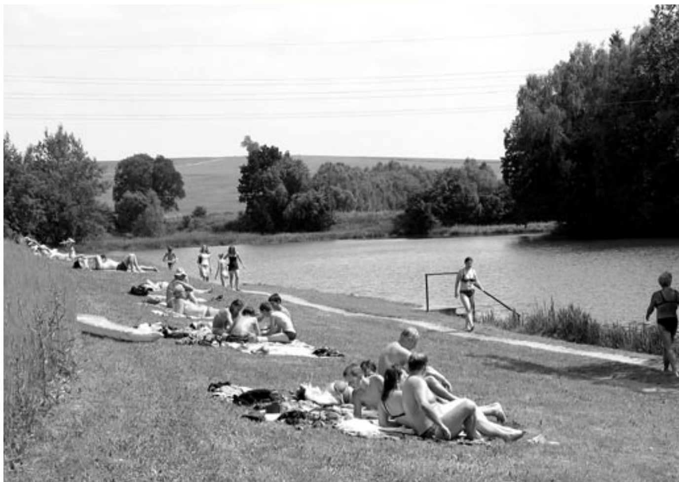
U rybníku za parkem

měsíčník města • červenec-srpen 2006 • cena 10 Kč