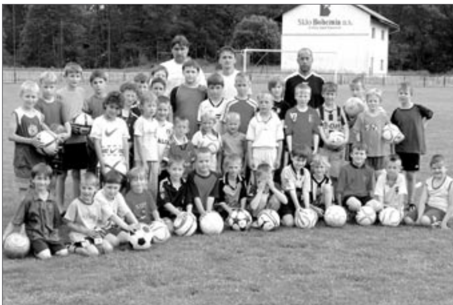
Příprava se svými trenéry před posledním tréninkem sezony