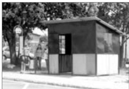
Provizorní čekárna v Komenského ul.