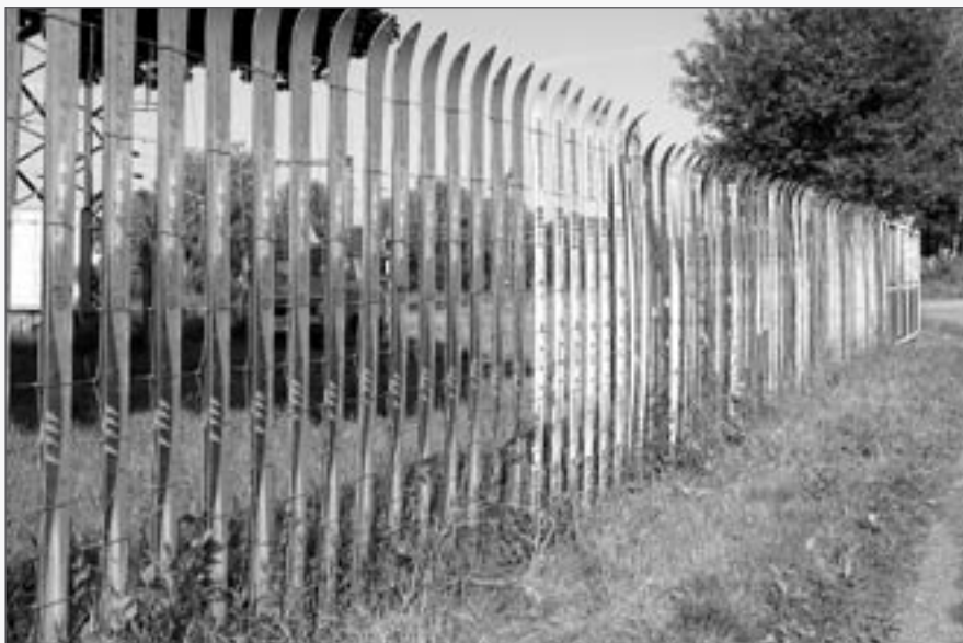
Zima byla letos dlouhá – a tohle po ní zůstalo (plot kolem bývalého hradla u železničního přejezdu na Josefodol).