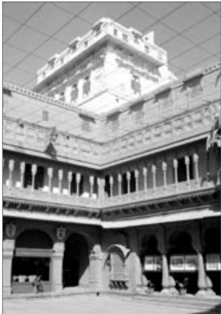
Palác v pevnosti Džunagarh

► „pneuservisu“. Blíží se západ slunce a my konečně vjíždíme do půlmilionového Bikanéru, města založeného roku 1486. V Lonely Planet vybíráme levný hotýlek Harasar Haveli a po chvíli bloudění nás místní tuk-tukář vede přímo na jeho dvůr. Příjemná cena a čisté pokojíky jsou dobrým začátkem.