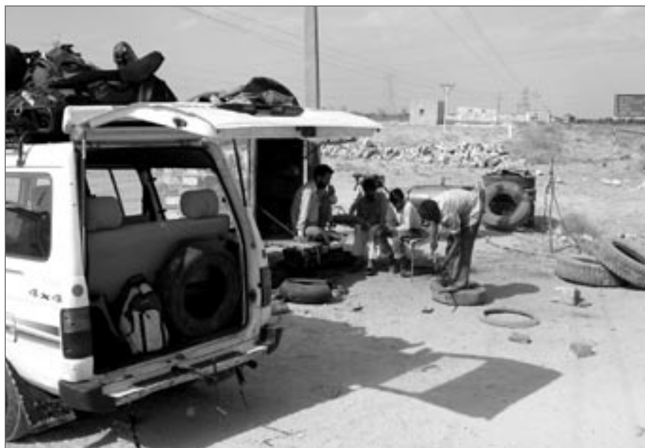
Indický pneu servis

Po mnoha hodinách úmorné jízdy se dostáváme na okraj Tháru. Venku je teplota kolem 30°C a v přehřátém vzduchu se tvoří více než 100m vysoké prachové víry, působivé divadlo přírodních sil. Cestu nám „zprjemňují“ dva defekty na pneumatice a jedna výměna pláště kola v místním