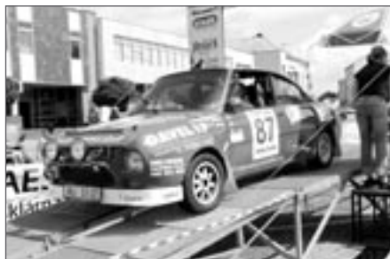
Škoda 130 RS posádky Doubrava – Vondra

5. ročník automobilové soutěže Rallye Světlá byl z technických důvodů přeložen z tradičního podzimního termínu na červen, s večerním startem v pátek 23. před radnicí na náměstí Trčků z Lípy. Pro diváky, kteří během rychlostních