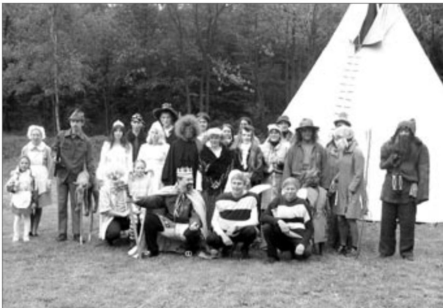
Další fotografie na www.pohadkovyles.wz.cz