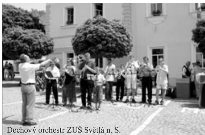
Dechový orchestr ZUŠ Světlá n. S.