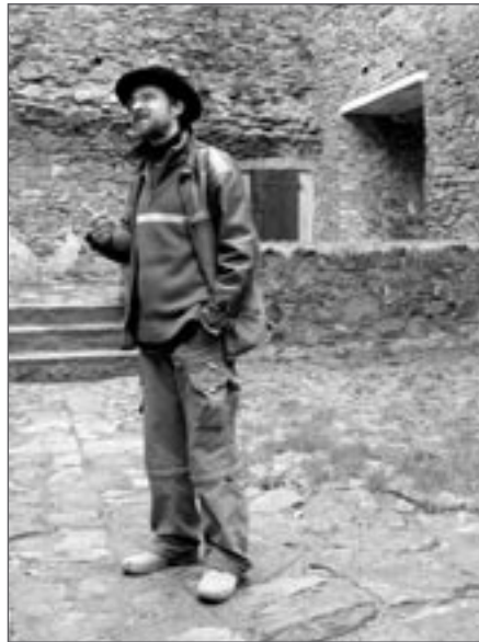
Uprostřed Trčkovského paláce

Několik let jsme bydleli v montovaném domku, který patří ke správě hradu, ale jak se rodina postupně rozrůstala, hledali jsme něco jiného. Měli jsme vytipované