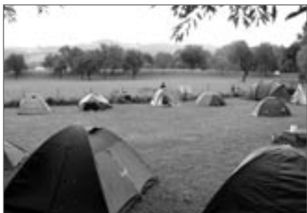
Ráno v kempu Hofmühle

Poslední úsek cesty nemusíme ani moc šlapat, vydatně nám pomáhá do zad foukající vítr. Pár kilometrů před cílem bohužel zjišťujeme, že cyklostezka odbočila doleva a tato cesta končí u zdymadla. Otáčíme a naše rychlost rázem klesá na polovinu. Proti větru je to mnohem namáhavější, naštěstí to už do kempu není daleko. Sjíž-