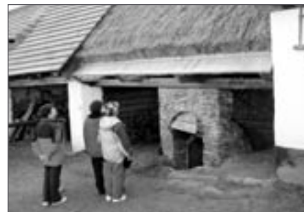
Zrekonstruovaný sklep s krásnou doškovou střechou