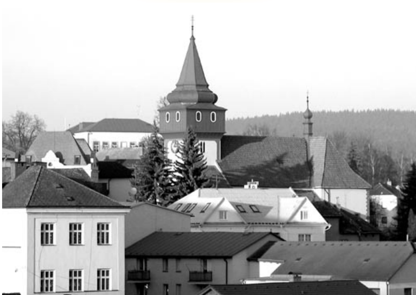
Střechy a věž kostela

měsíčník města • leden 2007 • cena 10 Kč