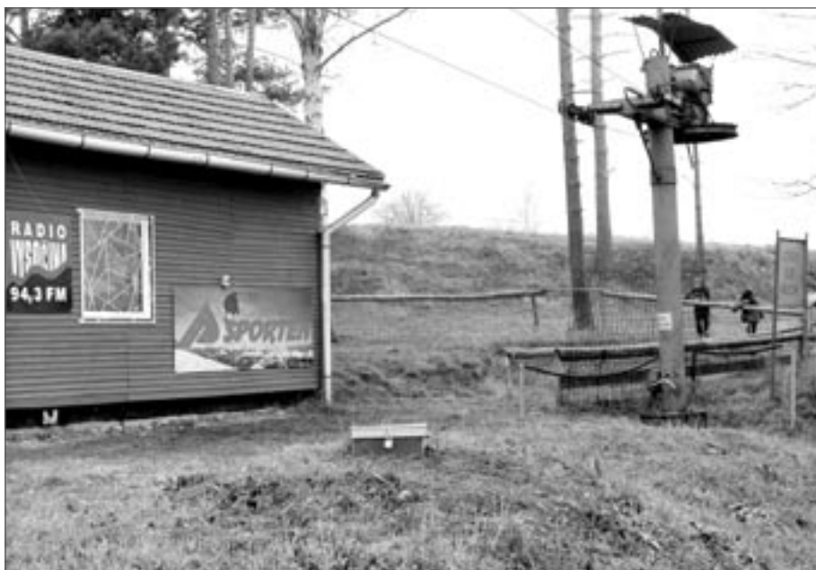
Opuštěná nástupní stanice vleku o Štědrém dnu 2006

skou sezonu ještě před Vánoce, což nebylo v předcházejících letech obvyklé. Navíc každodenní noční mrazy umožňovaly pravidelné zasněžování. Však se také světelská sjezdovka pečlivou úpravou povrchu vyrovnala skiareálům v horských střediscích.