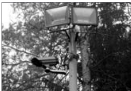
Část světelské výpravy v hledišti

Letošní opravdové zimní počasí na sebe nechává nezvykle dlouho čekat, přitom lyžařský svah na Kadlečku byl již