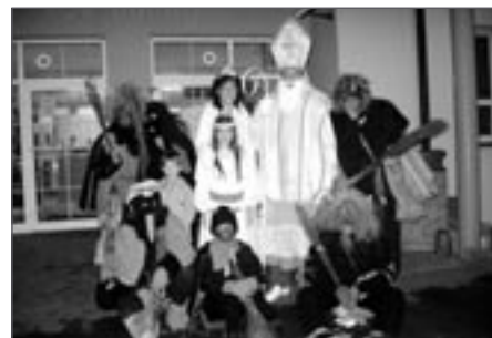
Mikuláš a jeho suita

ce. Jako každý rok i letos se k nám přihrnula spousta čertů při rachotu řetězů a ohnivých ran to chvíli u nás vypadalo jako v opravdovém pekle. Naštěstí s čerty přišel i hodný Mikuláš s dvěma anděly a všem nám nadělil dárečky