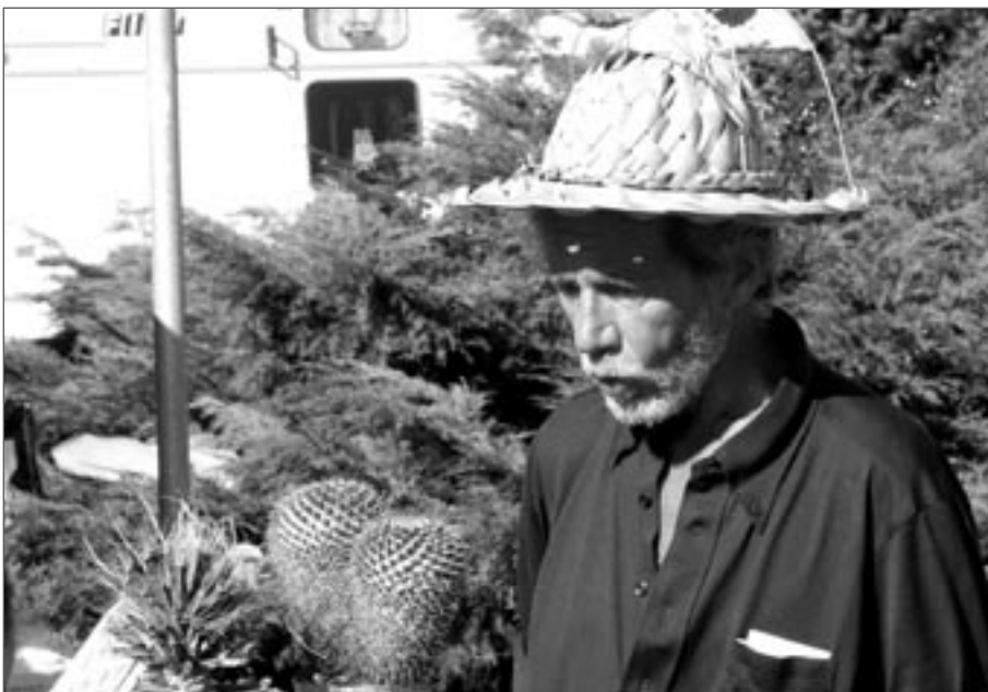
Vzpomínka na pouť aneb Chlupatý kaktus mám tak rád, je to můj zelený kamarád...