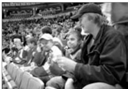
Část světelské výpravy v hledišti

Český svaz ledního hokeje rozeslal 7 000 vstupenek do mnoha klubů po celé republice s tím, aby se do hlediště dostali malí hokejisté. Tento čin hokejových bossů určitě přispěl k další propagaci našeho zlatého sportu mezi mládeží. Však si toho děti, oblečeny do dresů svých klubů, náležitě užívaly a pranic jim nevadilo, že například pořadatelé na parkovišti u haly vybírali neuvěřitel-