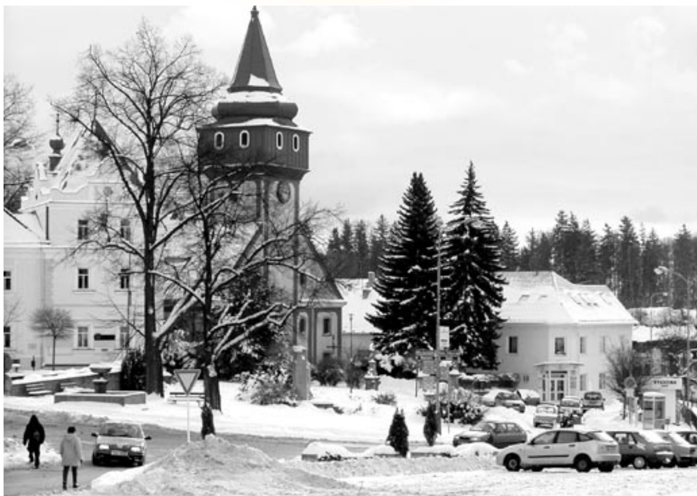
Věřte – nevěřte, ale je to letošní snímek!

měsíčník města • březen 2007 • cena 10 Kč