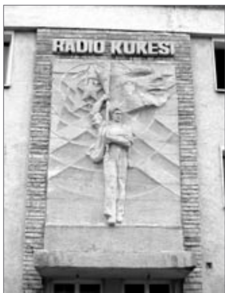
Vchod budovy Radia Kukës

kvapivě vládne německy a vysvětluje, že do našeho cíle je to ještě nějakých 20 km a že si máme v klidu nastoupit. Jízda je docela adrenalinová, cesta nemá zpevněný povrch, místy chybí krajnice a následuje prudký sráz hluboko dolů, což je zajímavé hlavně v ostrých zatáčkách, kdy se kabina ocitá těsně nad oním srázem.