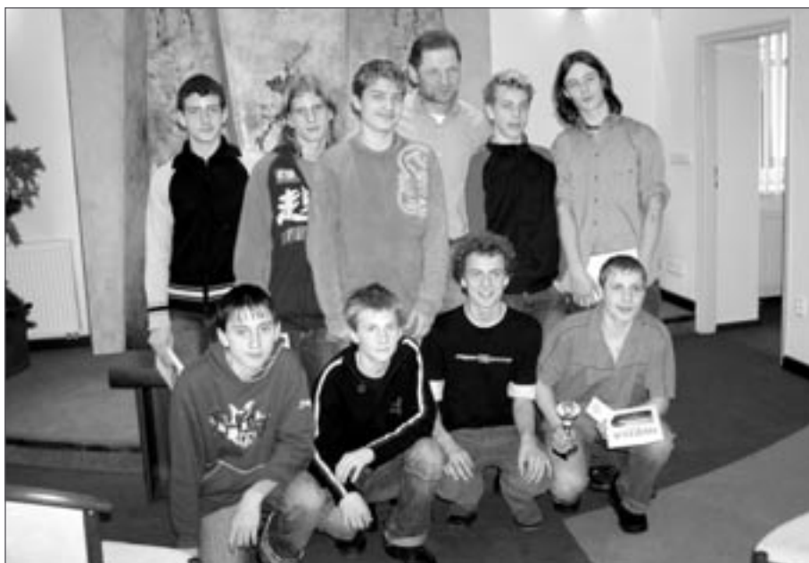
Úspěšné družstvo atletů ZŠ Komenského se slavným hokejistou Františkem Musilem