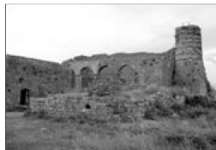
Na nádvoří hradu Rozafa

z města, stopnout něco do hor směrem k hranici s Kosovem, což je asi 150 km. Po pár hodinách a třech úžasných stopech se dostáváme do zaprášeného městečka Fushë Arrëzi, ležícího uprostřed nepříliš pohostinných hor. Zpočátku to vypadá, že nás štěstí opouští a nic směrem do Kosova nepojede. Pak se nás ale ujímá příslušník místní policie a káže nám sednout si na kamennou zídku a čekat. Tak uvidíme. Po chvíli plácačkou zastavuje stříbrný seat a velí nám složit batohy do kufru a usadit se dovnitř. Řidič je docela sympaták, nemluví sice anglicky, ale přesto se nám daří