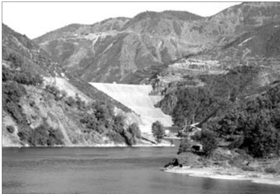
Hráz jezera Fierza

V žáru poledního slunce vystupujeme u Fushë Arrëzi a čekáme, zda pojedou nějaký povoz naším směrem. Kupodivu již po půl hodině staví desetimístná dodávka obsazená 14 lidmi a naložená pytlí s různorodým obsahem. Přesto se nám ještě podaří nasoukat dovnitř a svést se asi 20 km. Pak prý to již do našeho cíle máme kousek. Asi 5 km. Tak s důvěrou „pěšo“ vyrážíme. Po dvou hodinách začínáme pochybovat o věrohodnosti této informace. Co nás udržuje v báječné náladě, jsou nádherné vrcholky místních hor. Pohled na ně nemá prostě chybu. Naštěstí se za námi ozývá hukot nákladáku, a tak mávám pravačkou. Vždyť je to již druhé auto, které to odpoledne jede naším směrem. Borec za volantem se na nás zubí a staví. Pře-