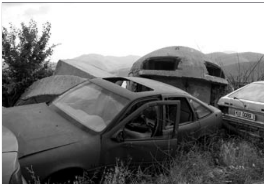
Vrakoviště aut a bunkerů, Kukës