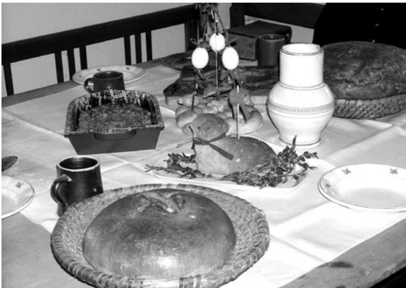
Velikonoční stůl

měsíčník města • březen 2008 • cena 10 Kč