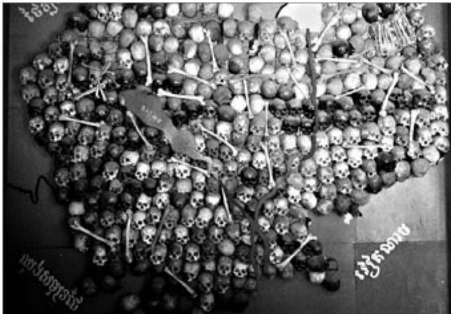
Mapa Kambodži z lidských lebek. Plocha v levé třetině označuje rudou barvou symbolizující krev jezero Tonlesap

jeden z nejkřutějších diktátorů 20. století. Rudí Khmérové pod jeho vedením aplikovali svou vlastní formu „kulturní revoluce“. Města byla vysídlena a jejich obyvatelé nuceni odejít na venkov, kde museli nelidským způsobem pracovat pro blaho všech. Byl zakázán obchod a zrušeny peníze. Lidé měli přikázáno nosit jednotné stejnokroje. Inteligence, vědci, učitelé nebo jen ti, co nosili brýle, byli