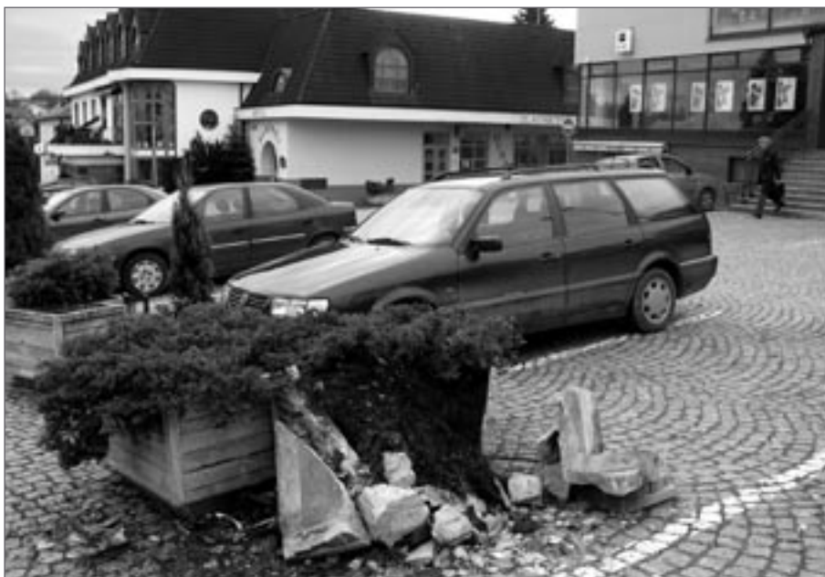
Následek jedné lednové zběsilé noční jízdy

V období od 17. do 30.1. dosud neznámý pachatel odcizil u přejezdu za železniční stanicí Okrouhlice měděné lano o délce 150 cm a dále se pokusil odcizit další měděná lana sloužící k propojení koleje s napájecí skříní kolejového obvodu. Ty přestříhl a poškodil. Odcizením