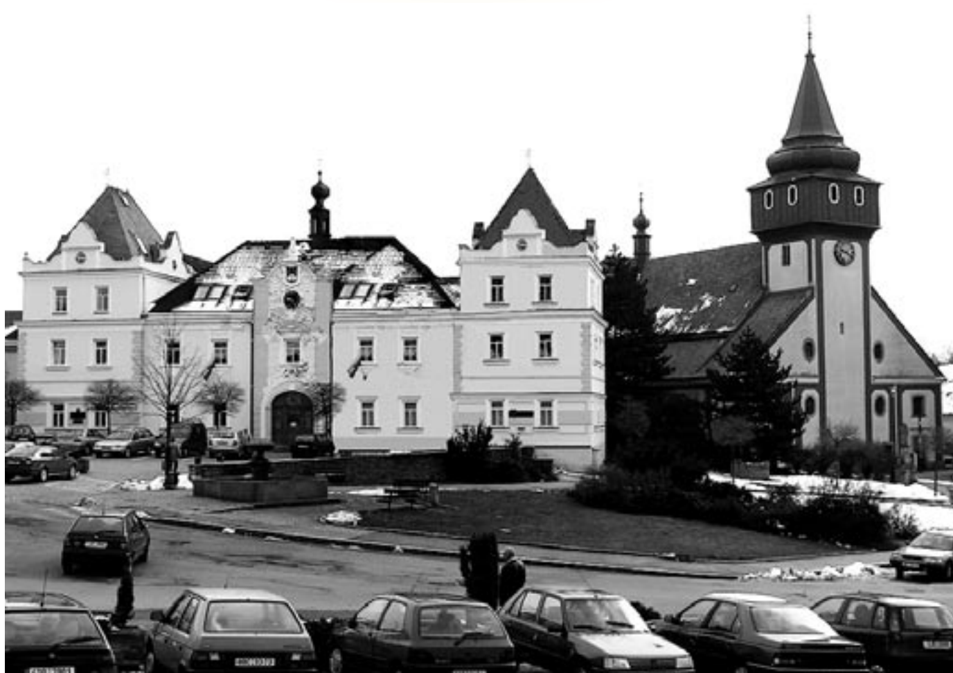
Náměstí Trčků z Lípě v blízké budoucnosti

měsíčník města • duben 2008 • cena 10 Kč