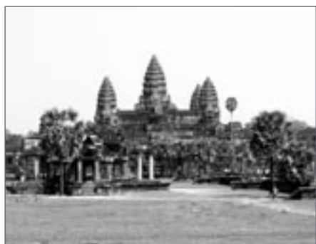
Komplex Angkor Wat

► jezdí čím dál více a právem patří mezi nejvýznamnější kulturně-historické památky v Asii. Jen musíme