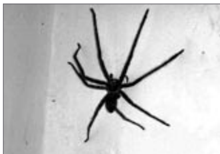
Za 4 USD je ve sprše i nádherný 15 cm velký pavouček

V roce 2007 bylo pomocí satelitních snímků a dalších technik zjištěno, že v preindustriální době se jednalo o největší město na světě. Samotné jádro města