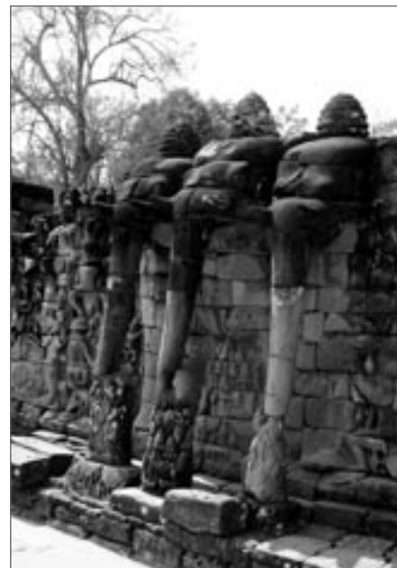
Elephant Gallery – detaily slonů na několik set metrů dlouhé terase chrámu Bayon

Bayon. Chrám často focený na různé prospekty, jeho čtyři brány orientované podle světových stran a jedna brána vítězná. Hlavy, které jsou typické pro