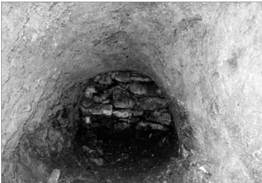
Tesaná úpadnice k jihu