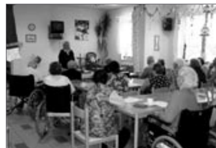
Univerzita slunečního věku

Druhá přednáška dalšího ročníku Univerzity slunečního věku probíhala v po-