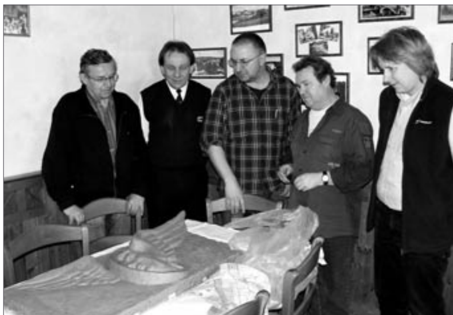
Členové komitétu nad modelem desky

vlastně obec Běleč nad Orlicí najdeme? Zavede nás do ní vedlejší silnice z Třebčovic pod Orebem do Hradce Králové, vedoucí po levém okraji Přírodního parku Orlice. A právě u Bělče je řeka Orlice kouzelná, plná říčních meandrů a slepých ramen s hojnou vegetací. Neodkly se jí totiž mnohdy nesmyslné regulace ani pozemkové úpravy. Však je to také ráj především cykloturistů, pro které bývá oblíbenou občerstvovnou hostinec U Hušků s vlastním minipivovarem.