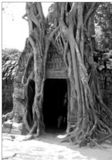
Symbióza vegetace a zdiva chrámu Ta Phrom

Vzhledem k rozsahu lokality se vyplatí následující postup. V případě větší skupinky usmlouvat mikrobusik, který nás doveze k jednotlivým památkám komplexu (délka základního okruhu je kolem 40 km – viz přehledovou mapku lokality). Jinou možností