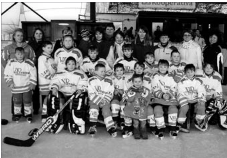
Vítězný tým HC Sklo Bohemia Světlá n. S. i s maminkami