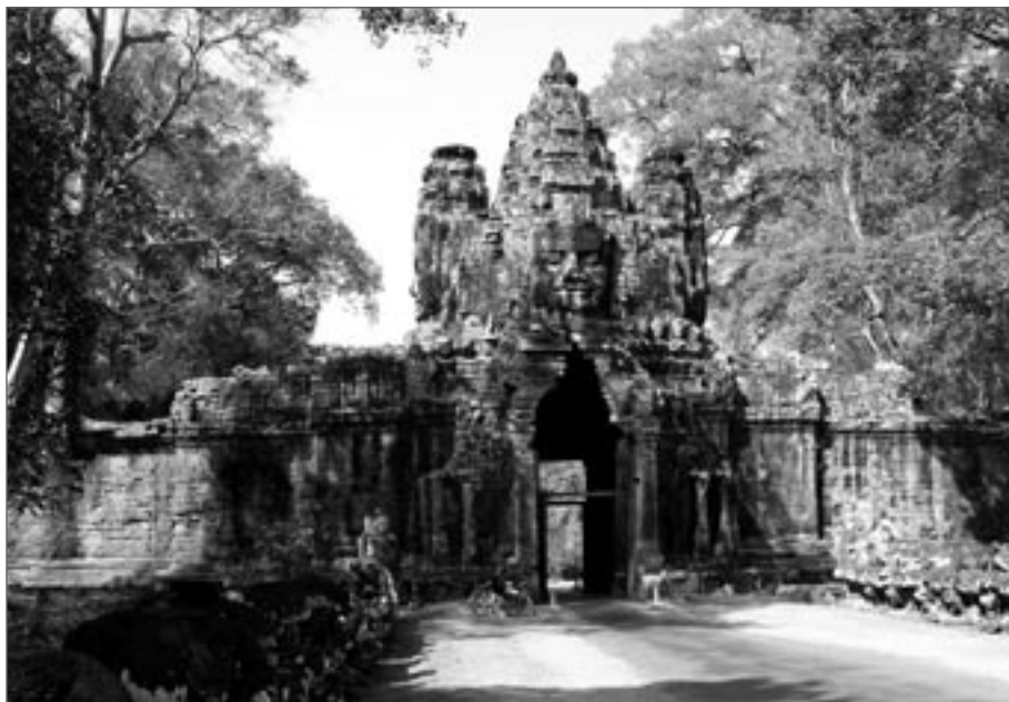
Victory Gate chrámu Bayon