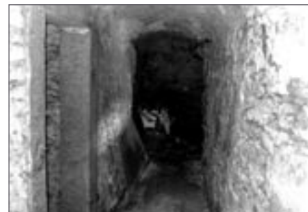
Pohled severní chodbou

Známým příkladem je v posledních letech zpřístupněné středověké podzemí města v oblasti východně od kostela sv. Václava. Je jasné, že tato unikátní středověká památka je jen částí dochovaného světelského podzemí. I když tato část naší historie nevyniká žádnými uměleckými skvosty, mají zdánlivě jednoduchá rukodělná technická díla mnohá kouzla a v sobě uloženu úžasnou