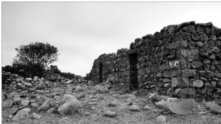
Na Golanských výšinách se nachází větší množství opuštěných samot i celých vesnic