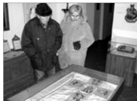
Ornát s vyobrazeným svatým Václavem z pol. 19. stol.

Mgr. Alena Křivská, Ing. Alena Křivská