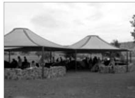
Jediný kemp v rezervaci Yehudia Forest

a také výhled na Galilejské jezero. Plochá část povrchu se využívá jako pastvina a místy jsou vidět zbytky starých kamenných domků původních vesnic.