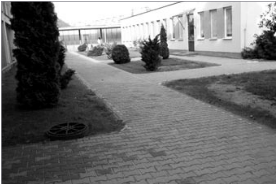
Chodník před mateřskou školkou

Nejvíce nás stále trápí stav komunikací, chodníků a parkovišť. V tomto roce se přistoupilo k vybudování parkoviště a k úpravě křižovatky na Malé Straně, kde vzniklo 23 parkovacích míst, 1 parkovací místo pro tělesně postižené a záliv