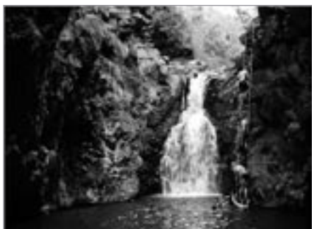
Některé žebříky končí překvapivě přímo na hladině studeného jezírka

► k vodě. Postupně všichni překonáváme tuto příjemně chladnou a osvěžující překážku, někteří se dokonce nechávají masírovat malým vodopádem. Místy je dno kaňonu porostlé houštinou bambusu, jinde je tvoří tráva a kameny.