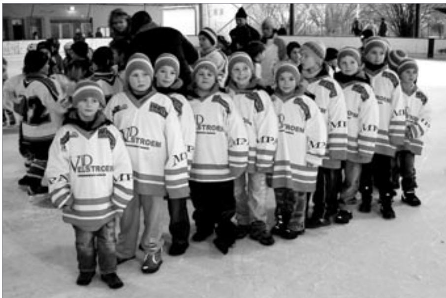
Vítězné družstvo turnaje příprava HC Sklo Bohemia Světlá n. S.