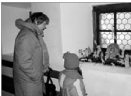
Zaslouženou pozornost budil vystavený betlém z kukuřičného šustí