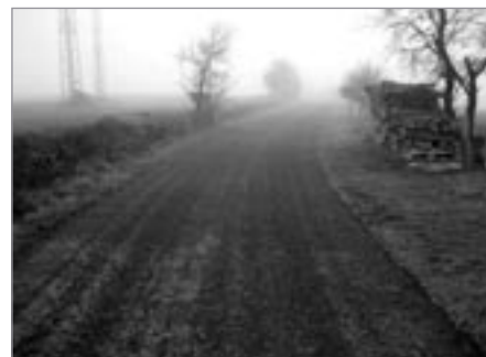
Cyklostezka v Lipniče

Stavební úpravy nebytových prostor na 7 b. j. v Josefodole čp. 24, Dětské dopravní hřiště III. etapa, Kanalizace Lipnička – oprava komunikací I. část.