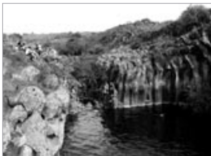
Izraelští turisté u Hexagonal Lakes