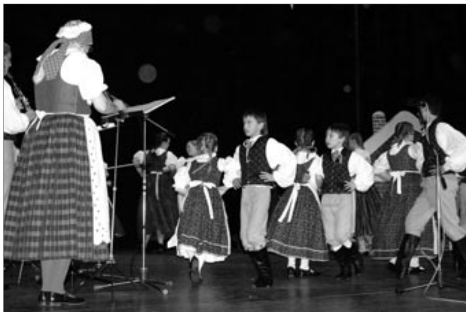
Malí tanečníci Škubánku