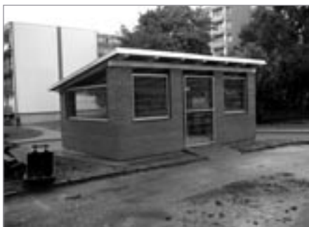
Přístřešek na popelnice

pro autobus. Za Komerční bankou a poliklinikou město na pronajatých pozemcích vybuďovalo odstavné parkovací plochy. Tím došlo k podstatnému zlepšení dostupnosti lékařské služby osobám, které mají sníženou pohyblivost. U bytového domu čp. 943-945 bylo realizováno rozšíření parkoviště s 9 parkovacími místy a 1 stáním pro invalidy. V Nádražní ulici byl opraven chodník a v Horní ulici vybudována nová kanalizace s celkovou rekonstrukcí chodníku a celé ulice. V lokalitě U Stromečku se po dlouholeté odmlce dokončuje komunikace v Panuškově ulici. Musela být zpracována nová projektová dokumentace, v ní se počítá,