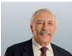
JUDr. Richard Falbr 68 let, poslanec Evropského parlamentu Praha