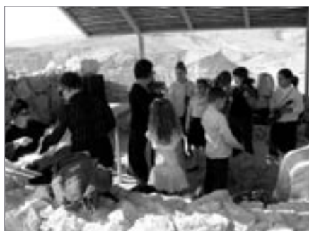
Školáci nacvičují vystoupení na Masadě