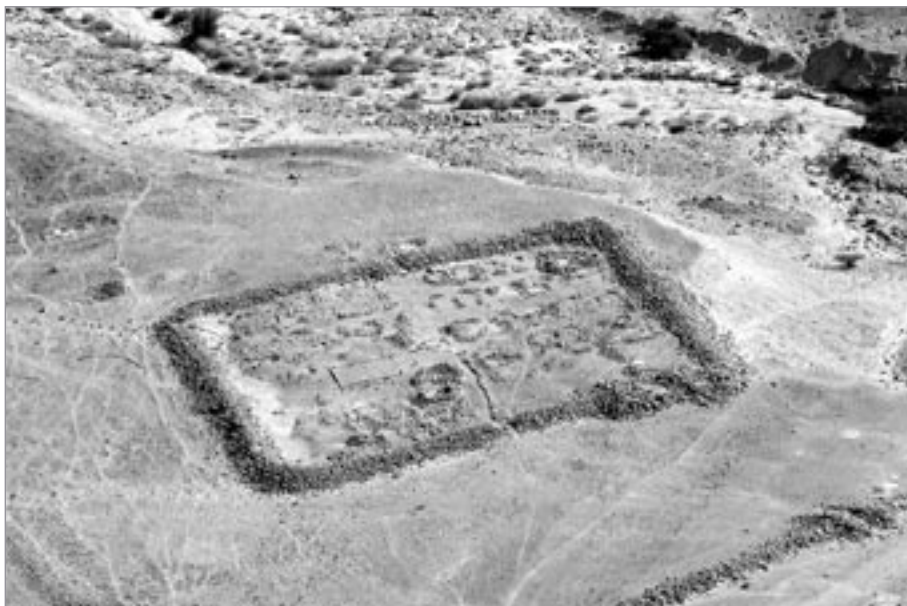
Toto byl tábor římských legionářů

Pokud tedy budete mít cestu do Izraele, lze doporučit jedině, návštěvu tohoto místa. Masadu vynechat nelze, to je jako být v Praze a nepodívat se na Karlův most.