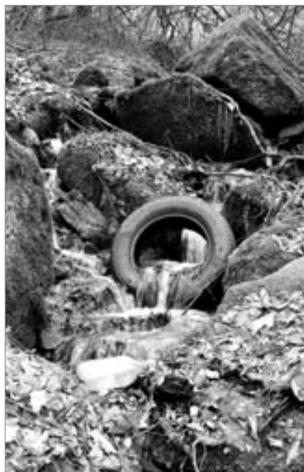
Z jarní vycházky do Dobrovítovy Lhoty

Z webových stránek Policie ČR zpracovala -hk-