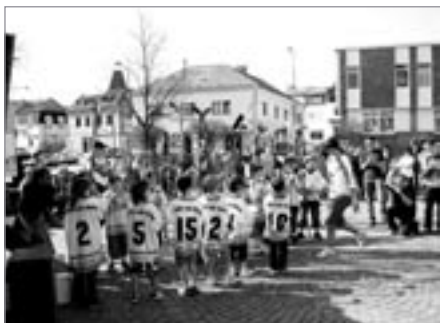
Malí hokejisté přípravky tvořili slavobránu hokejistům nastupujícím na tribunu