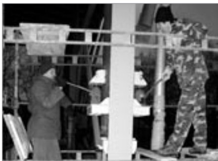
Tak se zvedala střecha