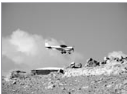
To není chvilku před nárazem, nýbrž vyhlídkový let kolem pevnosti

Samotná prohlídka rozhodně není záležitost na hodinu či dvě. Kdo si chce místo náležitě užít a prozkoumat,