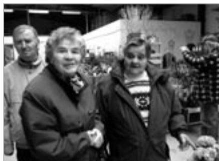
V Zahradnictví Starkl