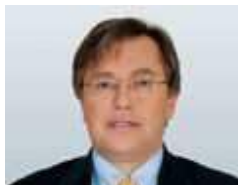
Dr. Libor Rouček 54 let, poslanec Evropského parlamentu Družec