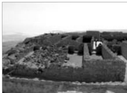
Ruiny budov a skladišť pevnosti

Roku 66, na počátku první židovské války proti Římanům, obsadila Masadu (v té době sídlila římská posádka) lstivá skupina židovských povstalců, kteří se nazývali zelóté (či sikarioni).