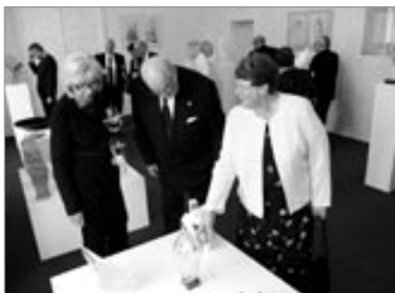
Dánští hosté při prohlídce

V dubnovém čísle Zpravodaje jsme publikovali předběžný program našeho Majálesu 2009, který proběhne ve čtvrtek 7. května. Za poslední měsíc došlo k několika drobným technickým změnám, na které chceme návštěvníky upozornit.