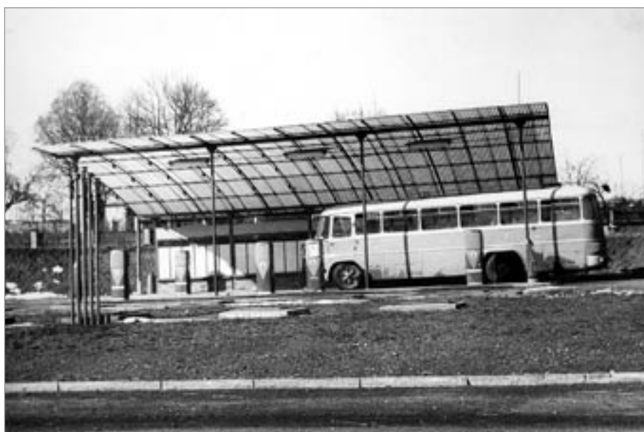
Benzinová čerpací stanice v roce 1963...

dne 23. prosince, byla zdejším stavebním úřadem provedena kolaudace, do 31. 5. 2003 probíhal zkušební provoz a od 1. 6. 2003 byla stavba uvedena do trvalého provozu. Čerpací stanici vlastní firma Čepro, a. s., provozuje ji společnost EUROOIL.