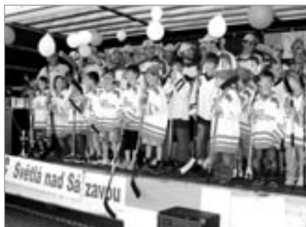
Skvělá atmosféra na náměstí při setkání hokejistů s veřejností. Přispěli k tomu i nejmenší hokejisté HC Sklo Bohemia.

pod vedením trenéra Schlaicherta vybojovali postup do naší třetí nejvyšší soutěže! Hokejisté se chtěli o radost z dosaženého úspěchu podělit také se svými příznivci, kteří je po celou sezonu povzbuzovali, proto v pátek 10. dubna uspořádali veřejnou oslavu před radnicí na náměstí Trčků z Lípy. Na improvizované tribuně se veřej-