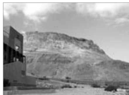
Pohled od lanovky na útes s pevností