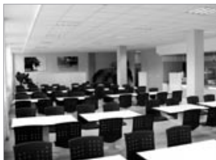
Nové prostory rekonstruované jídelny