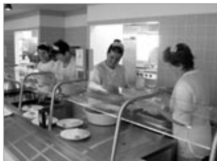
Pult pro vydávání stravy