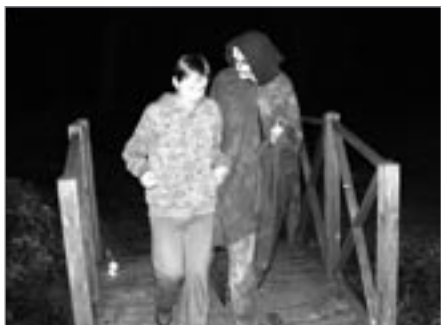
S převozníkem Cháronem

Během 14 dnů hrály děti dvě celotáborové hry. Tou první byla Neptun a piráti, kdy děti po celých 14 dnů plnily Neptunovy zkoušky, aby jejich pirátské duše