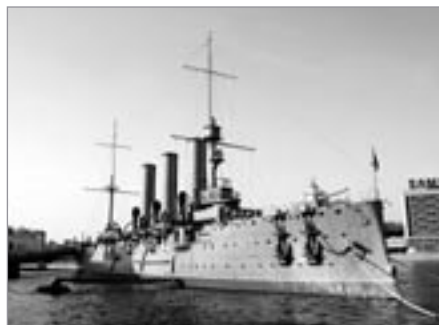
Petrohrad, křižník Aurora

V průvodci z roku 2004 jsme si našli pro nás cenově dostupný hotel Družba. K našemu zděšení zjišťujeme, že celý hotel prošel rekonstrukcí, byl přejmenován na Andersen a momentálně nabízí své služby spíše movitějším cizincům. I přes