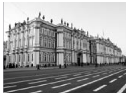
Petrohrad, Zimní palác

krásné řece Něvě opět otevřeno zahranickým návštěvníkům a představuje se v novém lesku, jako by chtělo dohonit roky strádání. Více než v kterémkoliv jiném evropském městě, dokonce i více než v Benátkách, s nimiž je znovu a znovu srovnáván, tu máte mít dojem, že se procházíte skanzenem architektury. Přemísťujeme se většinou metrem. Jeden žeton stojí 20 RUB (12 Kč). Petrohradské metro otevřené v roce 1955 je díky stanicím vytvořených umělci nejen pamětihodností, nýbrž i technickým skvostem. Protože město bylo vybudováno v bažinaté oblasti,