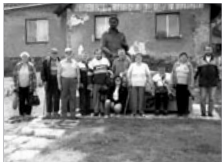
Z výletu na Lipnici

Ve středu 24. června jsme velmi rádi přijali pozvání mateřské školky Bambino na tradiční Zahradní slavnost. I když počasí dětem nepřálo a celá slavnost se konala v Rytířském sále místního zám-