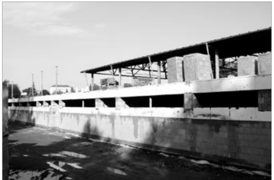
Pohled od řeky na budoucí zázemí pro hokejisty