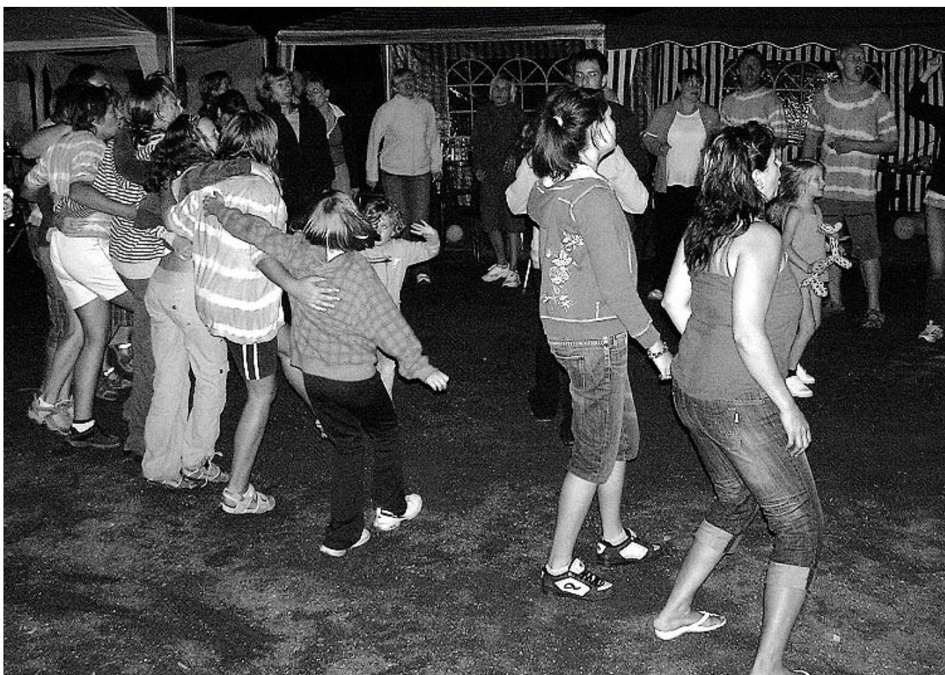
Konec prázdnin v Mrzkovicích