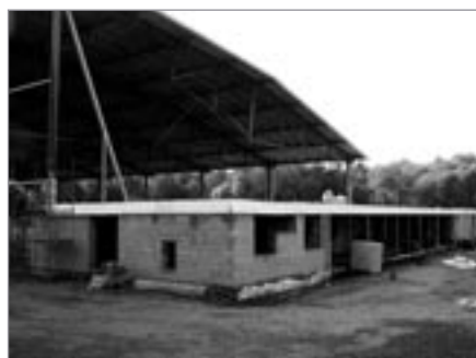
Vstupní část zimního stadionu