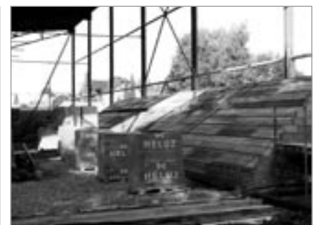
Takto se rodí tribuna pro 520 diváků