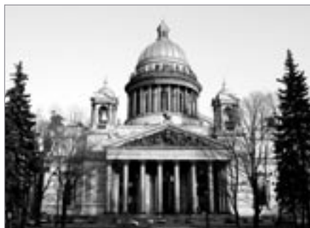
Petrohrad, chrám sv. Izáka

lodí. Nasedáme a dopřáváme si téměř hodinovou plavbu po petrohradských řekách a kanálech.