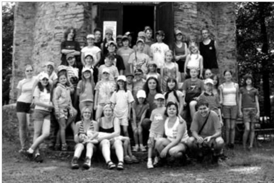
U rozhledny na Jedlové