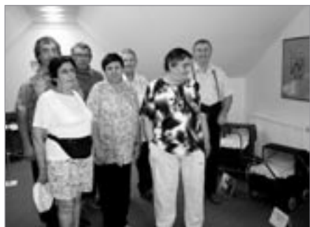
Na výstavě kočárků

ku, z cirkusového vystoupení dětí jsme byli nadšeni a i v tom nelibém počasí nám několikrát vykouzlily úsměv na tváři.