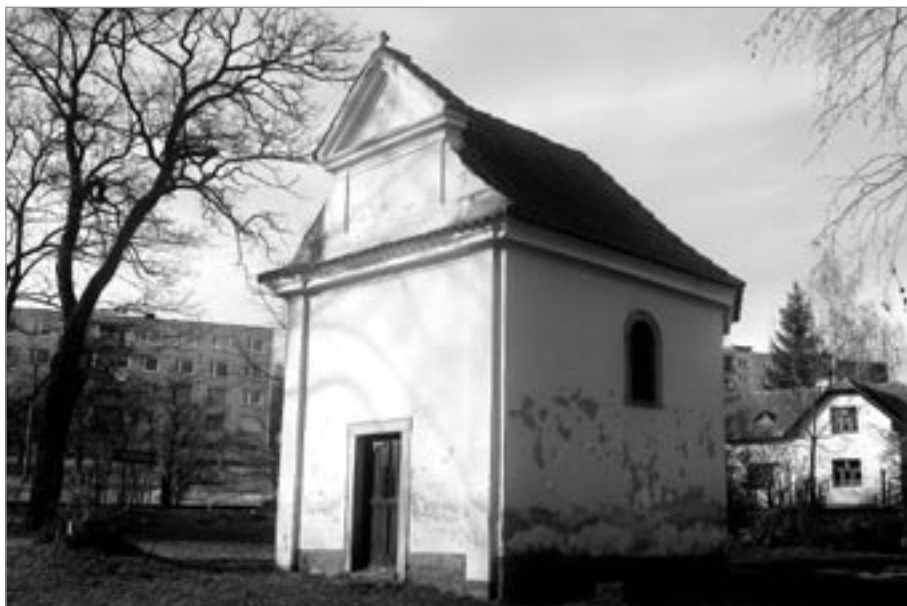
Kaple sv. Jana Nepomuckého

Možným důvodem zrušení hřbitova u kostela sv. Václava byla buď jeho nedostatečná kapacita, nebo zákon vydaný císařem Josefem II., který nařizoval přesunutí většiny hřbitovů mimo město z důvodů hygienických. Další zmínka je z roku 1840, kde se píše o dvou mších ročně, sloužených o svátku sv. Jana a v neděli po svátku sv. Bartoloměje. K roku 1840 měla Světlá 1843 obyvatel. ▶