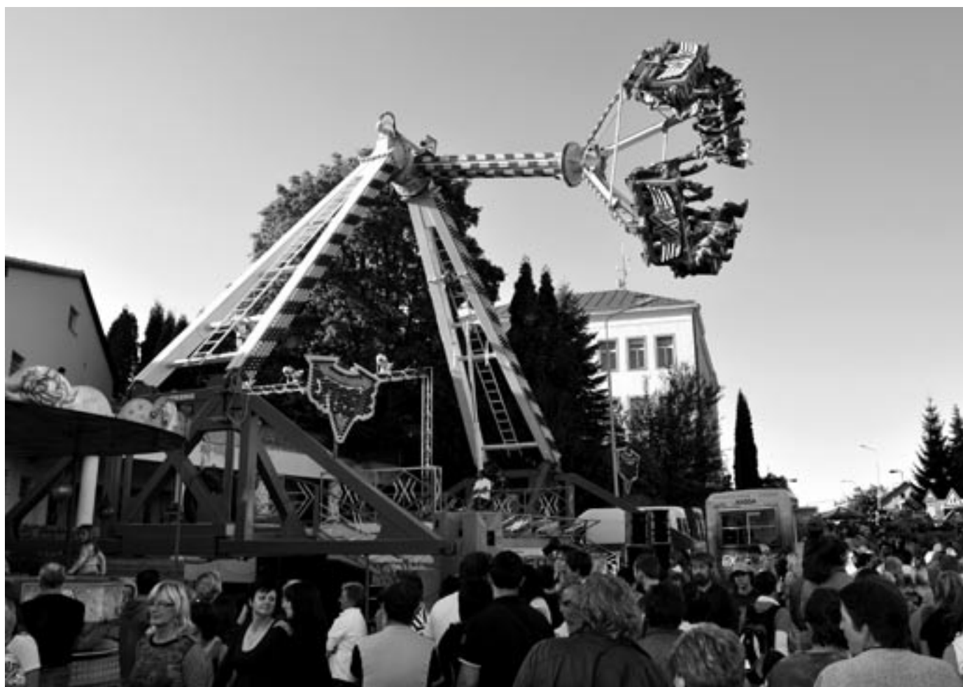
Pouťová atrakce

měsíčník města • říjen 2009 • cena 10 Kč