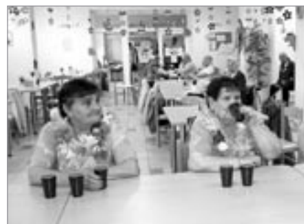
Ochutnávka soutěžních nápojů

po havajsku. Havajský den zahájili studenti hotelové školy z Havlíčkova Brodu barmanskou show a po ní začaly soutěže. Senioři soutěžili v jednoduchých disciplínách,