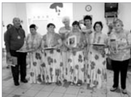
Naše dvě družstva na 2. místě

Ve čtvrtek 3. září se za hudebního doprovodu skupiny KAJAK konala další Kavárnička, kde jsme tentokrát vyhlášovali vítěze v kuželkách a šípkách.