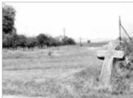
Kamenný kříž v 60. letech min. století...