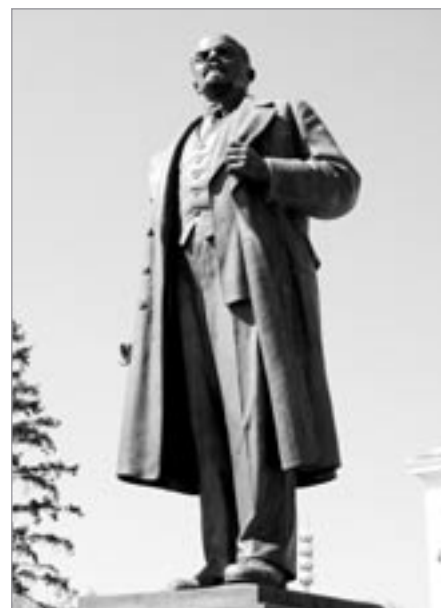
Socha V. I. Lenina

Rudé náměstí (Krasnaja ploščad') je nejvýznamnějším náměstím v Moskvě. Dříve sloužilo Moskvanům jako tržiště, dnes se zde konají vojenské přehlídky a manifestace. Prostranství o rozloze 60 tisíc m 2 ohraničují z jedné strany červe-