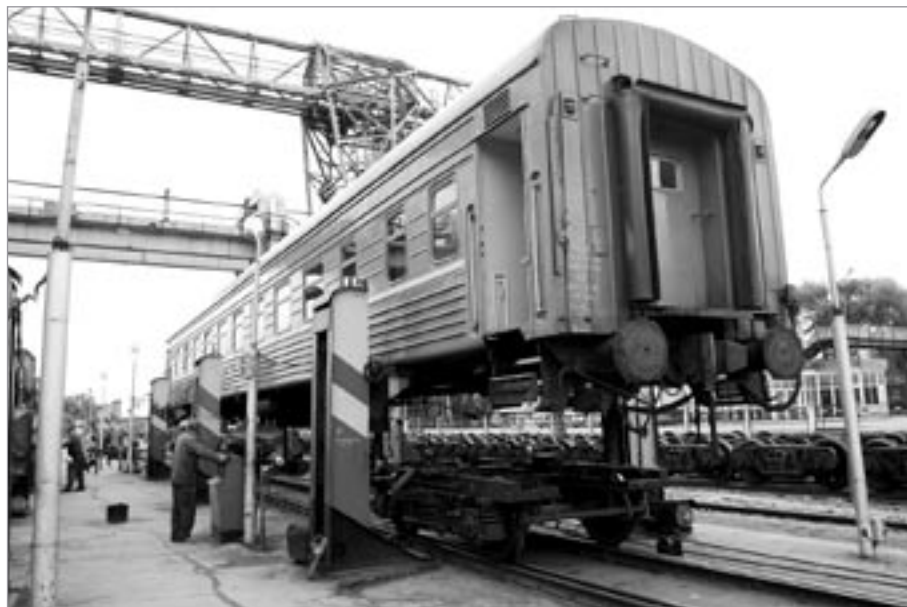
Ungheni – výměna podvozku

Naší další zastávkou je největší ruský chrám Krista Spasitele, který nás již z dálky oslňuje třpytem svých zlatých kopulí. Byl vystaven na místě původního chrámu v polovině 90. let 20. století. Je postaven na stejném půdorysu jako originál, jež nechal Stalin v roce 1931 zbořit, aby uvolnil místo pro nikdy nedostavěný Palác sovětů.