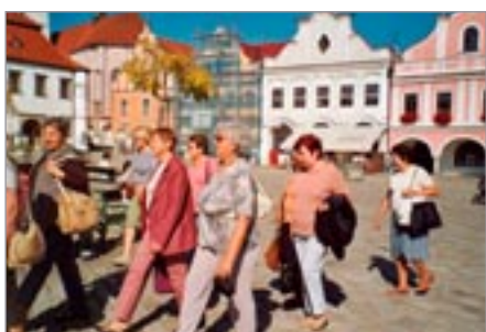
Na náměstí v Pelhřimově

Nejdříve jsme jeli navštívit Pelhřimov – město kuriozit. Sluníčko krásně hrálo a prohlídka stála za to. Další zastávka byla na Křemešník, kde jsme si prohlédli poutní kostel. Je to velice zajímavá stavba,