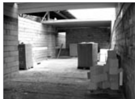
Budoucí herna pro stolní tenis