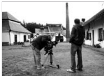
Huť Jakub před televizní kamerou