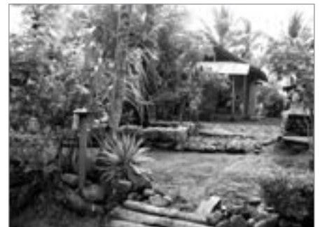
Vesnička v pralesi

rytem řeky, kde se nemusíme složitě proplétat mezi hustou vegetací. A voda není studená, v botách příjemně čvachtá a osvěžuje. Pomalu se otvírají výhledy na kopce pokryté pralesem a to stojí opravdu za to. Před námi vidíme vesničky obklopené rýžovíšti, žádné turistické komplexy, prostě paráda.