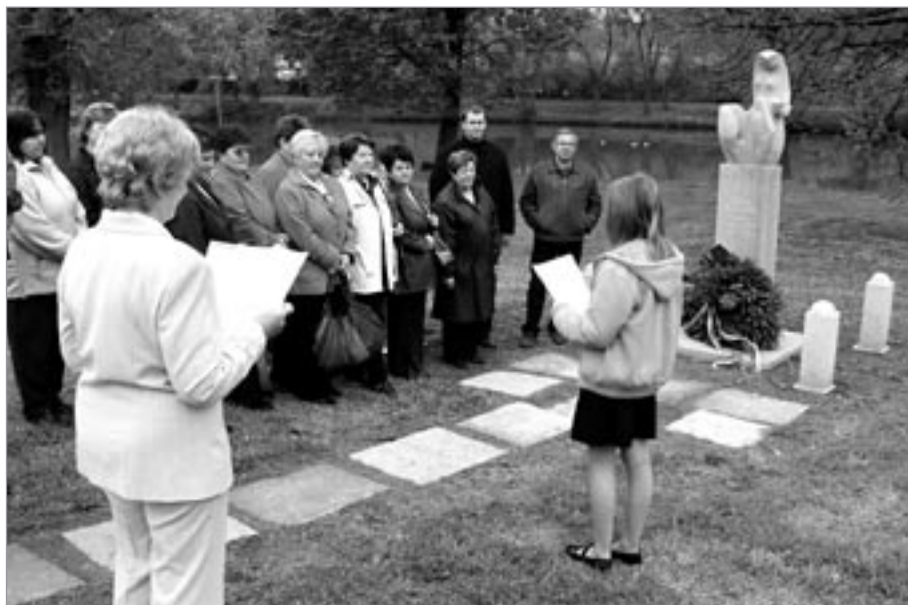
Pietní akt 8. května u památníku na levém břehu Sázavy

Mezi další aktivity patří rekonstrukce náměstí, dokončení komunikace u Stromečku, veřejných prostranství sídlišť a sportovišť, rekonstrukce zázemí fotbalového stadionu, ve městě chybí koupaliště, sportovní hala a řada dětských hřišť. Jednotlivé akce musí být pečlivě projekčně připraveny a při současných