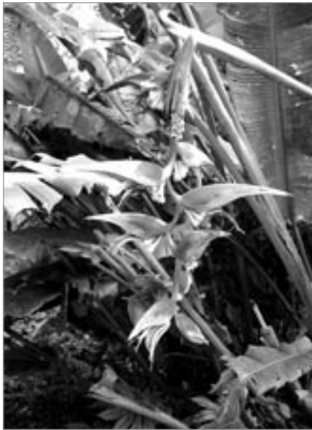
Květy orchidejí v botanické zahradě

Předposlední den našeho pobytu chceme vyrazit prozkoumat nefalšo-