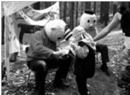
Šikulové Pat a Mat

například možnost se přímo zapojit do děje pohádky O veliké řepě, zacvičit si společně se Spejblem a Hurvínkem, zkusit si zatloukání hřebíků pod dohledem oblíbené dvojice Pat a Mat, u Červené karkulky si zkusily zašít břicho nenasytného vlka, v předpekli si s čerty zahrály kuželky. V lese nechyběl Shrek a pochopitelně ani vodníci, kteří již neodmyslitelně k Josefodolu patří.