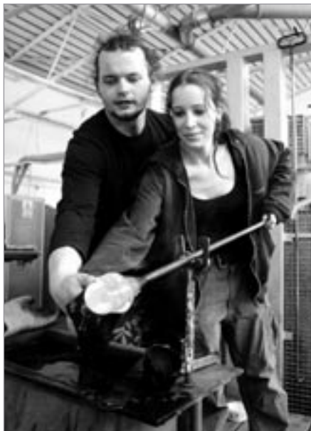
Studentka Wiener Kunstschule