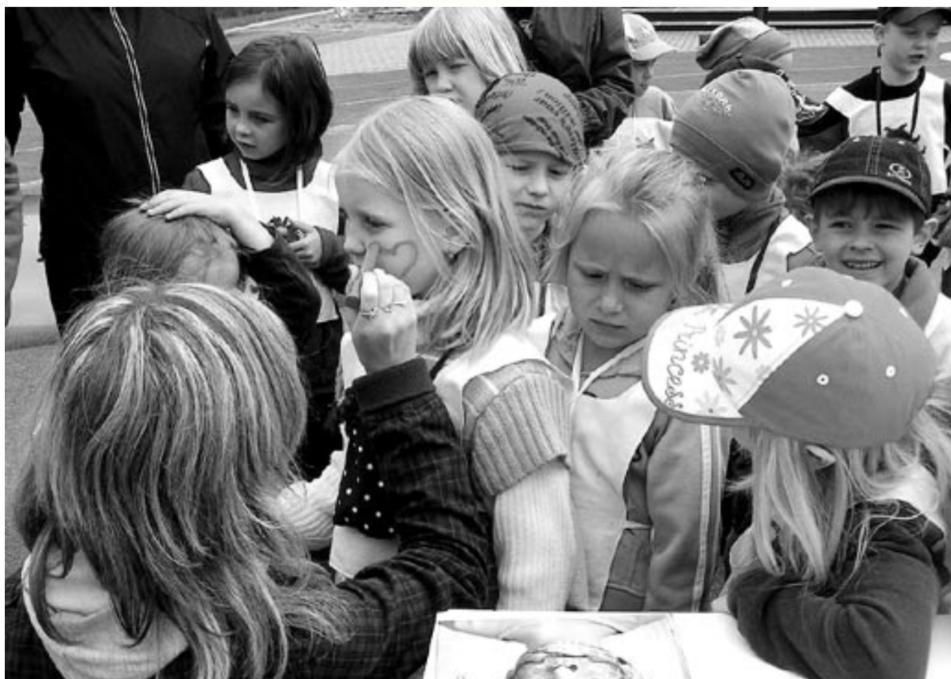
Den dětí

měsíčník města • červen 2010 • cena 10 Kč