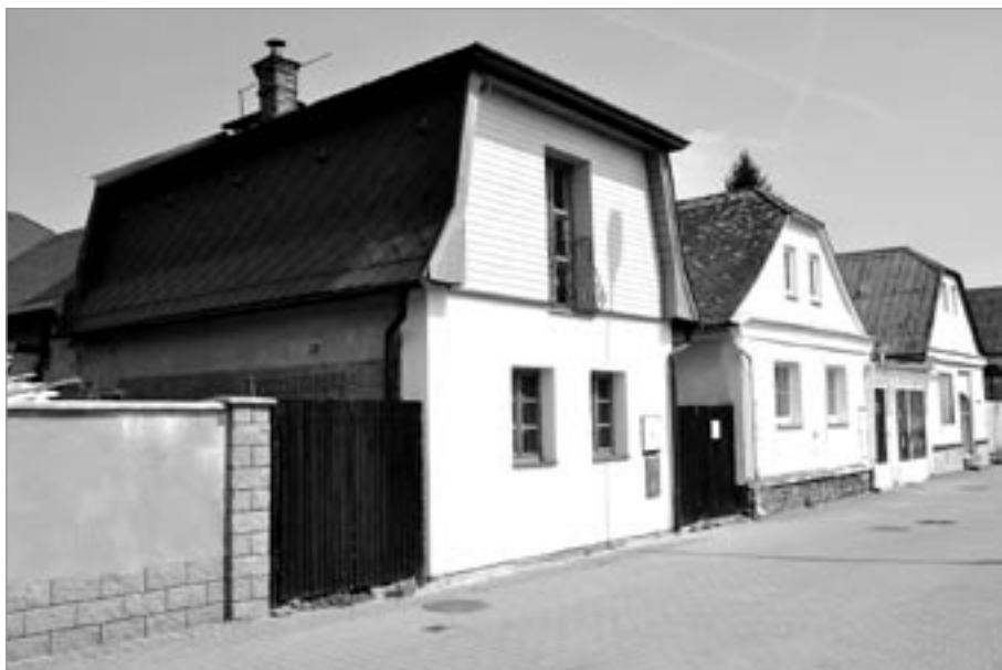
Dolní ulice, domy čp. 146, 189 a 190

Pacholíka, od níž jej v roce 2001 koupili současní majitelé. Celý domek zrekonstruovali (nové rozvody elektřiny a vody, plastová okna) a nový vstup vyřešili přístavbou spočívající v zastřešení prostoru mezi domkem a sousedním objektem. V roce 2005 došlo ke stavebním úpravám a změně užívání přístavby, v níž byla zřízena prodejna potravin s možností rychlého občerstvení se sortimentem pekařských a cukrářských výrobků