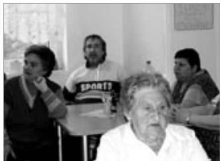
Z naší Kavárničky

Ve středu 5. května bylo u nás opravdu rušno. Dopoledne někteří naši klienti navštívili výstavu Světelských výtvarníků amatérů a zároveň se zúčastnili Dne zemědělce, který pořádala Česká zemědělská akademie Humpolec – pracoviště Světlá n. S. Odpoledne se v našem domově konala Kavárnička, hudebně nám