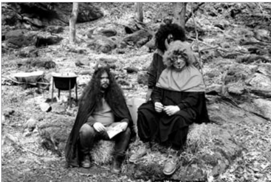
Čerti byli v Josefově mírumilovní

svůj stan populární Hitrádio Vysočina, na pódiu se střídaly hudební skupiny Vánek s Fernetem a zaujmout malé návštěvníky se snažili například hasiči ze Světlé, pracovníci Stanice ochrany fauny v Pavlově s dravými ptáky nebo divadélko Mrak z Havlíčkova Brodu. Na