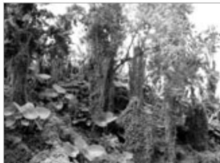
Hustá vegetace pralesa