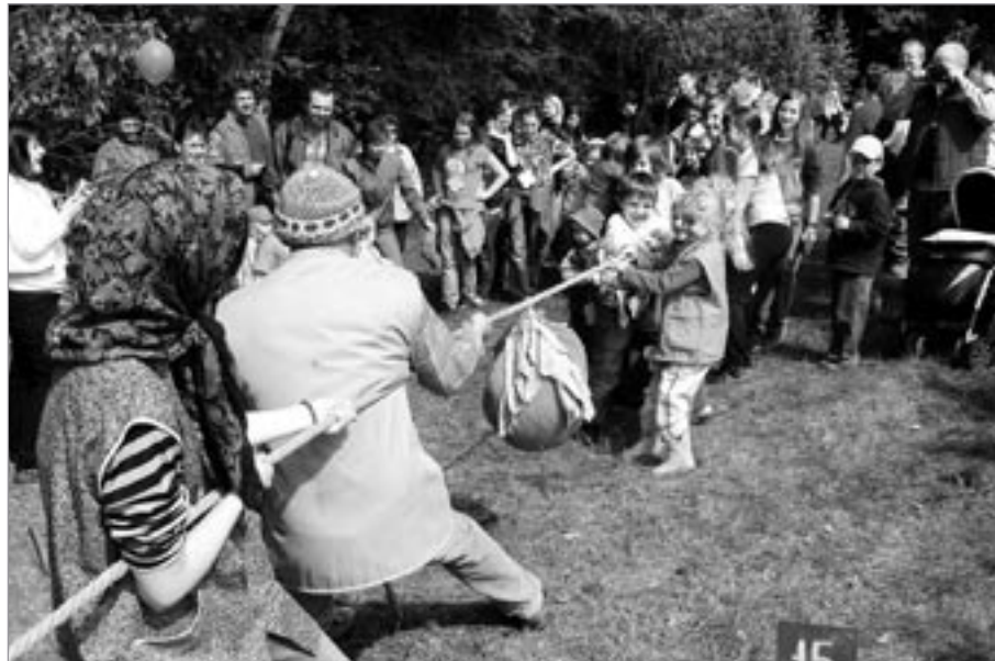
Tahal dědek řepu