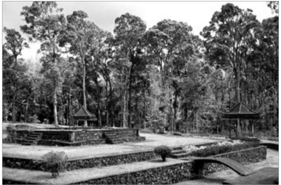
Botanická zahrada Bedugul

Stojím v lehkých kalhotách a tričku s krátkým rukávem s padákem na zádech a kloboukem na hlavě na benzínce u Humpolce. Všude kolem hromady mokrého sněhu, který se mi ze všech stran valí do sandálů. Čekám na kamaráda, který pro mě jede. Lidé se na mě koukají jako na blázna, všichni jsou navlečení v zimních bundách a čepicích. Já kromě věci na sobě už nic jiného čistého či suchého nemám.