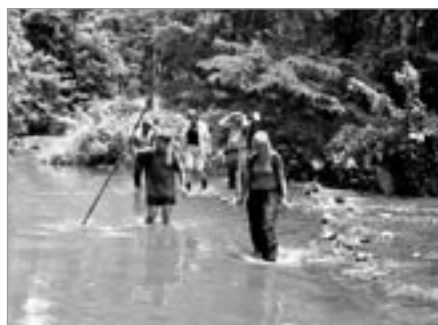
Brodění tropické řeky

teras na jižních svazích hor. Vzhledem k tomu, že krajina je nesmírně fotografická, zastavíme zde a zvěčňujeme