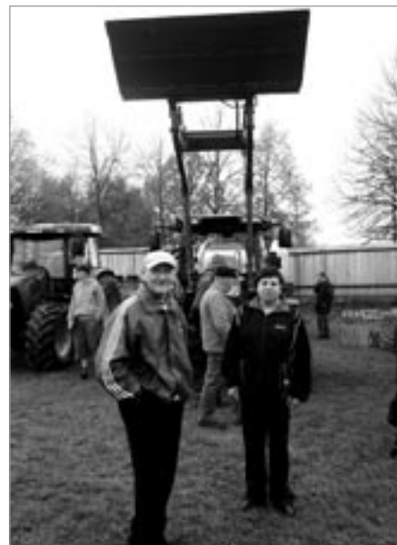
Na Dnu zemědělce

Text a foto: Lucie Coufalová sociální pracovnice