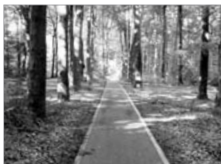
Takhle si představujeme cyklostezku

straší. Při projíždění Gimlinghausenem jsme se dostali k slavnostnímu průvodu ve vojenských historických uniformách. Je to velká sláva a paráda. Neustálé schovávání před deštěm nás obralo o čas, takže je pomalu namístě sehnat spaní. Nacházíme slušné místo v lesíku kousek od řeky. Ujeli jsme 85 km.