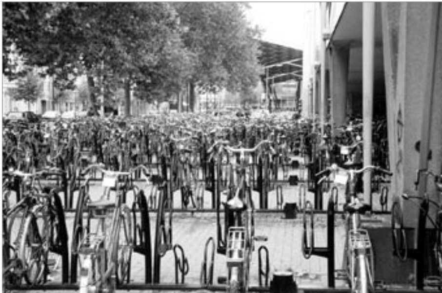
Parkoviště pro kola

Další zastávku máme ve Veghelu, jehož dominantou je kostel Sv. Lamberta. Po vy-motání se z města pokračujeme na Boxel. Tam doplňujeme vodu a jedeme pomalu