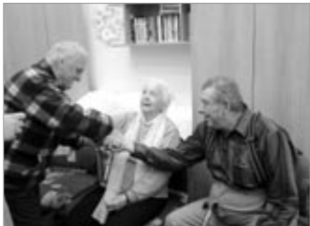
Při soutěži v DpS v Havlíčkově Brodě

V pondělí 8. listopadu jsme přijali pozvání na Den otevřených dveří do Domova pro seniory Reynkova v Hav-