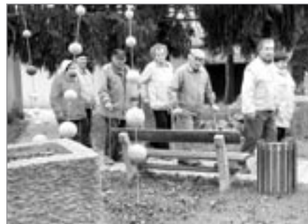
Na návštěvě v Uměleckoprůmyslové akademii

Ve čtvrtek 21. října jsme navštívili v Den otevřených dveří místní Uměleckoprůmyslovou akademii a obdivovali jsme šikovnost a zručnost tamních studentů.