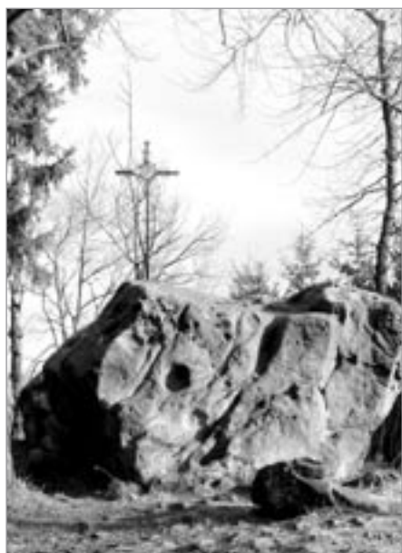
Na vrcholu Klášťova

► sových zájezdů, v jejichž programu byly návštěvy a prohlídky Luhačovic, Hostýna, zříceniny hradu Lujkov, Rožnova pod Radhoštěm a Radhoště, Chřibů s rozhlednou Brdo, archeoskan-