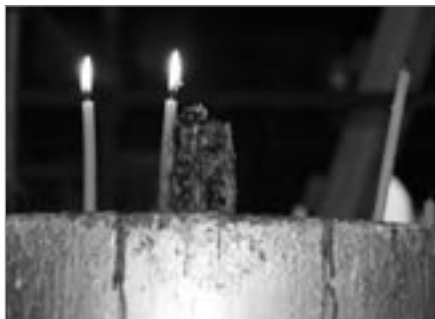
Betlémské světlo v chrámu Narození Páně v Betlémě

Evropě a stává se dalším ze symbolů vánočních svátků. Tehdy v jeskyni Ježíšova narození jedno vybrané dítě z Rakouska se zdravotním handicapem