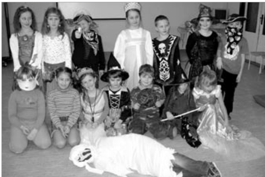
Ze školní družiny