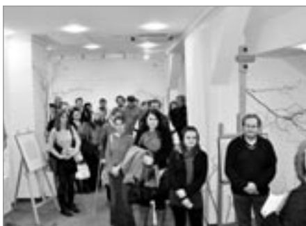
Z vernisáže výstavy