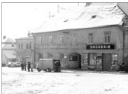
Pohled na dům čp. 89

nenastane újma hostinci mému, pokud se vjezdů týká. Doposud měl hostinec ten tři vjezdy a zrušením jednoho nebude cestující občanstvo nikterak zkráceno.”