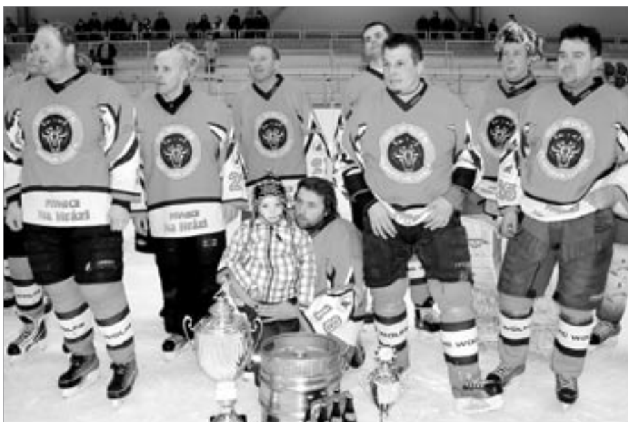
Vítězové z Hurtovy Lhoty s poháry a cenou pro vítěze, kterou byl soudek piva

Než se předaly poháry třem nejlepším týmům, bylo vyhlášení nejlepších hráčů soutěže. Střelcem I. ročníku Světelské hokejové ligy neregistrovaných se stal