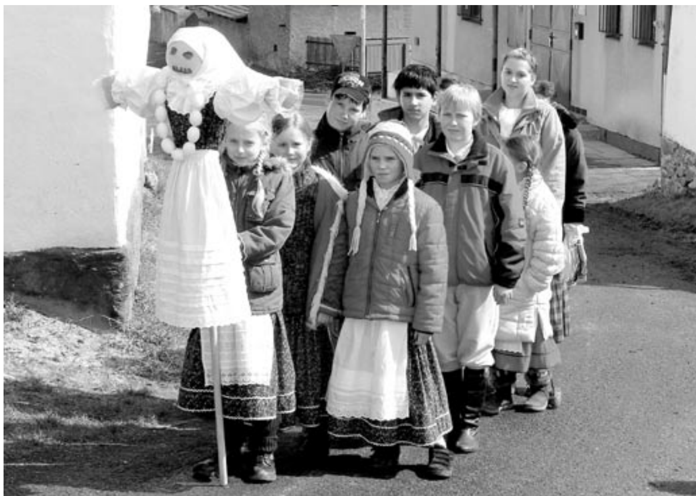
Velikonoce na Michalově statku v Pohledí

měsíčník města • duben 2011 • cena 10 Kč