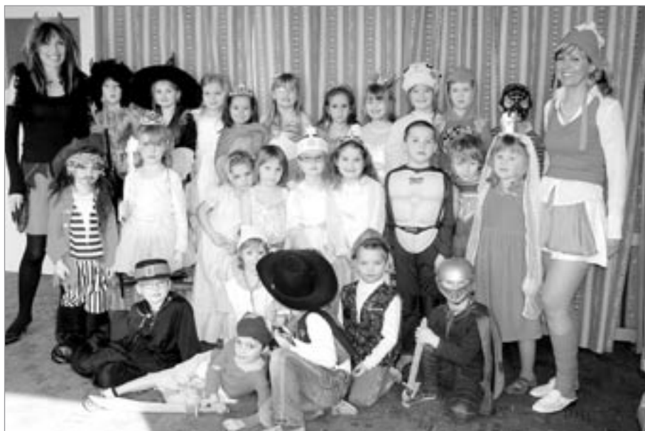
Z MŠ Na Sídlišti

Učitelé, žáci a jejich rodiče se již podruhé inspirovali lidovou tradicí a připravili pestrý průvod, ve kterém nechyběly tradiční postavy laufra s pa-