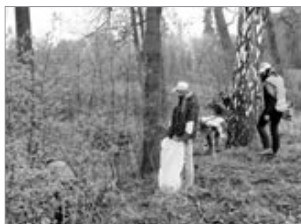
Žáci ZŠ Lánecká, úklid Sázavky

Již třetím rokem probíhal v dubnu v kraji Vysočina krajský projekt Čistá Vysočina zaměřený na úklid okolí silnic, veřejných prostranství, lesů, vodních toků atd. Město Světlá na Sázavou se