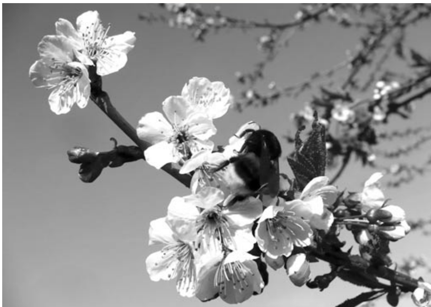
Květen v zahradě

měsíčník města • květen 2011 • cena 10 Kč