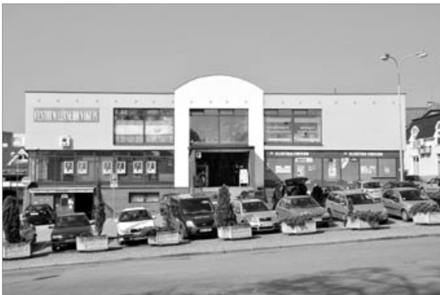
Budova čp. 995 na místě čp. 89 a čp. 181