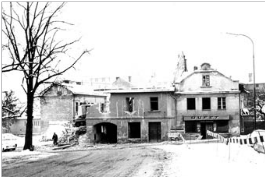
Dva snímky z demolic v 70. letech minulého století

vodné sítě na napětí 220 V/380 V. V této souvislosti podal dne 28. února 1962 Ferdinand Drahozal u stavebního úřadu ve Světlé n. S. žádost o státní příspěvek