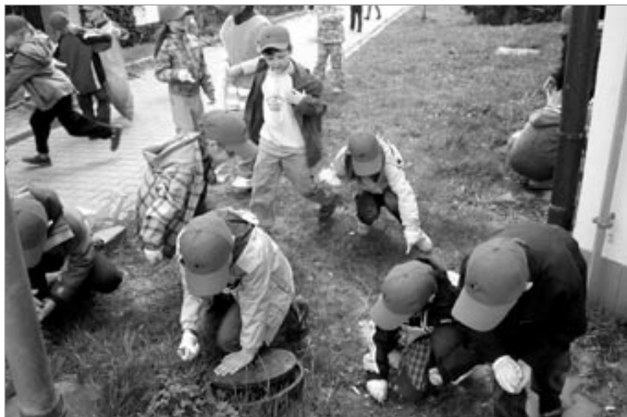
Úklid veřejných prostranství a břehu Sázavy žáky ZŠ Komenského

Poslední hodinu se na pracující studenty snášel vytrvalý déšť. Jakoby i sama příroda plakala nad bezohledností a hloupostí některých obyvatel tohoto kousku světa.