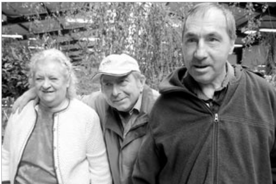
V zahradnictví Starkl

Letos poprvé se v našem městě uskutečnila akce Vítání jara. V rámci