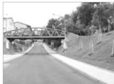
Nový most a Lánecká ulice v plném lesku

Město tak konečně získalo nový železniční most, který je svojí výraznou konstrukcí tou nejviditelnější změnou v Lánecké ulici. A co je důležité, pod mostem jsou po obou stranách vozovky dostatečně široké chodníky a zvýšila se