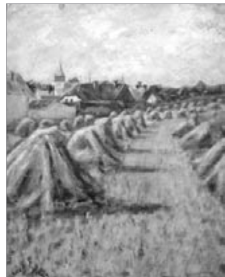
Pole nad Světlou, 50 x 40cm, olej/karton, 60. léta