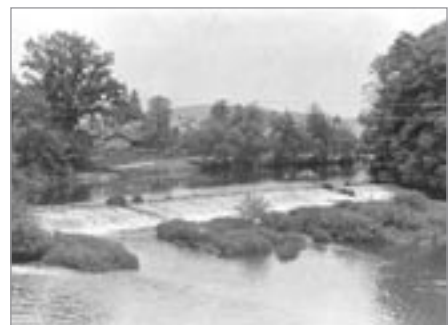
Splav a Pěšinky

ným vstupem do řeky. Rád vzpomínám i na chytání ryb, kdy jsem s dědou posedával na břehu, nejvíce na rohu Pěšinek a Šindelářovy zahrady, kde stával mohutný strom, dub nebo buk, to už nevím. Největší radost jsem ale měl, když si děda vypůjčil od pana řídícího Šindeláře pramici, na které jsme pak veslovali na její klidné vodě. I na splavu jsem byl, ale byl plný kamení.