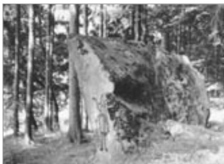
Čertův kámen ve Smrčné

Asi na hostinec u Volasů, kam jsem chodil s dědečkem. Koupil mi vždycky limonádu, kousek dál, jak si vybavuji, byl v řece brod, kde plavívali – nebo