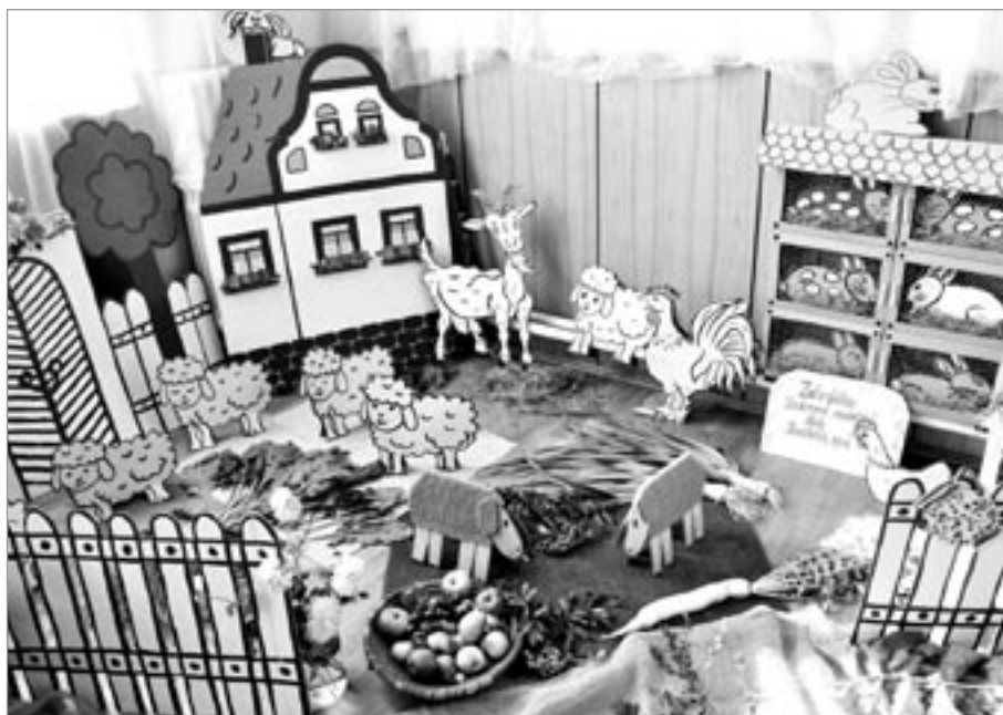
Soukromá mateřská škola Bambino připravila v rohu sálu celé malé hospodářství se slepicemi, králíky, kozou a ovečkami

Stavební bytové družstvo ve Světlé nad Sázavou se sídlem v ul. Dolní 419, 582 91 Světlá n. S.