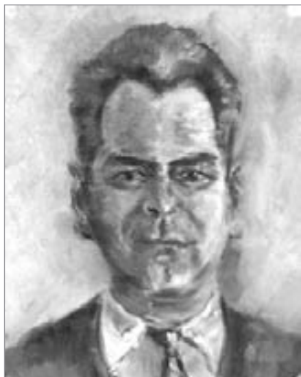
Autoportrét En-face II, 32 x 25cm, olej/plátno, 60. léta

Škarýdovy obrazy netrpí nectnostmi příznačnými pro amatérské malíře jako