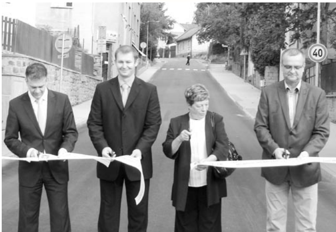
Slavnostního uvedení zrekonstruovaného viaduktu a Lánecké ulice do provozu se zúčastnil ministr financí Miroslav Kalousek.

měsíčník města • říjen 2011 • cena 10 Kč