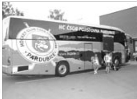
Družstvo mladších žáků Pardubic přivezl do Pěšinek klubový autobus pětinasobného mistra extraligy dospělých HC ČSOB Pojišťovna Pardubice

Přesně po roce, kdy byl v loňském roce slavnostně předán do užívání zrekonstruovaný zimní stadion v Pěšinkách, se na jeho ledě uskutečnil I. ročník hokejového turnaje mladších a starších žáků O pohár starosty města Světlá n. S. Dvoudenní klání