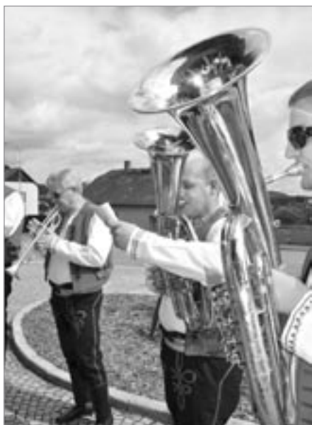
Propagační vystoupení Fryštácké Javořiny

kapely Božejáci z Pelhřimova a Fryštácká Javořina ze Zlína se svými sólisty. Průvodcem celého programu byl již potřetí pelhřimovský moderátor Petr Chládek.