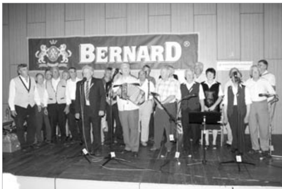
Účinkující při společné úvodní písničce