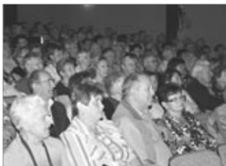
Diváci v hledišti

Necelým třem stovkám diváků a posluchačů se tentokrát představily dechové