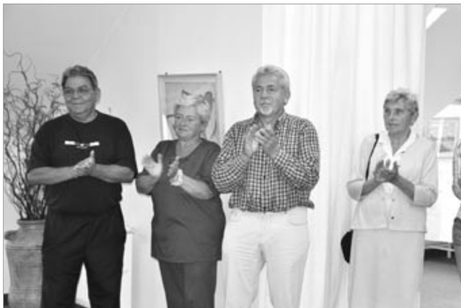
Mezi hosty vernisáže byla také malířova dcera (druhá zleva)