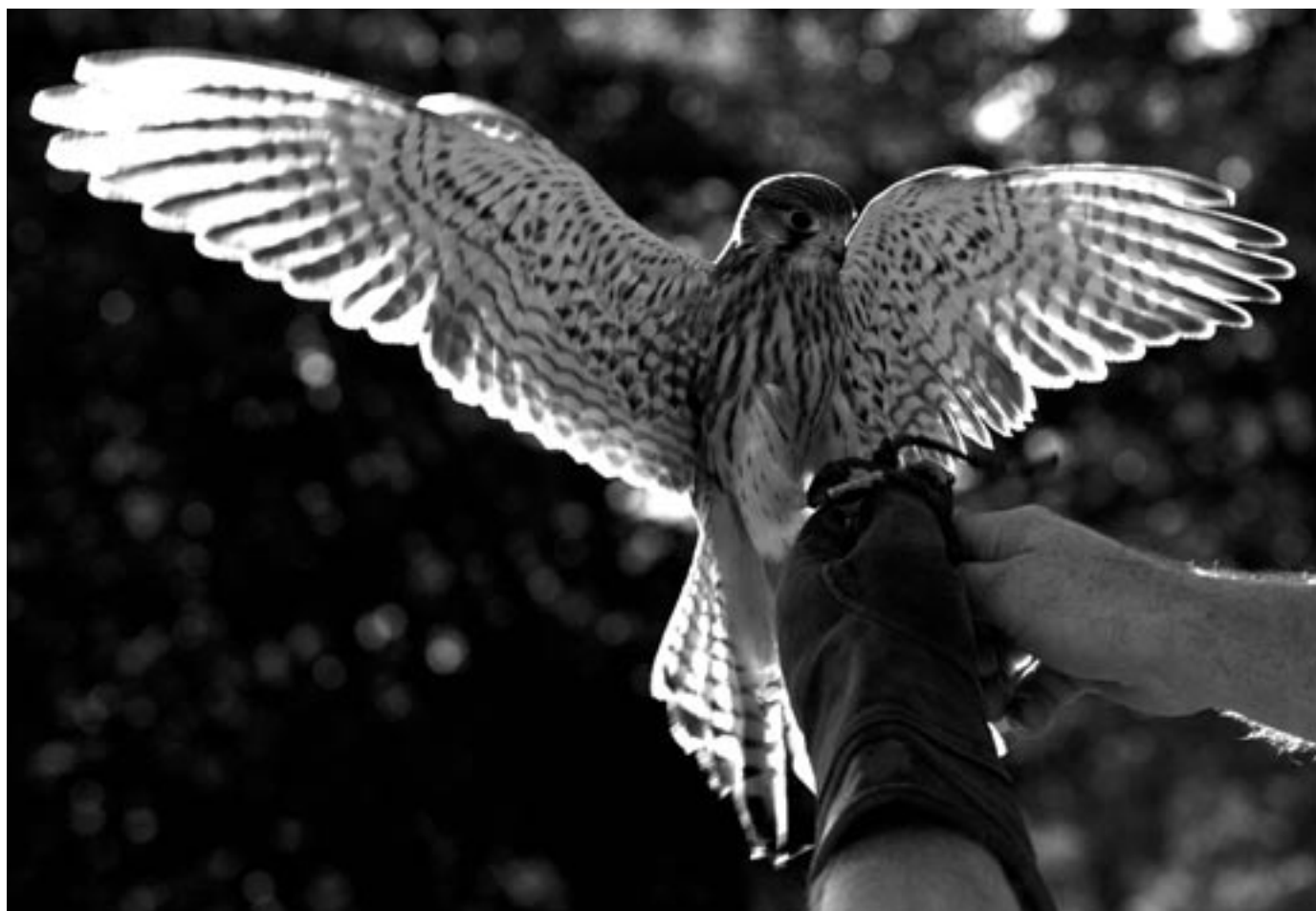
Ze Stanice ochrany fauny v Pavlově

měsíčník města • listopad 2011 • cena 10 Kč