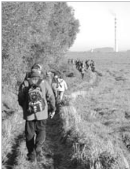
Kolem rybníků do Světlé

Seminář se konal v rekreačním zařízení Ředkovce, uprostřed přírody, která přímo vybízela, aby se v programu kromě přednášek a výměny zkušeností objevily dvě pěší vycházky. Ta sobotní v délce 21 km