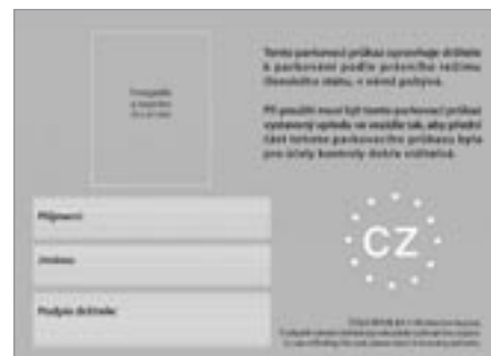
Vyobrazení zadní strany