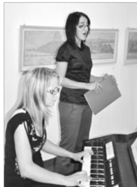
Z kulturního vystoupení

ry a stylovými podobami a jsou jenom zlomkem jeho rozsáhlé a hodnotné malířské činnosti. Ta čítá na 300 obrazů tvořících v celku zajímavé a cenné malířské dílo, ve kterém nemalé množství prací vychází z jeho vztahu ke Světlé. Vystavené obrazy pocházejí z 60., 70.