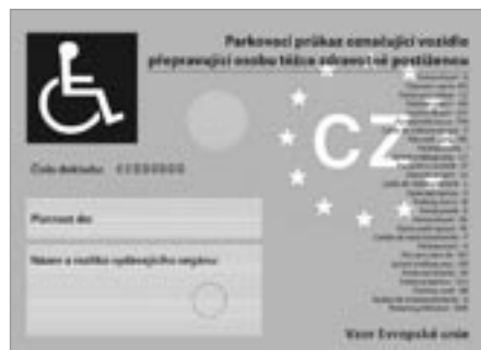
Vyobrazení přední strany

K vydání nebo výměně je nutné předložit fotografii o rozměrech 35 x 45 mm, průkaz ZTP, ZTP/P (případně i rozhodnutí o přiznání mimořádných výhod, pokud bylo vydáno jiným úřadem) a platný občanský průkaz.