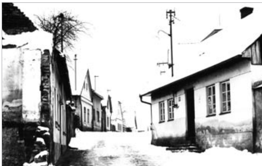
Ulice Nové město, vlevo domy čp. 192, 86, 85, 84 a 83, vpravo čp. 162