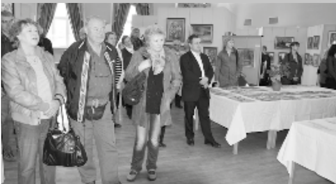
Hojná byla účast návštěvníků při slavnostním zahájení výstavy