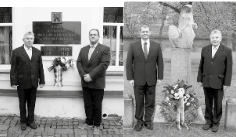
Položením věnce nebo květin u pamětní desky na budově radnice, u památníku na levém břehu Sázavy, v Dolní Březince a v Mrzkovicích uctilo vedení radnice oběti obou světových válek.