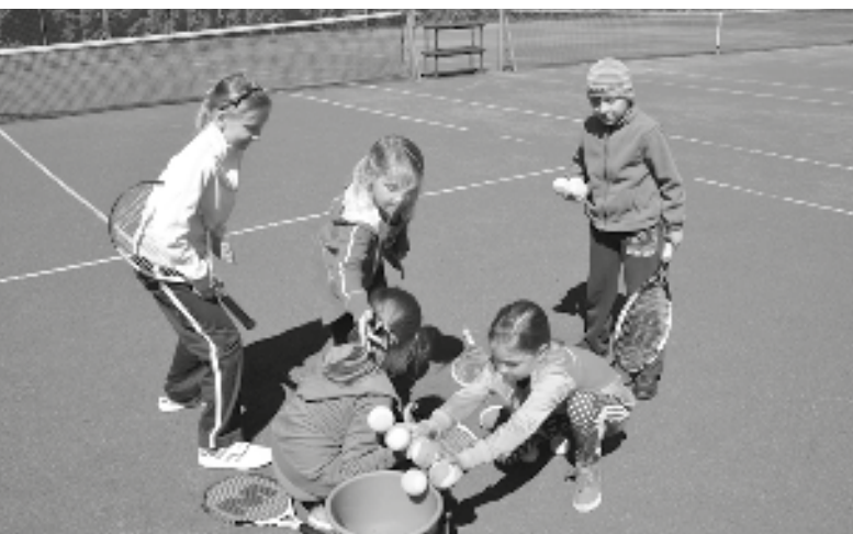
Děti z tenisového kroužku se učí hrou základům této hry