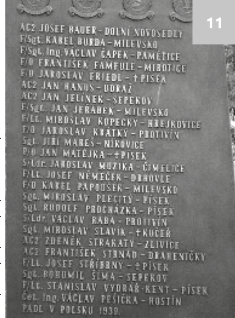
Jméno Stanislava Vydráře najdeme na památníku letců Písecka