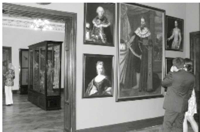
Vzácné barokní obrazy zapůjčilo Muzeum Vysočiny Třebíč