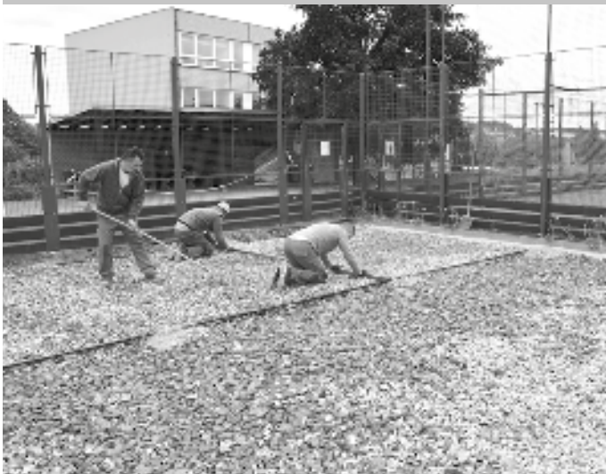
Nové šterkové lože dostává hřiště pro volejbal