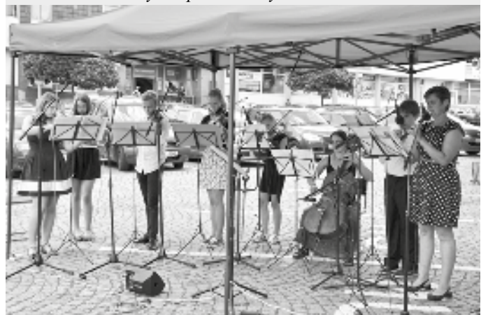
Komorní soubor - smyčcový