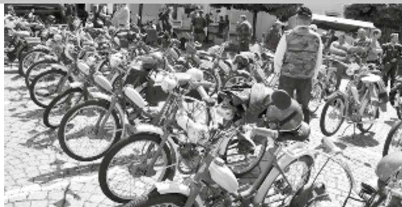
Dopoledne před startem se náměstí proměnilo na přehlídku historických mopedů, u některých byl rok narození 1957

V sobotu 10. června dopoledne obsadily prostor před radnicí na náměstí Trčků z Lípy historické mopedy. Světelský Stadion klub S11 připravil na ten den již 11. ročník Propagační jízdy Vysočinou. Do Světlé nad Sázavou se sjeli majitelé „kozích dechů“ z celé republiky, ale nejdelší cestu urazila dvojice Bulharů na motocyklu IZH 350/DKV z roku 1969. Jejich cesta do Světlé měřila něco přes 800 km. Do startu se pořadatelům prezentovalo 97 účastníků jízdy, marně čekali na tři další, aby se počet startujících zaokrouhlil na magickou stovku. I tak byl počet startujících do I. etapy vysoký. Zahajovací etapa měřila 35 km a vedla přes Bohušice, Druhanov, Ovesnou Lhotu, Vlkanov, Ledec n. S., Vilémovice, Leštinku, Mrzkovice a Závidkovice zpět na světelské náměstí. Po krátké pauze na odpočinek a klobásu se konvoj, ve kterém měly převahu historické mopedy Stadion S11, vydal do druhé etapy, která byla o 10 km delší. Jelo se ze Světlé přes Novou Ves, Okrouhlici, Chlístov, Havlíčkův Brod, Veselý Žďár, opět přes Okrouhlici, dále Broumovu Lhotu a Závidkovice zpět do Světlé. Pořadatele potěšilo, že se jelo opět bez nehody, až na pár drobných závad, které si účastníci jízdy dokázali opravit, a co víc, dešť se celé akci opět vyhnul. Jedenáctá Propagační jízda Vysočinou tak splnila své poslání, sešli se mopedáři z různých klubů i ti neorganizovaní, vyměnili si rady, jak pečovat o své miláčky, a navíc poznali krásy naší Vysočiny.