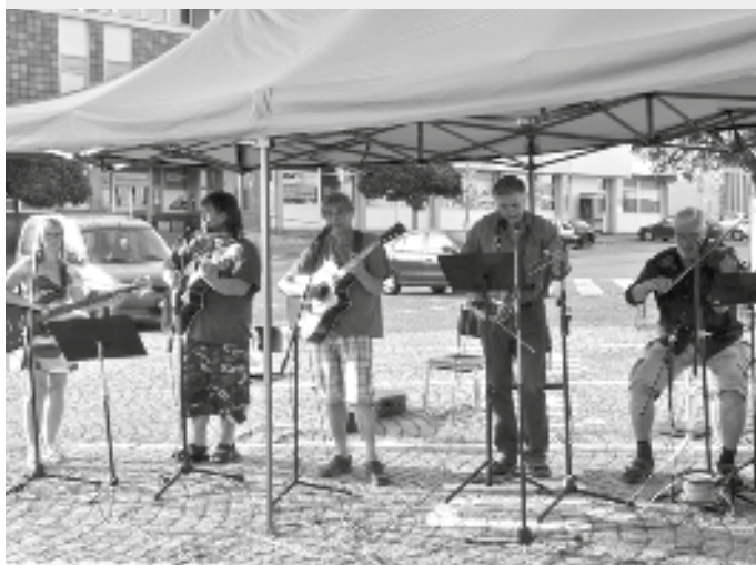
Program na náměstí již tradičně zakončila skupina Fernet