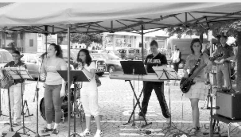
Celý program odstartovalo vystoupení věžeňské kapely Katr-band