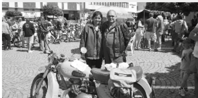
Na start 11. ročníku Propagační jízdy Vysočinou to měla nejdále dvojice Bulharů s osmačtyřicet let starým motocyklem