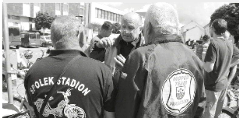
Mezi zaparkovanými mopedy se tvořily skupinky mopedistů, kteří si vášnivě předávali rady na téma údržba a provoz mopedu