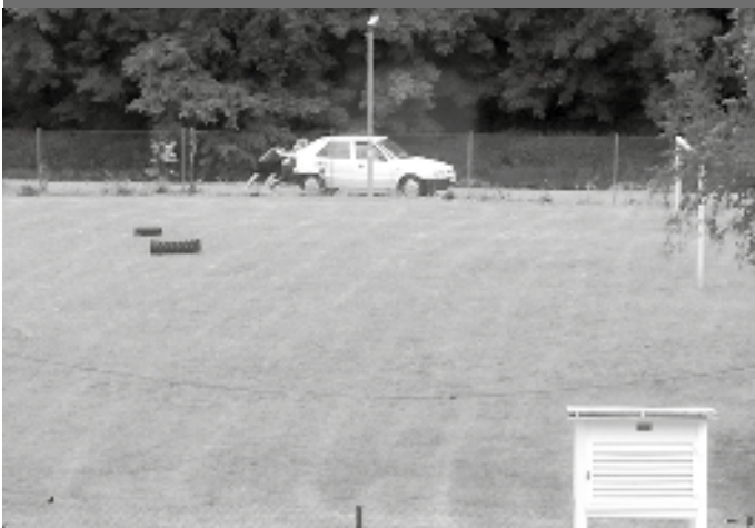
Cyklostezka se dá využít pro různé pohybové aktivity. V tomto případě se jedná o posilování s jedním kusem Škody Felicia