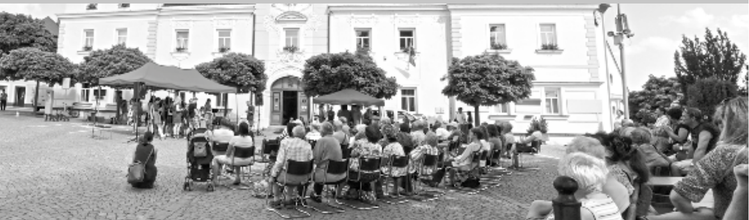
Na Světelském náměstí se 21. června konal tradiční Svátek hudby. Během celého odpoledne se zde vystřídalá stovka hudebníků