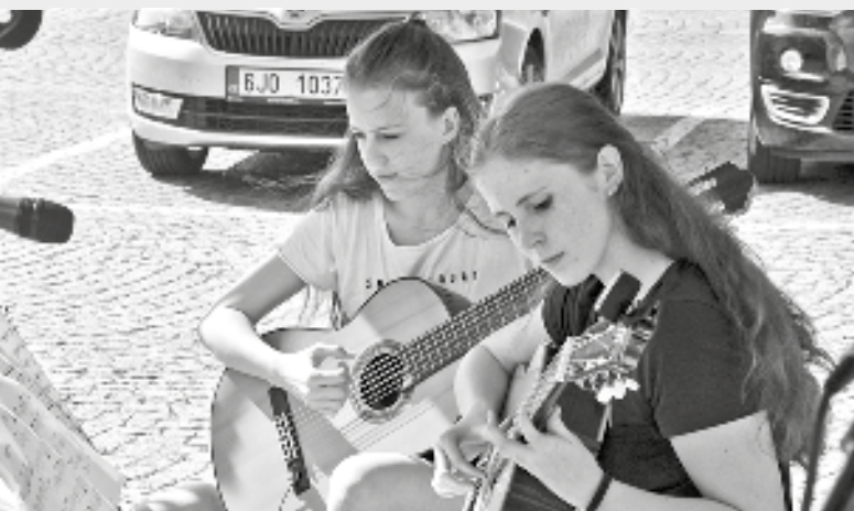
Děvčata z Kytarového souboru