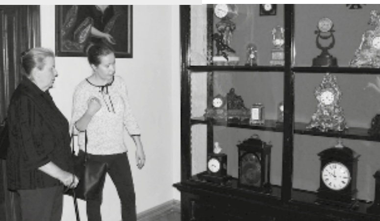
Unikátní sbírku historických hodin zapůjčilo ze svých depozitářů Uměleckoprůmyslové museum Praha