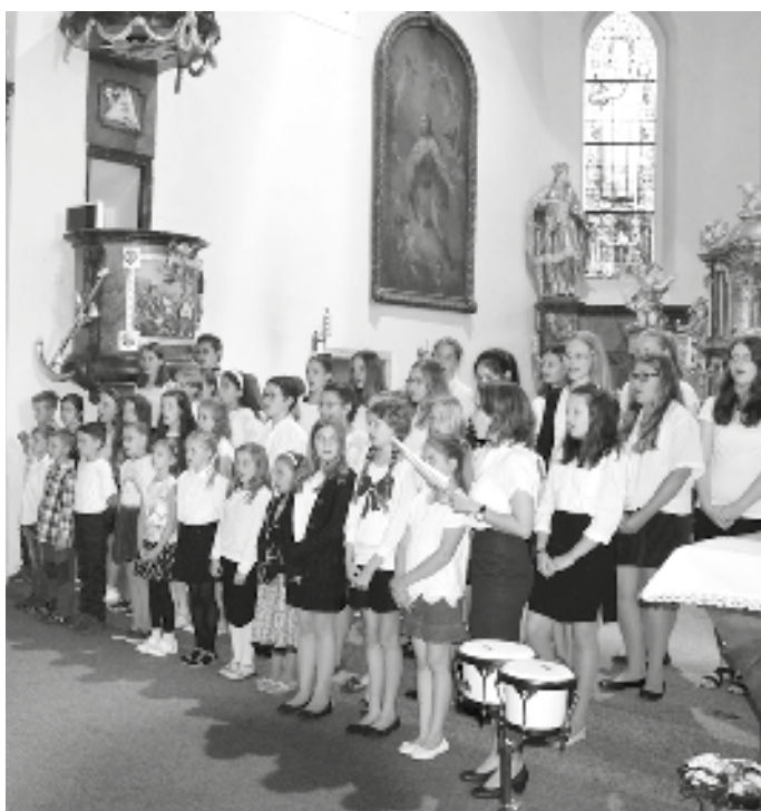
Dětské sbory Zvonek a Zvoneček zpívaly společně