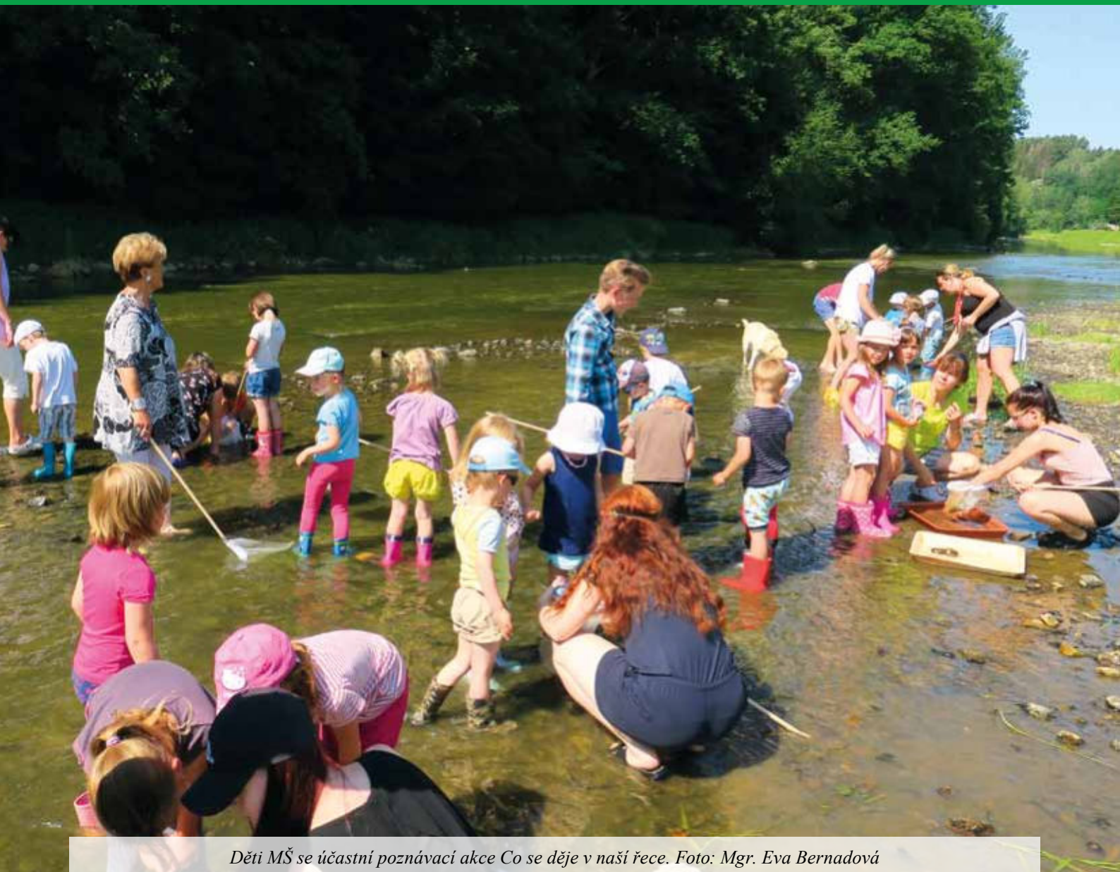
Děti MŠ se účastní poznávací akce Co se děje v naší řece.