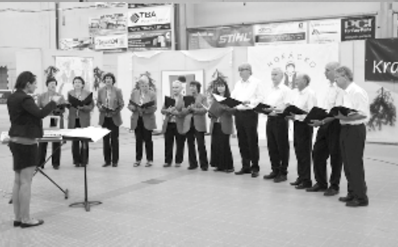
Sobotní festivalový pořad zahájil pěvecký sbor Gaudeamus

vý pořad dětských souborů Pramínky ve stejný den odpoledne v hale Sportovního centra Pěšinky, ve kterém se vedle souborů představily dechová hudba žáků ZUŠ Světlá n. S. a vítězové krajského kola pěvecké soutěže Zpěváček 2017. Znamenity byl večerní koncert sourozenců Hany a Petra Ulrychových se skupinou Javory v divadelním sále a vynikající atmosféru měl další tradiční festivalový pořad Posezení u cimbálu, ve kterém hrála brněnská cimbálová muzika Palouček v Městské restauraci. Stejně tak vydařený byl hlavní festivalový den v sobotu 27. května. Jarmark lidových řemesel s flašinetáři a krátká vystoupení folklorních souborů na náměstí ještě vyšperkovalo krásné slunečné počasí. Do festivalového programu patřilo slavnostní přijetí hostů a zástupců zúčastněných souborů starostou města v obřadní síni radnice. Krásné počasí doprovodilo i odpolední krojovaný průvod folklorních souborů od zámku do Pěšinek, kde se uskutečnil hlavní festivalový pořad Horácko zpívá a tančí. Po krátkých proslovích hostů a úvodním představení světelského smíšeného pěveckého sboru Gaudeamus se rozjelo pestré pásmo tanců a písniček v podání souborů Kuřátka z Chrudimi, Studánka ze Žďáru nad Sázavou, jihlavských souborů Šípek, Pramínek a Vysočan. Z daleka přijely soubory ostravský Holúbek, Pomněnka z jihomoravských Tvrdomic a Bystrzacy z polské Wawolnice, nemohl chybět domácí soubor Škubánek. Vše zakončilo slavnostní defilé všech souborů při společném tanci, doprovázené uznalým potleskem publika.