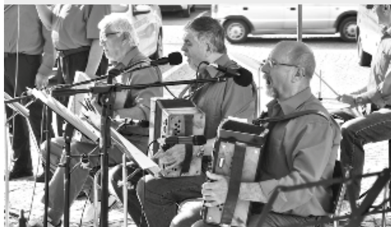
Předposledními účinkujícími byli Světělští heligonkáři