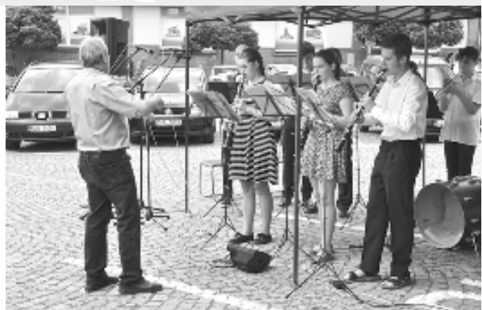
Pokračovaly soubory základní umělecké školy. Jako první vystoupil Dechový orchestr