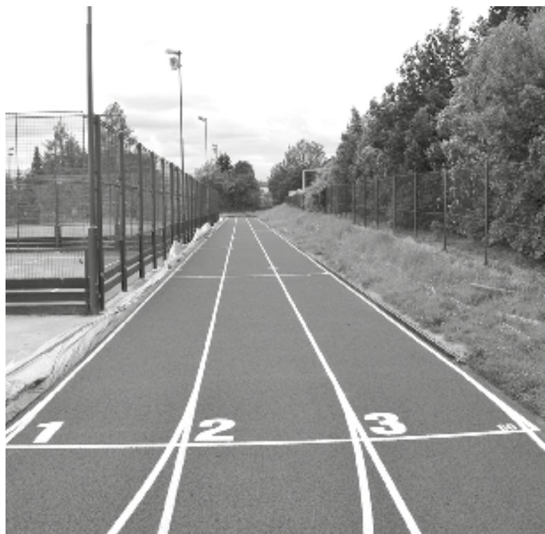
Tartanová tříproudová dráha v novém hávu