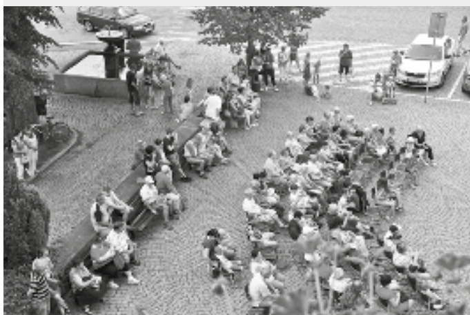
Počasí letošního svátečního dni přálo