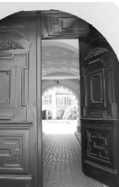
Vchod do východního barokního křídla zámku zdobí dřevěná vyřezávaná vrata

Společnost Czech Tourism podporující cestovní ruch vyhlásila po loňském Roku Karla IV. rok 2017 Rokem českého baroka. Pro Světlu nad Sázavou je určitě potěšující, že světelský zámek reprezentuje jako jedna z pěti památek barokní Vysočiny vedle takových skvostů, jako jsou Zeleňá Hora Jana Santiniho Aichela, barokní komplex kláštera a zámku ve Žďáru nad Sázavou nebo zámek Jaroměřice nad Rokytinou. Díky tomu se světelskému zámku dostalo pocty, když byl ve dnech 28. a 29. června prezentován v rámci společného projektu Czech Tourism a Vysočina Tourism na Staroměstském náměstí v Praze. Však si společnost Zámek Světla nad Sázavou připravila bohatý kulturní program s mottem Baroko všemi smysly. První významnou akcí zmíněného programu byl v sobotu 1. července Den