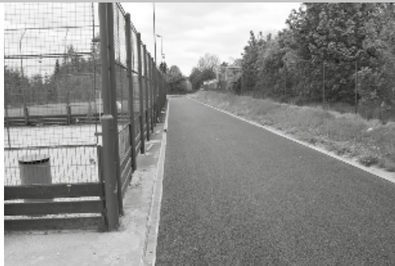
Budoucí běžecká dráha s položenou vodopropustnou živičnou vrstvou před stříkáním tartanu

Téměř tři čtvrtiny roku bylo víceúčelové hřiště v Komenského ulici pro sportovce nepřístupné, procházelo rozsáhlou rekonstrukcí. Původní umělé povrchy sportovišť po patnácti letech provozu dosloužily, bylo je třeba vyměnit. Slovenská firma specializovaná na výstavbu sportovišť s umělým povrchem provedla rekonstrukci se vším všudy, to znamená, že byly odstraněny všechny vrstvy rekonstruovaných sportovišť včetně podkladního šterkového lože. To bylo nahrazeno novým hrubým šterkem a po jeho ztuhnutí byla položena živičná vodopropustná vrstva, na kterou se již stříkal červený elastický povrch na bázi pryžového granulátu zvaný tartan. Jeho výhodou je, že se na něm dá sportovat i při nepříznivém počasí a především šetří kloubní aparát sportovců. Hřiště pro malou