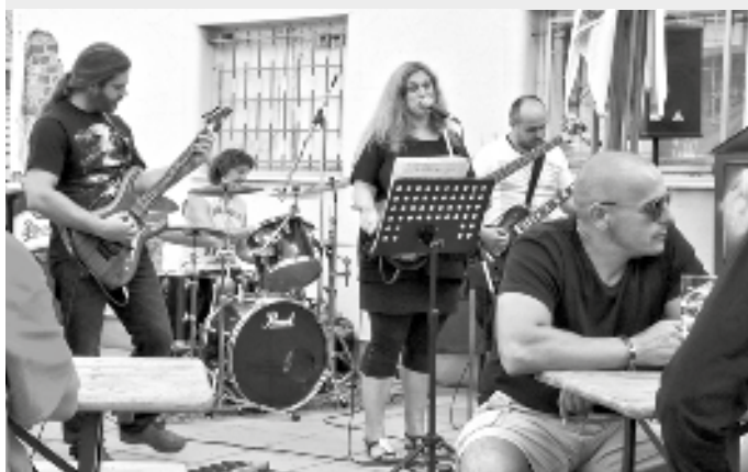
Koncert kapely SSM - Světelský Sraz Mániček byl rockovou třešničkou na dortu za celodenním programem