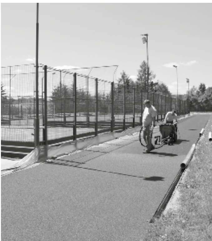
Tartan se stříkal ve dvou vrstvách