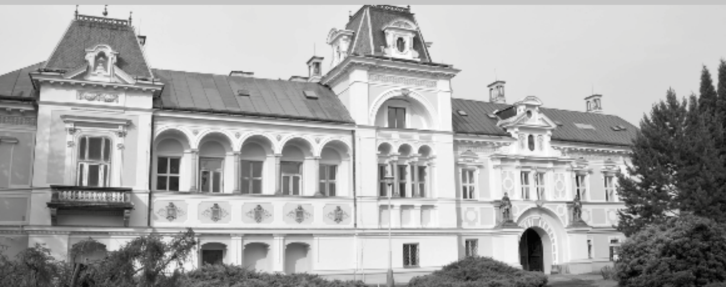
V původní barokní podobě se dodnes dochovalo pouze východní křídlo zámku (na snímku)