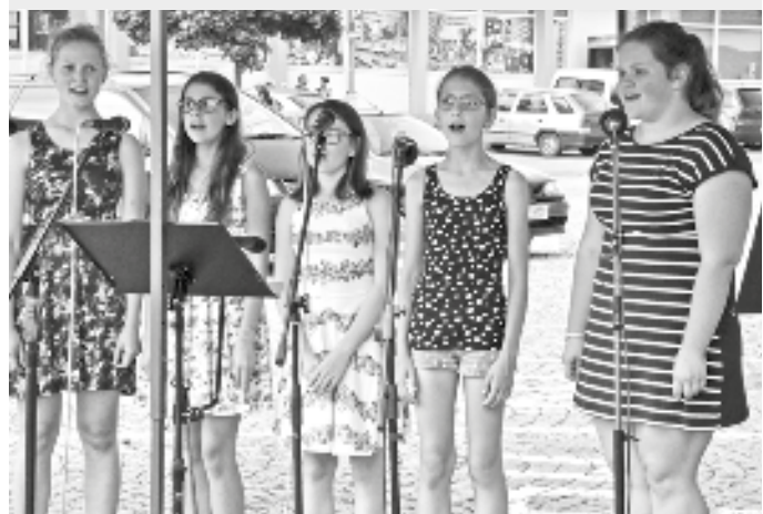
Pěvecký sbor - pobočka ZUŠ Golčův Jeníkov