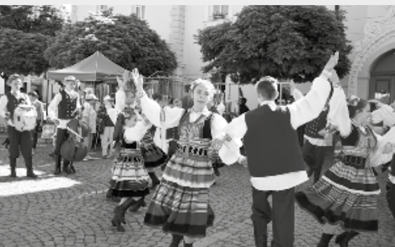
Polský soubor Bystrzacy byl ve Světlé již podvanácté