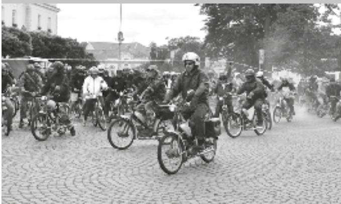
Propagační jízda Vysočinou byla právě odstartována