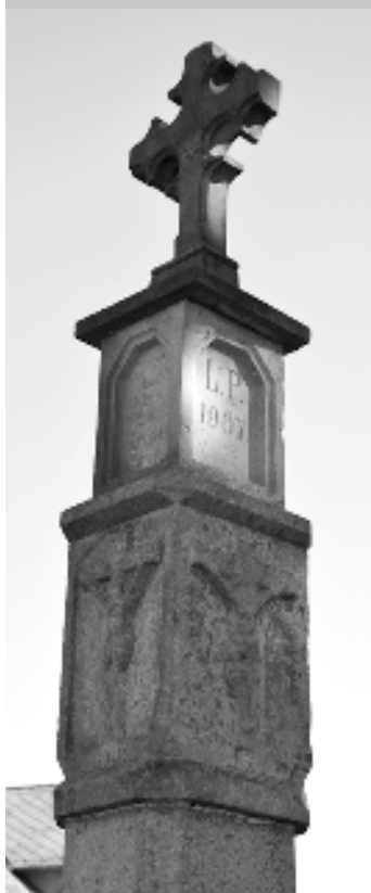
Boží muka v Josefovské ulici z roku 1907

Víte, že obrázek z titulní strany přináší pohled na novodobé zpracování tradiční malé sakrální stavby – Boží muka – která jsou od června letošního roku k vidění v našem městě?