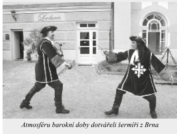
Atmosféru barokní doby dotvářeli šermíři z Brna