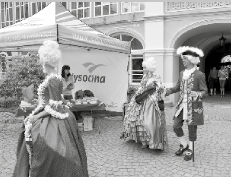
Pozornost návštěvníků poutala šlechta v nádherných dobových kostýmech