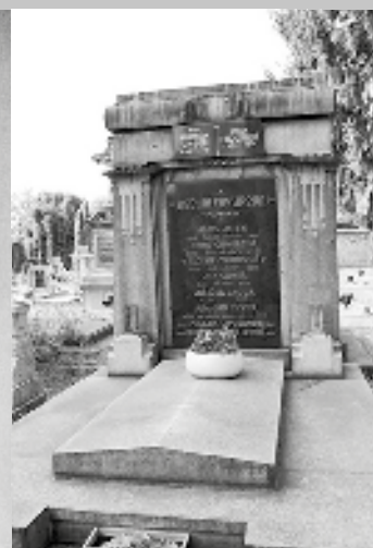
Místo posledního odpočinku Aloise Jelena v Brandýse nad Labem

vstoupil do státní služby, ve které zůstal až do smrti. Od roku 1824 byl archivářem českého gubernia 7 , od roku 1849 vykonával stejnou práci v archivu ministerstva vnitra ve Vídni. Je zajímavé, že jeho angažovanost v českém národním hnutí nebyla ve státní službě na závalu.