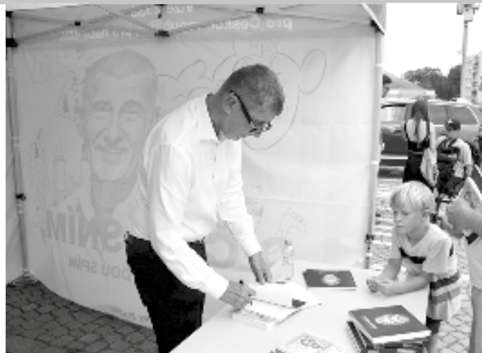
Andrej Babiš na náměstí podepisuje svoji knihu O čem sním, když náhodou spím

Výjimkou byl pátek 4. srpna 2017. V ten den bylo možné potkat ve Světlé n. S. hned tři významné politické osobnosti. Předseda hnutí ANO 2011 Andrej Babiš, v současné době tolik propíraný ve všech médiích v souvislosti se stavbou luxusní usedlosti Čapí hnízdo nejprve navštívil Sociální centrum města Světlá nad Sázavou, po té se objevil na náměstí Trčků z Lípy, kde besedoval s občany a podepisoval svoji knihu O čem sním, když náhodou spím a závěr odpoledne strávil s manželkou v doprovodu své ochranky v zámeckém parku v roli návštěvníka Sázavafestu. Téměř ve stejnou dobu navštívil festivalový areál