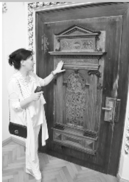
Majitelka zámku ukazuje návštěvníkům renesanční bohatě intarzované dveře z dob vlády Trčků z Lípy. Byla na nich ponechána klika s hliníkové slitiny jako ukázka toho, jak necitlivě se k památkám chovali předchozí obyvatelé zámku