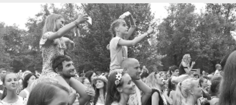
Věkově pestré bylo festivalové publikum a bavilo se znamenitě