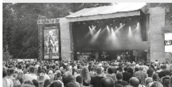
Na pódium právě vystupuje folkrocková kapela Čechomor