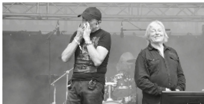
Osobnosti naší populární hudby dvacátého století Jan a Václav Neckářovi