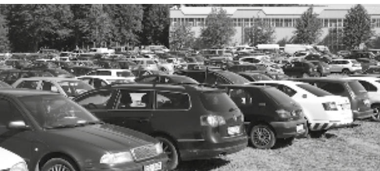
Louka vedle zámeckého parku se proměnila v obří parkoviště osobních automobilů