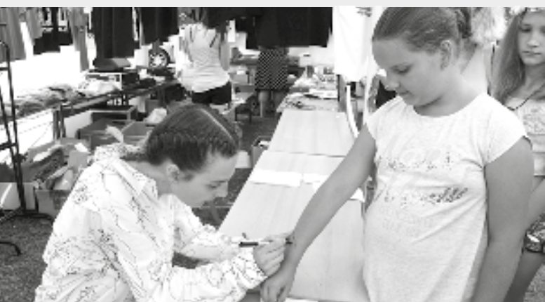
Zpěvačka a herečka Barbora Poláková populární zejména u dívčího publika