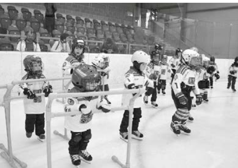
První nejisté krůčky na kluzkém ledě