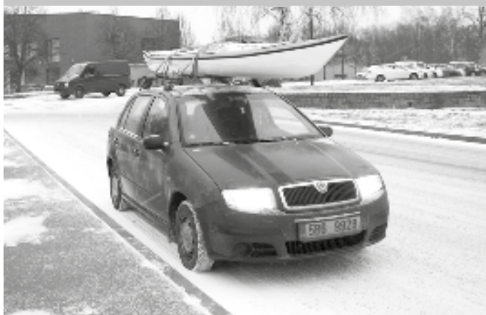
Připraven do každého počasí. Text a foto: J. Víšek