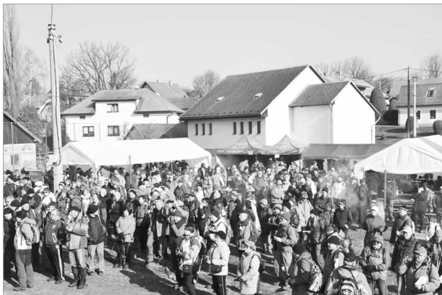
Zahájení jarní sezony