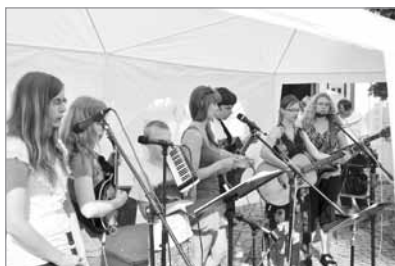
Skupina Vánek na festivalu v roce 2012

21. června v odpoledních hodinách na náměstí Trčků z Lípy Evropský svátek hudby 2013 13. ročník hudební slavnosti ve Světlé n. S.