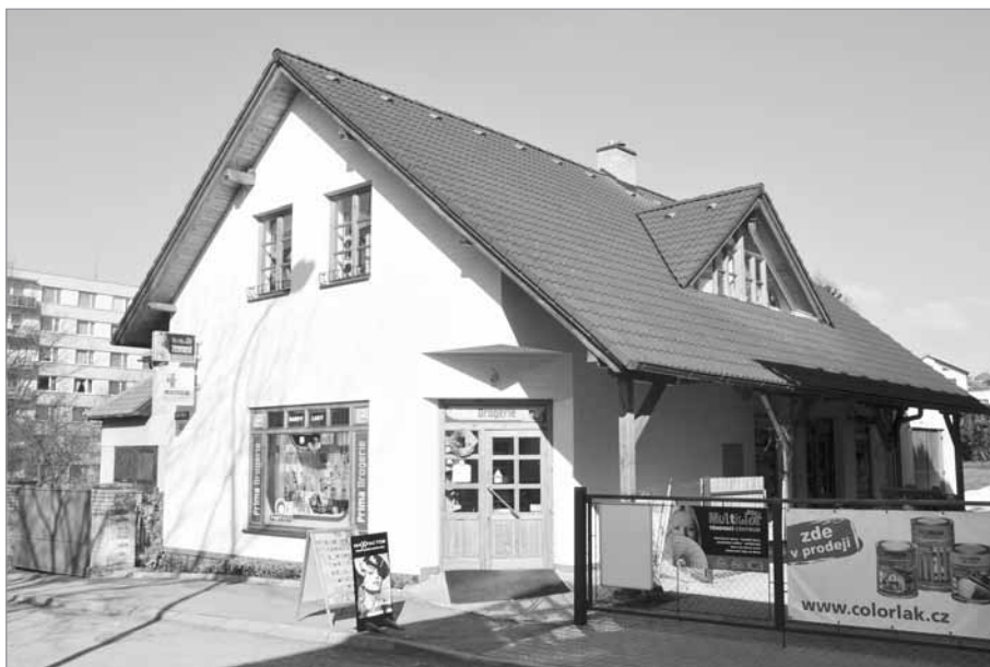
Dům č. p. 72 dnes