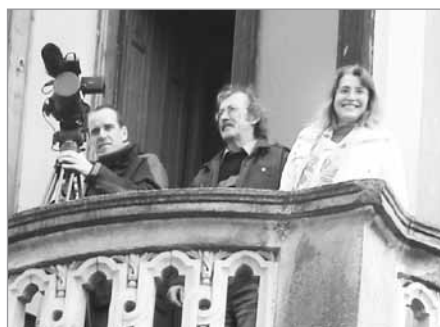
Na balkoně světelského zámku při natáčení Toulavé kamery 27. března 2012

Času je opravdu málo. Díky své práci v muzeu jsem si však splnila i jedno ze