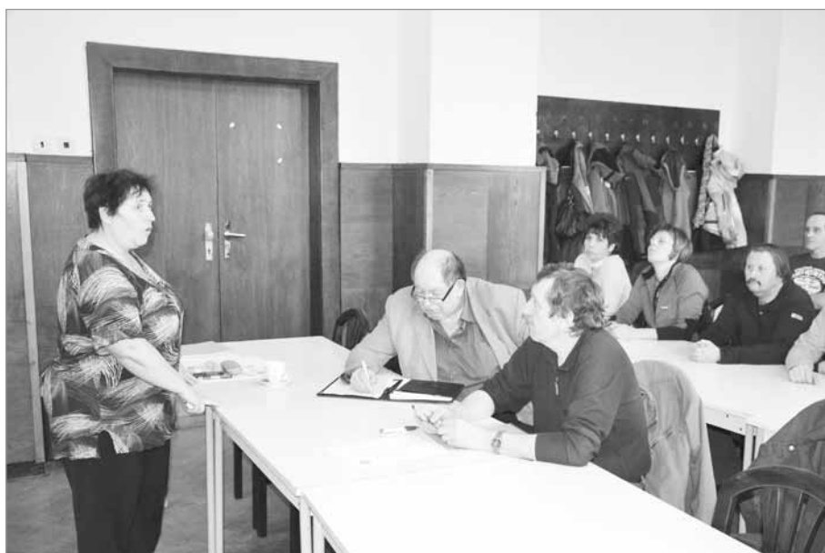
Přípravy na Poslední puchýř 2013