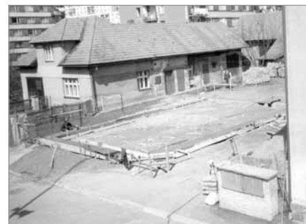
Stav v dubnu 2000