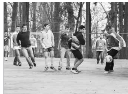
Po vyrovnaném zápase se nechali všichni aktéři zvěčnit. Světelské fans poznáte podle dresů