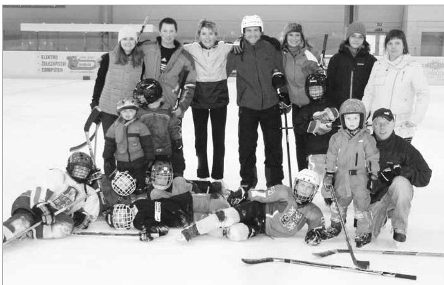
Žáci se svými rodiči, většinou maminkami

dům, aby dětem předali dary, většinou sportovní potřeby, a při této příležitosti sehráli přátelský fotbalový zápas. Protože většina z fanklubu jsou i fotbalisté, dětem nic nedarovali a o gól vyhráli. To nebránilo tomu, aby si pak prohlédli domov a slíbili dětem, že příští rok bude odvěta. Na závěr to hlavní – 6 000 Kč, které do domova věnoval ve věcných darech fanklub a další zimní sportovní vybavení, které věnovala firma Ski sport, povýšilo světelské hokejové fans na super fandý. A nejen hokeje.