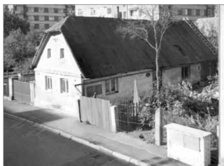
Dům č.p.72 kdysi