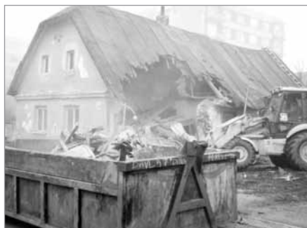
Demolice v listopadu 1999