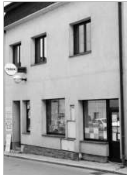
... a dnes čp. 1050