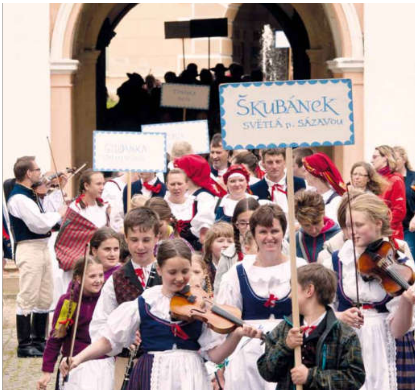
X. ročník folklorního festivalu Horácko zpívá a tančí ve Světlé nad Sázavou

měsíčník města • červen 2015 • cena 10 Kč