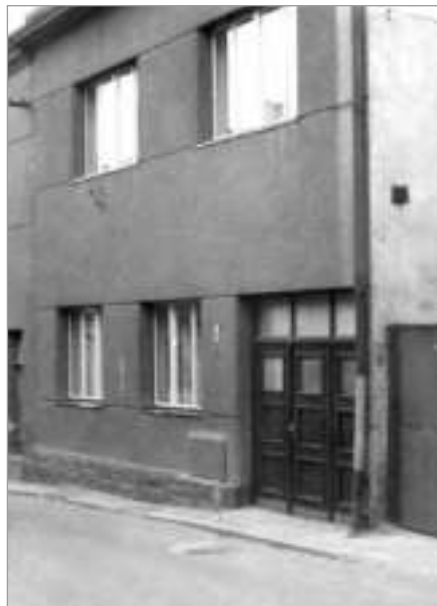
Kdysi dům čp. 150...

Text: Jaroslav Vála