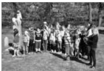
Pietního aktu u památníku na levém břehu Sázavy se 7. května zúčastnily děti ze základních škol.