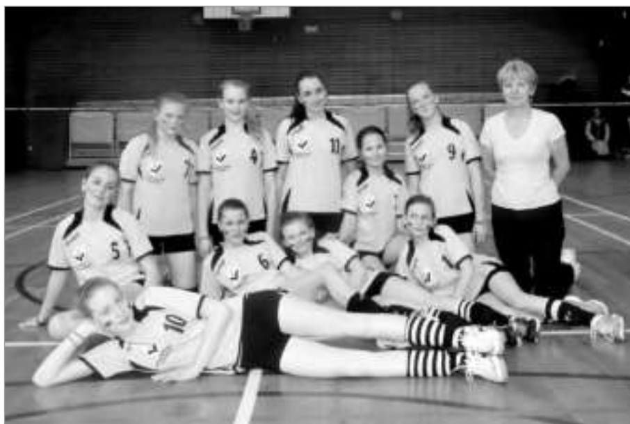
Mladší zákyňe po vybojování postupu v Příbrami

pinách po čtyřech družstvech, kde se bojovalo o další umístění. Skupinu jsme vyhrály bez ztráty setu, když děvčata postupně porazila Vavřinec Kladno, VŠ Plzeň (družstvo nasazené z Českého poháru) a Pegas Znojmo, vždy shodně 2:0, v další postupové skupině jsme si