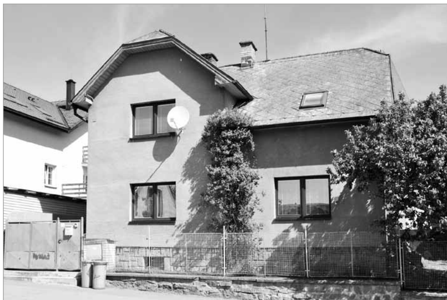
... a dnes

ků v normální pracovní době a nutnost pojištění osob zaměstnaných na stavbě (kromě členů vlastní rodiny) u Svazu zaměstnanců místního hospodářství v Jihlavě.