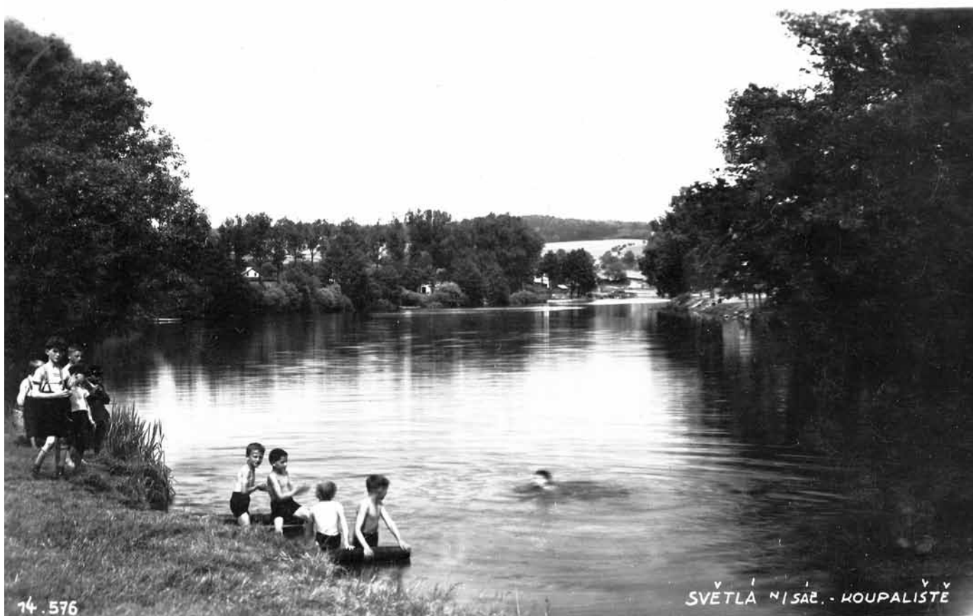
Stará pohlednice Světlé