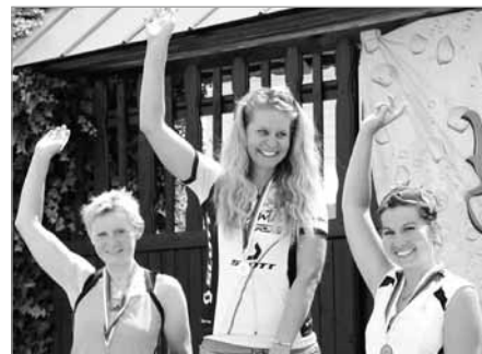
Ženy. No řekněte, nejsou cyklistky krásné?