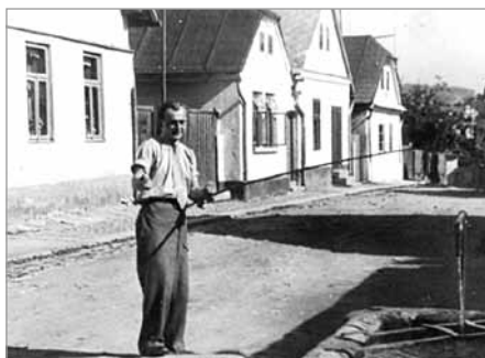
Dům čp. 62 kdysi (poslední vzadu)