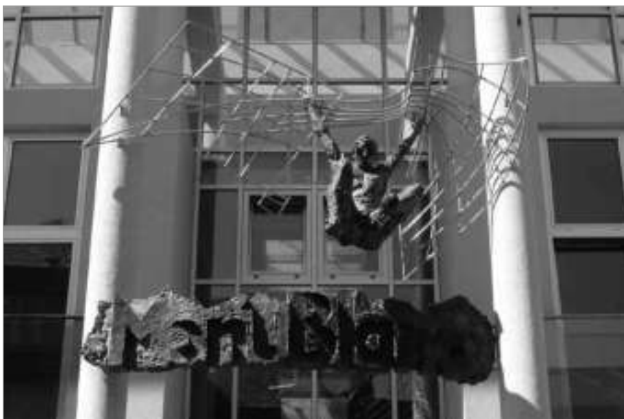
Plastika nad vchodem