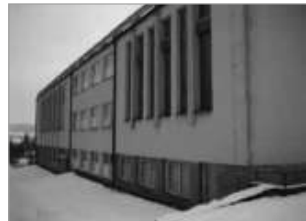
ZŠ Lánecká před realizací projektu...

Celkové náklady: 21 407 462,13 Kč, z toho