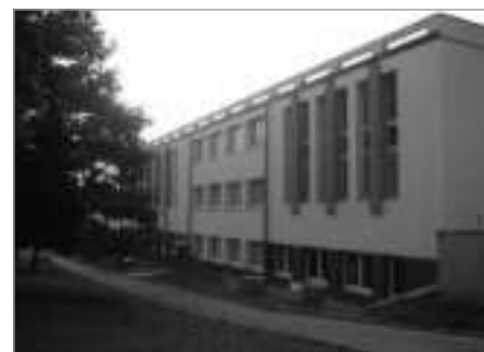
...a po jeho realizaci