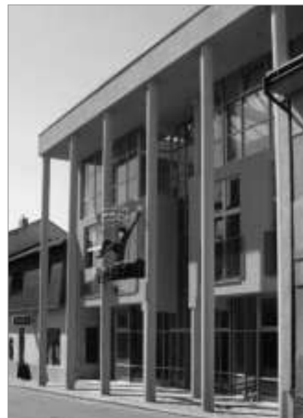
... a dnes