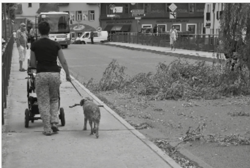
Při odstraňování staré vrby, která spadla na most, pomáhal i čtyřnohý přítel člověka.

různé africké tance, názvy našich kmenů samozřejmě odpovídaly těm africkým, takže s jejich vyslovením jsme měli problém ještě i po několika dnech. Zjistili jsme, jak těžké je přenášet vodu v nádobách na hlavě, ještě těžší je chytit vodu při dešti do nádoby a snad nejvíc jsme se báli při přepadení našich vesnic. Zjistili jsme tak, že u nás se máme dobře, nejsme ohrožováni válkou ani únosy dětí, při kterých jsou celé vesnice vypáleny a vypleněny.