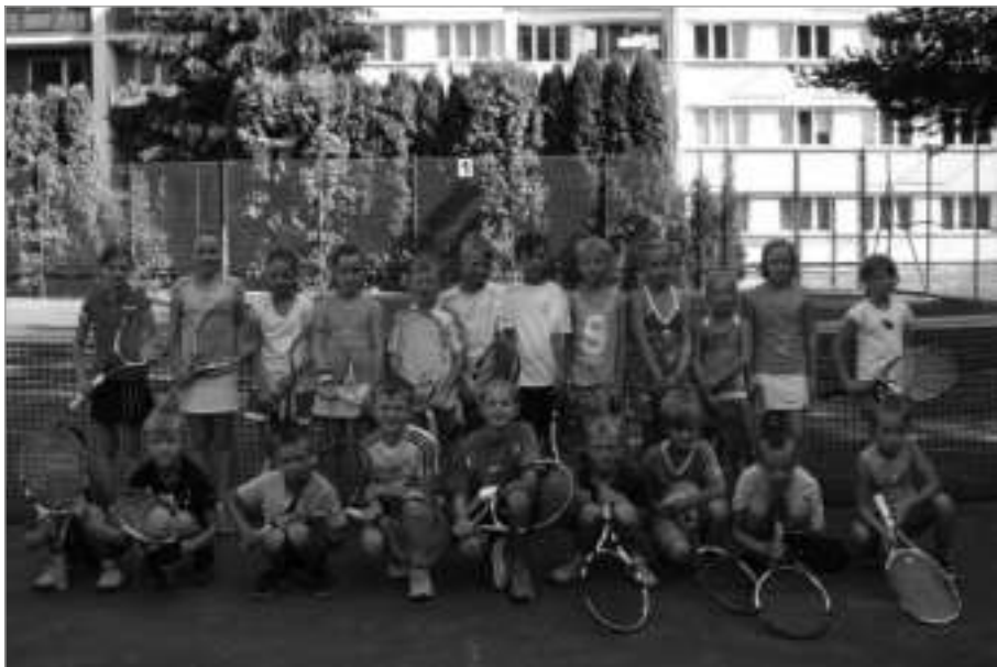
Všichni účastníci turnaje