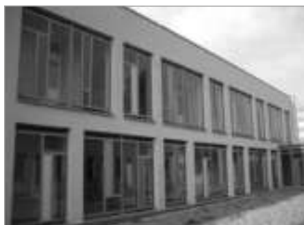
...a po jeho realizaci