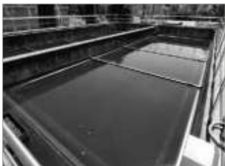
Dosazovací nádrž na ČOV v Mrzkovicích

► realizována postupně ve dvou etapách (v 70. a 80. letech). V první etapě byl realizován mechanický stupeň ČOV s kmenovou kanalizační stokou a čerpací stanice odpadních vod „Černý vír“. Ve druhé etapě byl realizován biologický stupeň ČOV s kalovým hospodářstvím. ČOV byla uvedena do provozu v roce 1983 a v roce 1998 prošla významnou rekonstrukcí. Účelem této rekonstrukce bylo zajištění odbourávání dusíkatých látek. ČOV Světlá n. S. se skládá z objektu mechanického předčištění (jemné česle s vírovým lapákem písku a lapač plovoucích nečistot), z biologické části (aktivační a dosazovací nádrž) a z objektu kalového hospodářství.