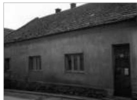
Dům čp 149 kdysi...