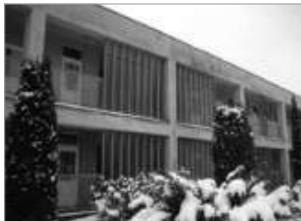
MŠ Na Sídlišti před realizací projektu...

Celkové náklady: 11 205 584,04 Kč, z toho