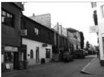
Stavba domu v roce 2001