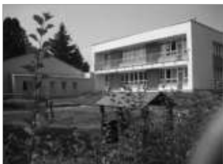
...a po jeho realizaci