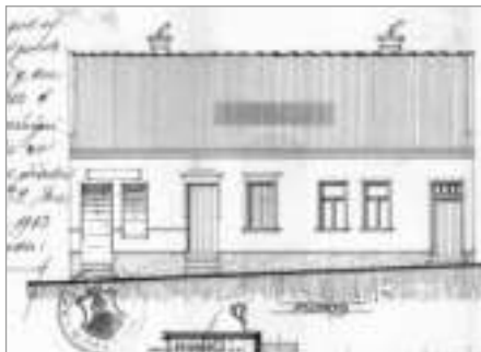
Výkres z roku 1912

Ze dne 22. července 1912 je žádost adresovaná městské radě: „ Hodlám přestavěti svůj dům čp. 149 na krám a kuchyň, jak v dvojmo přiložených plánech naznačeno jest. [...] Podotýkám,