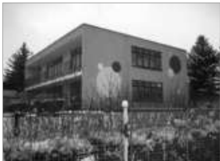
MŠ Lánecká před realizací projektu...

V letech 2014 -2015 byly ve Světlé nad Sázavou zatepleny budovy MŠ Lánecká, MŠ Na Sídlišti a ZŠ Lánecká. Všechny 3 projekty byly spolufinancovány Evropskou unií – Fondem soudržnosti a Státním fondem životního prostředí ČR v rámci Operačního programu Životního prostředí.