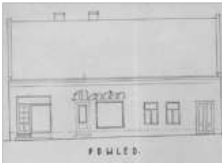
Výkres z roku 1930