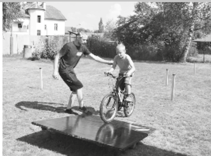
O to, vyzkoušet si překážkovou dráhu na kole, se postaral světelský cykloservis

těž Den otevřených dveří Sportovního centra Pěšinky. Zájemci tak měli možnost si prohlédnout zrekonstruovanou hernu stolního tenisu, klubovnu šachového oddílu, hokejové šatny, saunu a posilovnu. Mnohé uchvátila svojí vybaveností tělocvična Akademie bojových umění nebo střelnice hokejového klubu.“