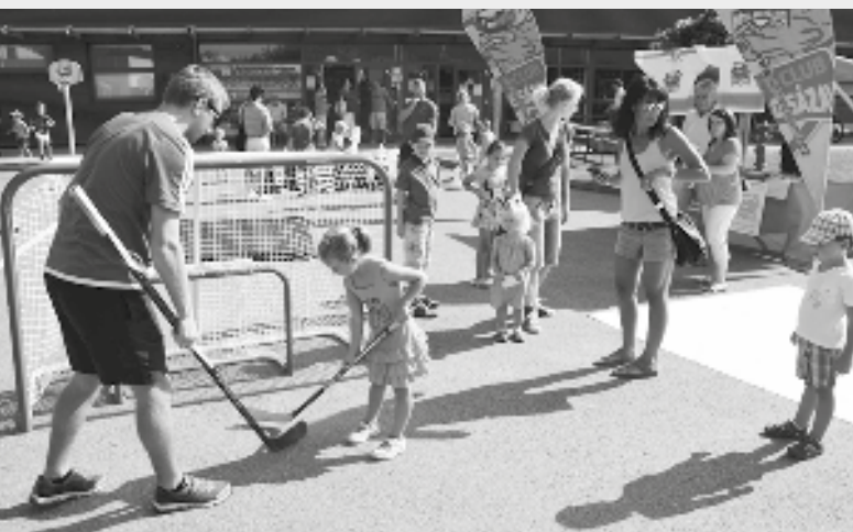
O to, jak držet správně hokejku, měla zájem i malá děvčata