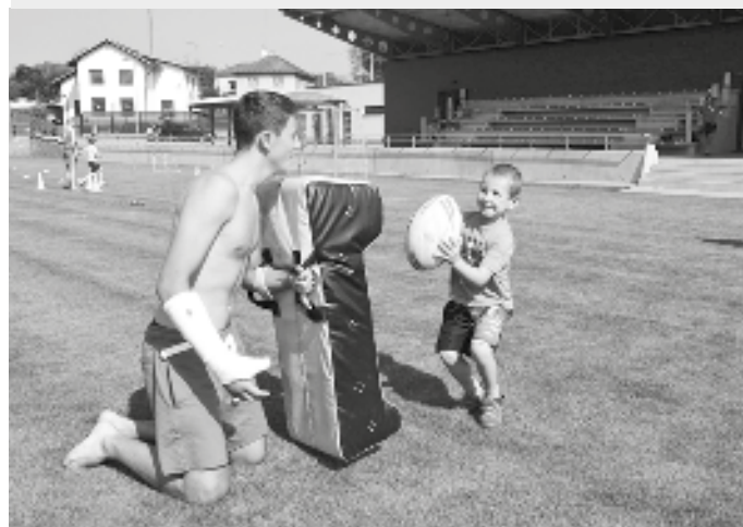
Do tajů ragby zaskvěovali ragbisté z Havlíčkova Brodu