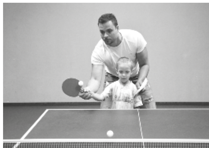
Trefit pingpongový míček napoprvé není jednoduché