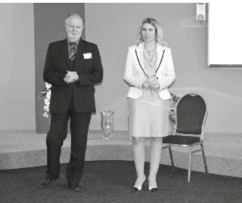
Slavnostní zahájení v aule školy