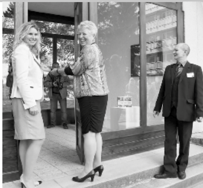
Slavnostní otevření nové školní galerie

Důležitým bodem pátečního odpoledne bylo otevření další nově vybudované galerie pro výstavy uměleckých prací. Stuhu