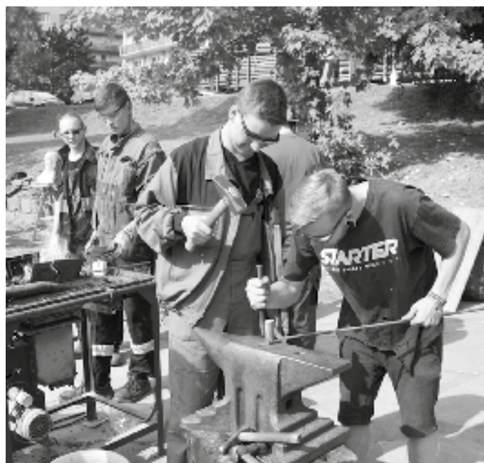
Kováři předvádí své řemeslo