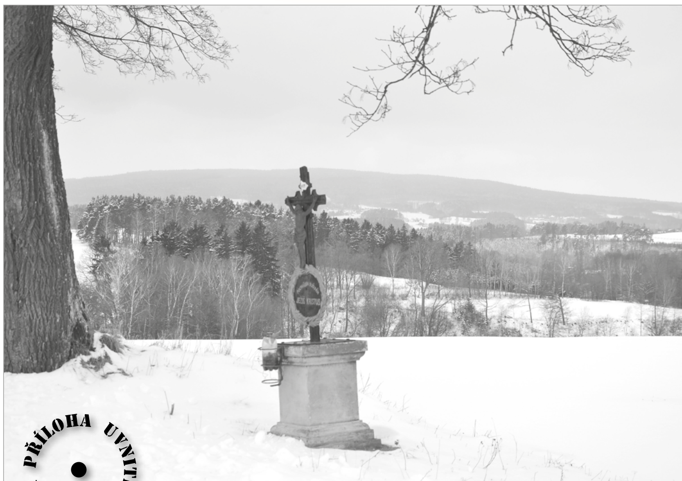
Melechov z kalvárie

měsíčník města • leden 2014 • cena 10 Kč