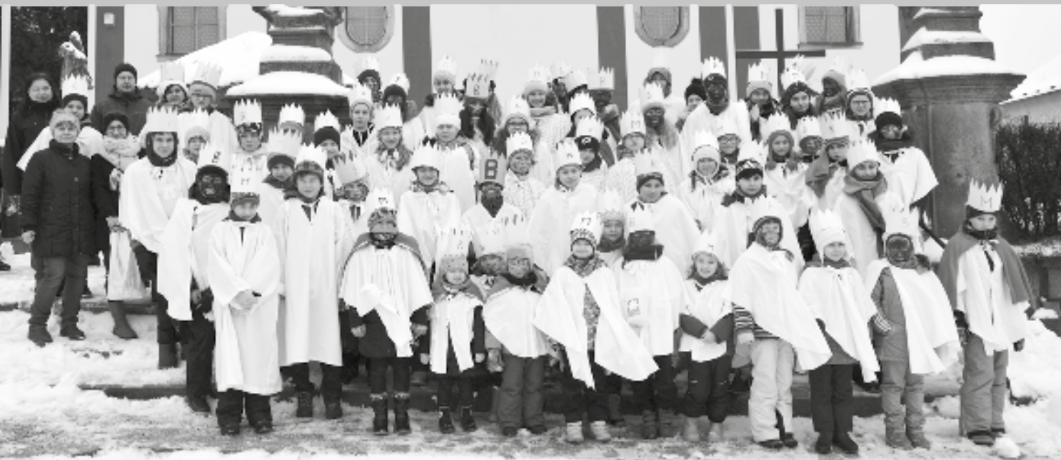
Společné foto koledníků před kostelem je ve Světlé každoční tradicí

Kdyby se někdo letos koledníků zeptal, jaká byla tříkrálová sbírka, asi by každý odpověděl, že mokrá. Sice byl sníh a vypadalo to jako pravé zimní počasí, ale celé dopoledne padal sníh ve spolupráci s deštěm trvale, a tak byli všichni koledníci během chvilky promáčení od hlavy až po paty. Ale klobouk dolů, nikdo to nevzdal a všichni se snažili obejít svojí část města pečlivě.