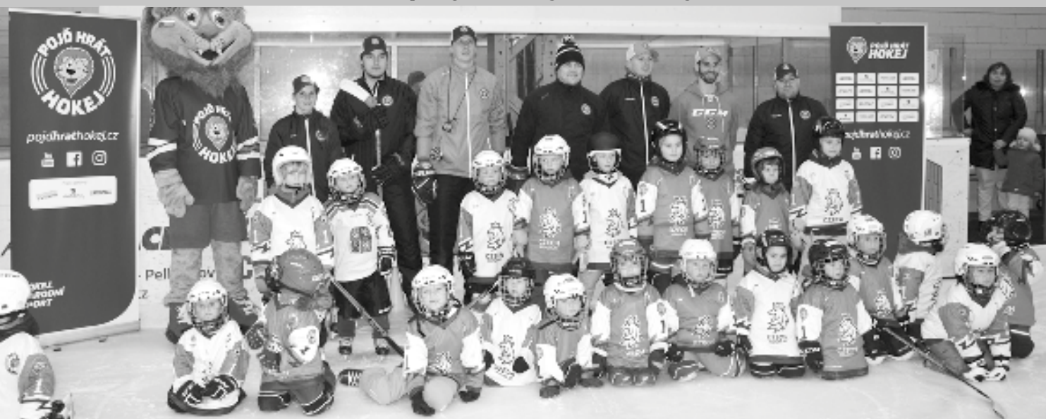
Společné foto v reprezentačních dresech

V pondělí 21. ledna se stal světelský zimní stadion součástí celorepublikového projektu Českého hokeje (Český svaz ledního hokeje), který by měl přilákat další děti k hokeji. V týdnu od 21. do 27. ledna se do akce zapojilo 149 zimních stadionů po celé České republice. I ve Světle nad Sázavou obdrželi všichni malí účastníci této akce hokejový dres s novým logem českého hokeje, na který si mohli napsat své jméno. Potom všichni pod dohledem maskota Lvička a zkušených trenérů vstoupili na ledovou plochu, většina z nich se zatím opírala o hrazdičku. Po společném fotografování přišly na řadu první samostatné krůčky na ledové ploše. Trenéři zábavnou formou učili začínající bruslaře, aby se nebáli ledu a když upadnou, aby se uměli sami postavit na brusle. Vydareného odpoledne se zúčastnilo 24 dětí ve věku od 4 do 8 let, čtyři z nich byly dívky. Hostem odpoledne v Pěšinkách byl bývalý profesionální hokejista, účastník pěti mistrovství světa a majitel tří zlatých medailí mistra světa Viktor Ujčík, který je v současnosti předsedou disciplinární komise naší hokejové extraligy. Za tento projekt si Český hokej zaslouží palec nahoru.