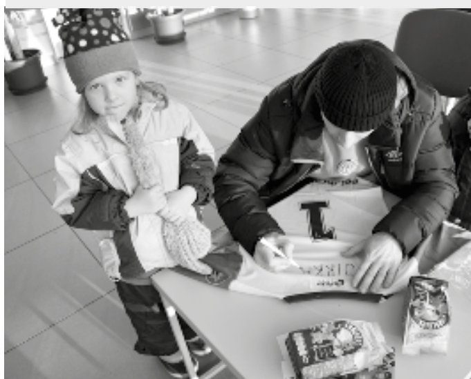
Každý si mohl na dres napsat své jméno. To byla práce pro tatínky nebo maminky