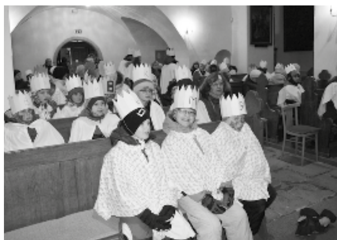
Ráno před koledou se sešli všichni v kostele sv. Václava