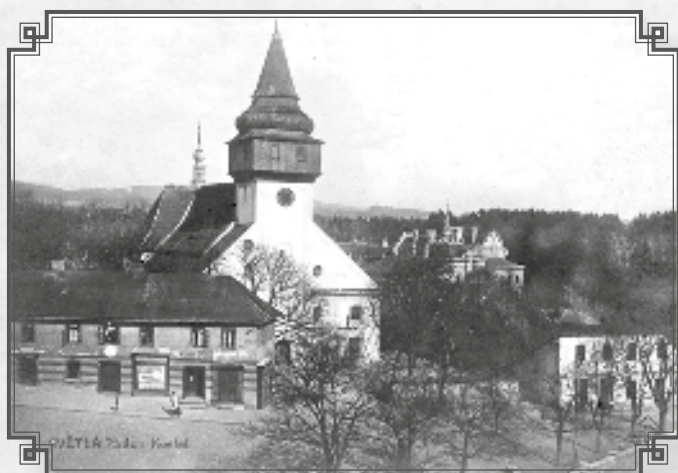
Kostel, v pozadí zámek