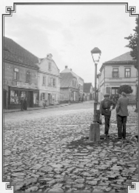
Pohled z náměstí do Lánecké ul.