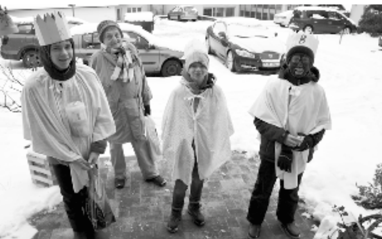
Každou skupinu tří králů musela doprovázet dospělá osoba