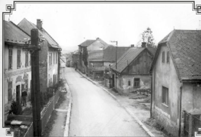
Pohled z železničního mostu do staré Lánecké ul.