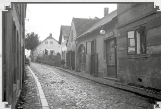
Pohled do Dolní ul. z náměstí