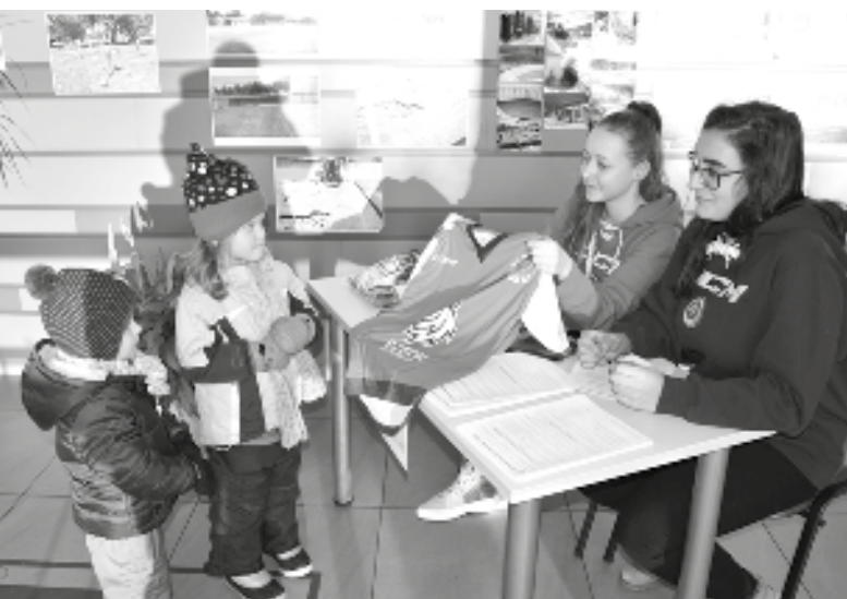
Při prezentaci každé dítě obdrželo hokejový dres s logem Českého hokeje