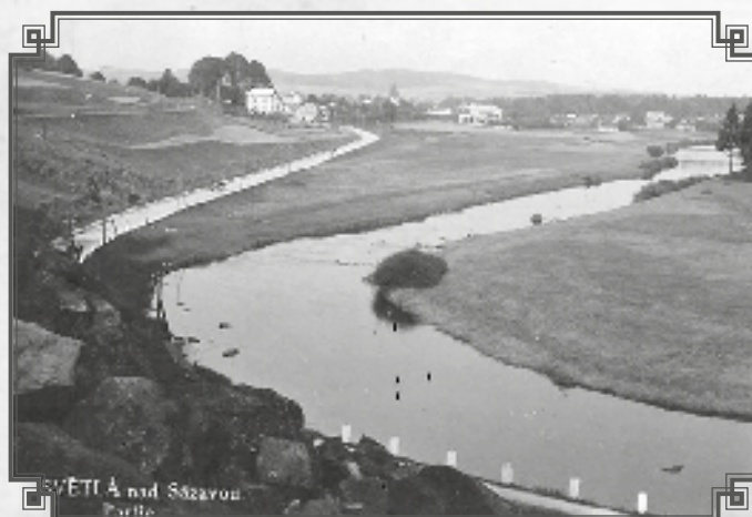
Černý vír, Sázava ještě bez regulace