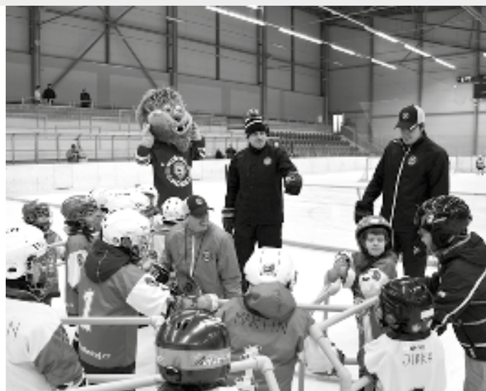
První chvíle na ledě. Vedle maskota, stojícího uprostřed, je host akce bývalý reprezentant a trojnásobný mistr světa Viktor Ujčík