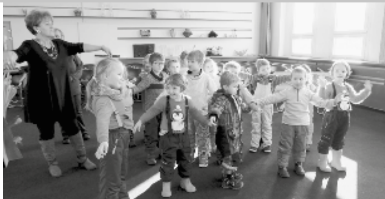
Nejdříve si trochu pohrajeme