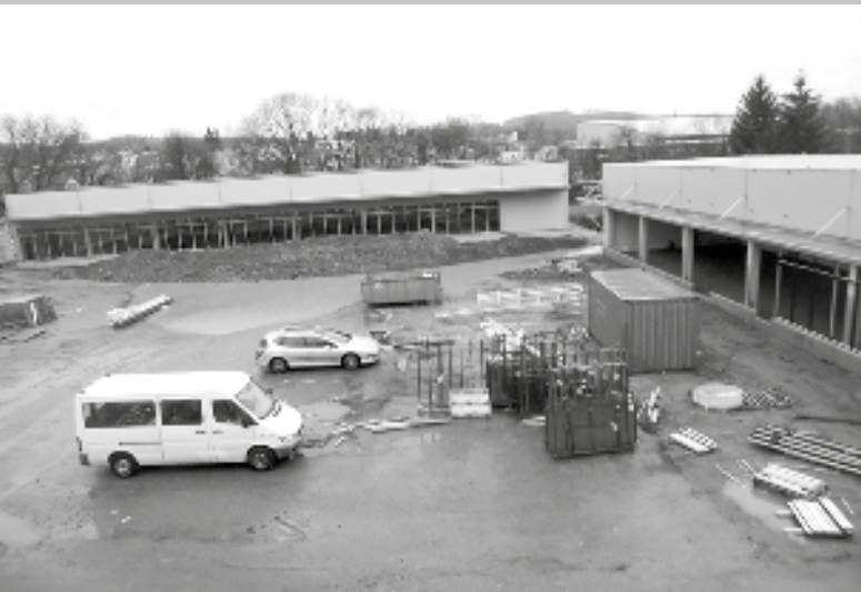
Pohled na část areálu Centra obchodu a služeb. V čele je objekt prodejny KiK a vpravo hrubá stavba budovy, ve které budou prodejny obuvi, květin a tabáku