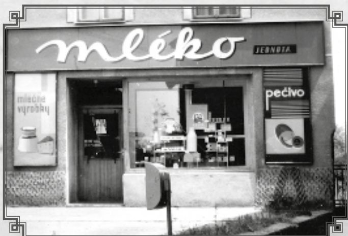
Mlékárna nám. u Pergů