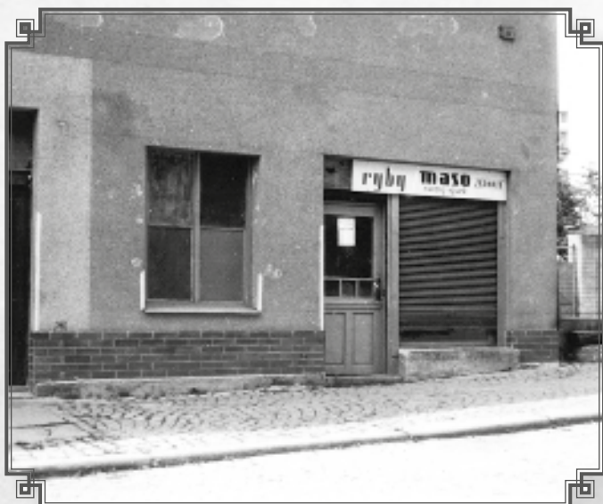
Nucený výsek – prodavač Petr Krejčí