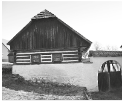
Součástí skanzenu v Pohledí je též roubená chalupa bezzemka

Stalo se již tradicí, že selské muzeum Michalův statek v Pohledí, které je národní kulturní památkou, zahajuje turistickou sezonu o Velikonocích. A bude tomu tak i o těch letošních. Spolek pro obnovu Českého království připravil na dny 20. a 21. dubna program nazvaný Staročeské Velikonoce na Michalově statku. Návštěvníci skanzenu budou mít po oba dny možnost během komentovaných prohlídek statku nahlédnout do života obyvatel selského statku o velikonočních svátcích v časech před zrušením roboty, poznají, co se v těch dnech jedlo a pilo. V sobotu v Pohledí vystoupí se svým velikonočním pásmem dětský folklorní soubor Škubánek. Děti předvedou staré velikonoční zvyky a obyčeje, například vynášení smrtky, přinášení nového líta hospodáři, zapívají velikonoční koledy. Po oba dny dopoledne bude vystupovat populární Kočovné loutkové divadlo Rózy Blechové.