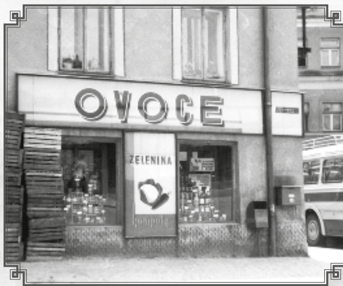
Ovoce – zelenina u Pergů