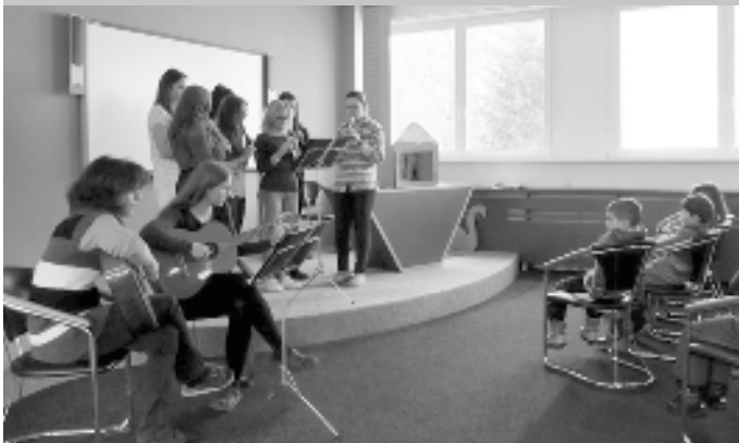
Pozor děti, začínáme