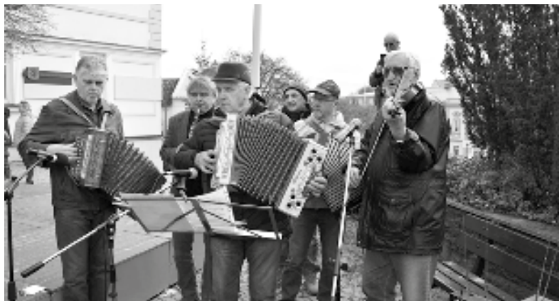
Každoročně vyhrává maškarám i divákům na světelském náměstí masopustní kutálka