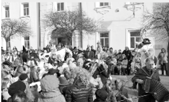
Masopustnímu veselí před radnicí přihlíží tradičně spousta diváků