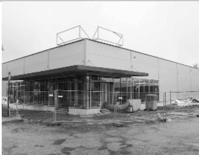
Budova prodejny Billa. Montéři již pracují na vnitřních instalacích

Když se před rokem rozkřiklo, že ve Světlé nad Sázavou rozšíří možnosti nákupu potravin supermarket Billa, šuškal se o tom, že nový obchod bude otevřen již na Mikuláše, tedy v prosinci 2018. Leč stavební práce neprobíhaly a termín otevření nové prodejny se odkládal. Koncem léta se na oplocení staveniště objevila tabule, na které je termín dokončení 19. 2. 2019. Ale ani v tomto termínu nová Billa své první zákazníky nepřivítala.