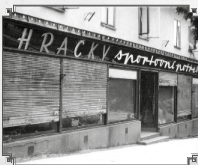
U Picků – prodavačka Mařenka Čechová