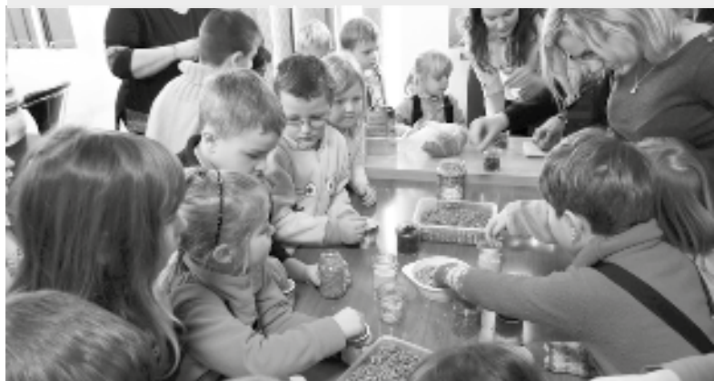
Potom pěkně navaříme

Děti se dozvěděly, jak správně v zimě ptáčkům na krmítcích i vody pomáhat, a vyzkoušely si pozorování s pomocí daleko-