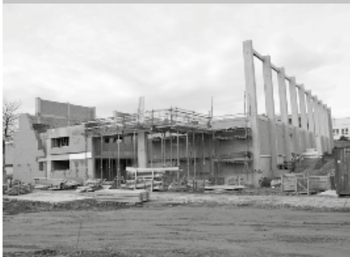
Hrubá stavba haly se vstupním portálem. Pohled od Komenského ulice