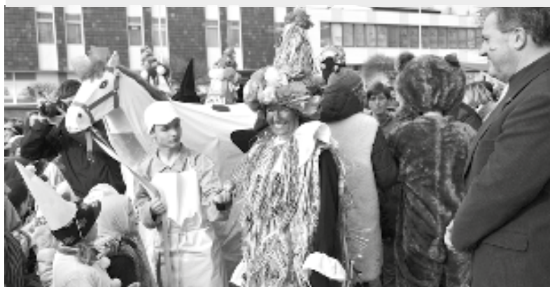
Mezi ty masky, které mají svoji symboliku, patří ras s kobyloou a slaměný