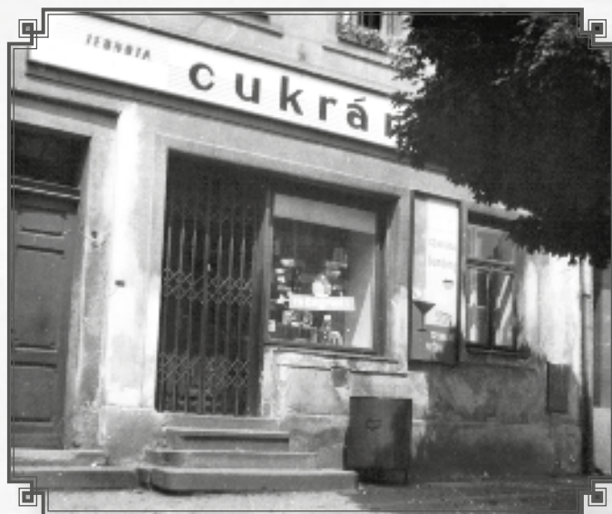
Cukrárna – prodavačka Hilda Dolejší