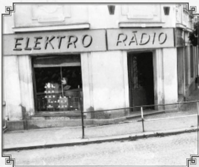
Na Kopečku Elektro – vedoucí Sl. Říha