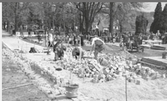
Dlaždiči při práci