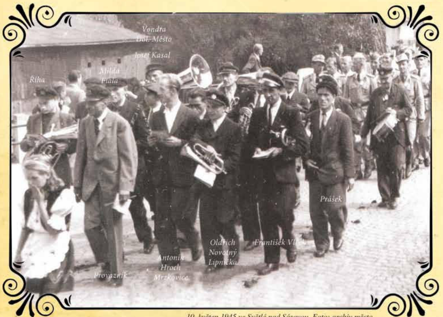
10. květen 1945 ve Světlé nad Sázavou.