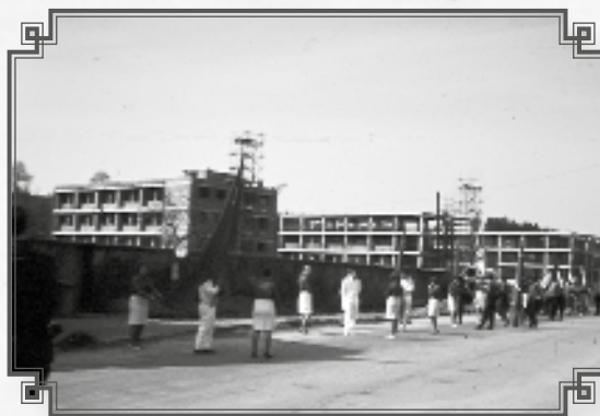
První se stavělo sklářské učiliště a škola