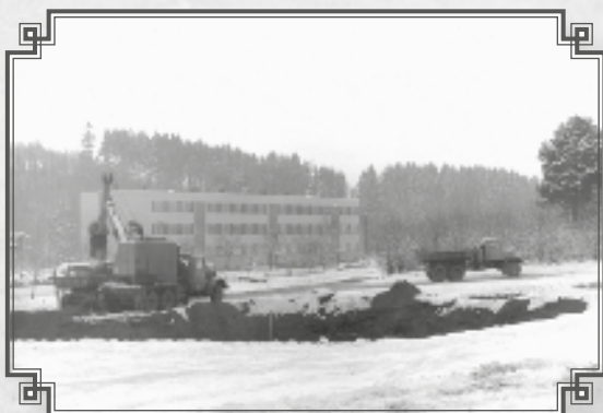
Bytovka pod silnicí