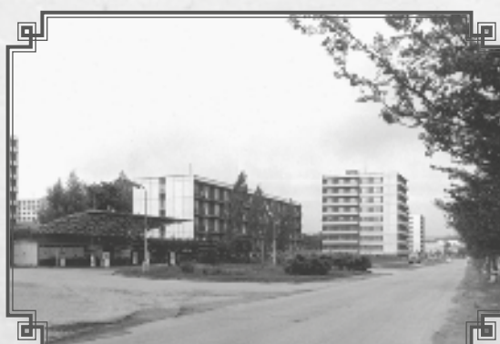
A takto jsme nakonec vypadali s tehdejší benzinkou