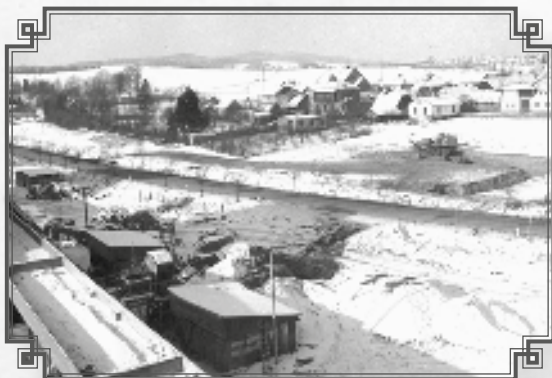
Pohled z učiliště na budoucí staveniště