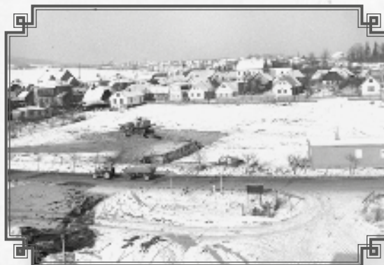
Příprava staveniště vč. Dolní ulice