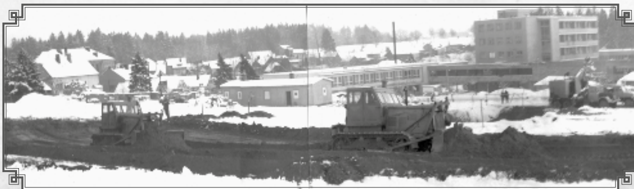
Zemní práce na staveništi