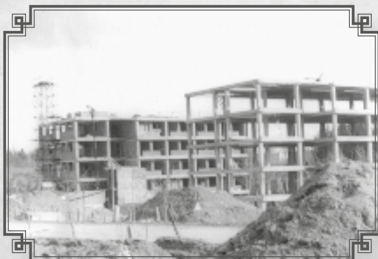
Takto jsme rostli dál