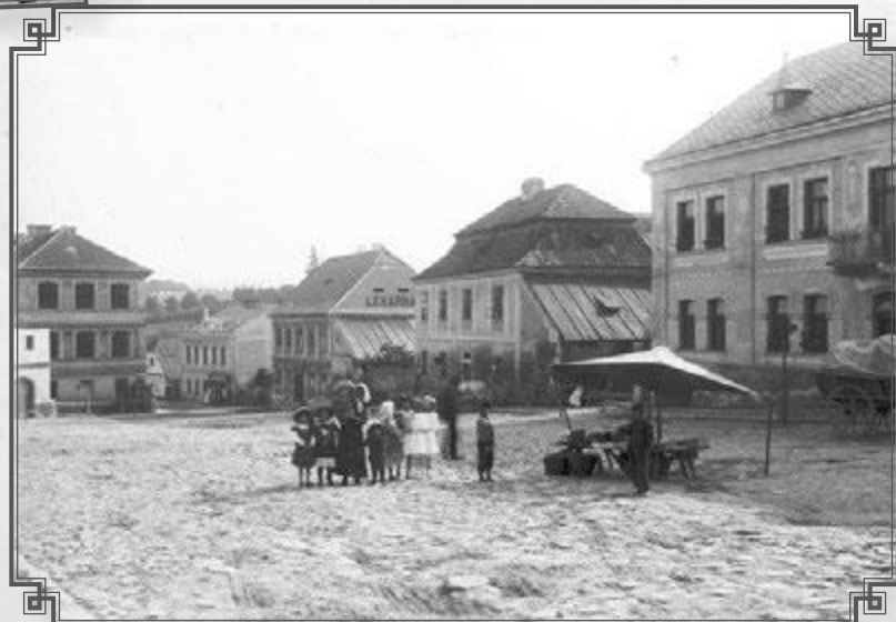
Pohled do spodní části náměstí