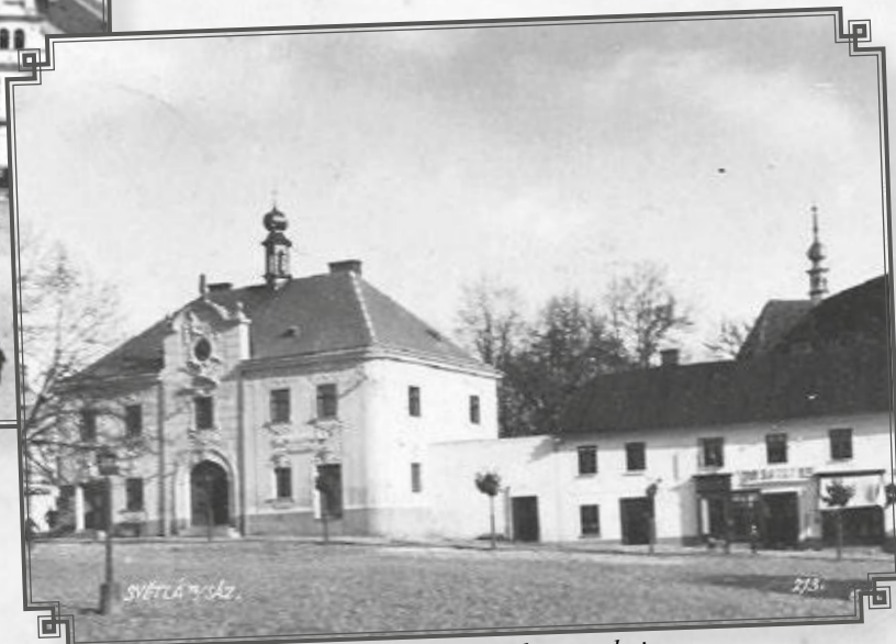
Radnice po první rekonstrukci