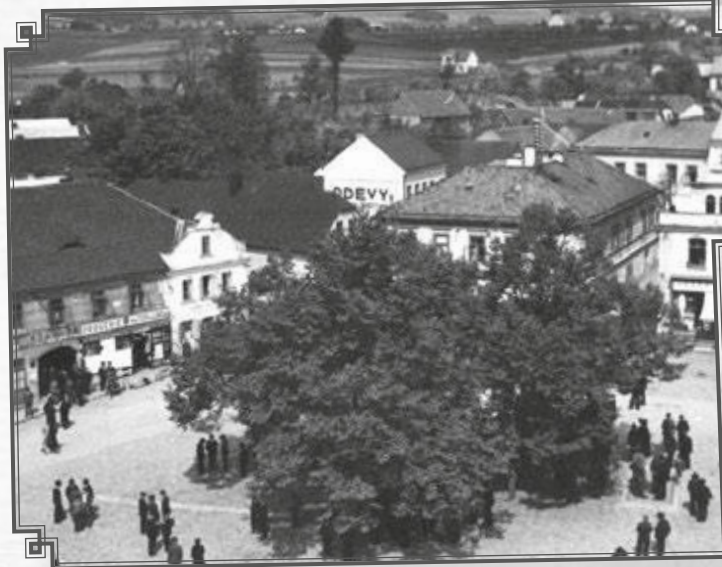
Pohled z věže kostela