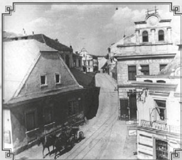
Východní část náměstí ještě s Konzumem