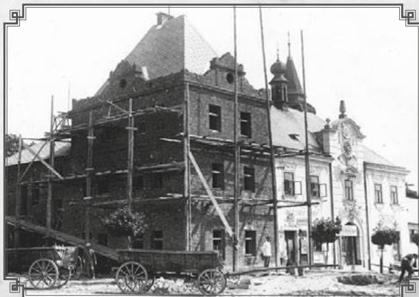
První přestavba radnice – 20. léta