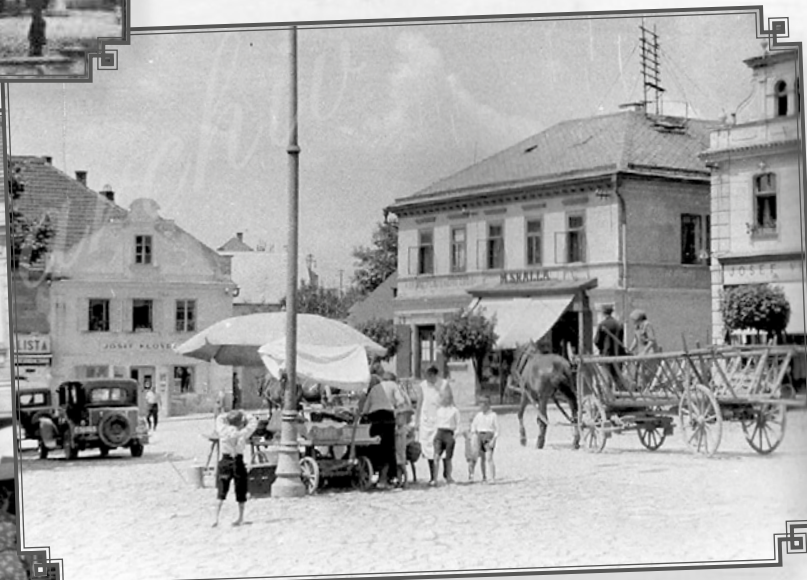
Západní část náměstí