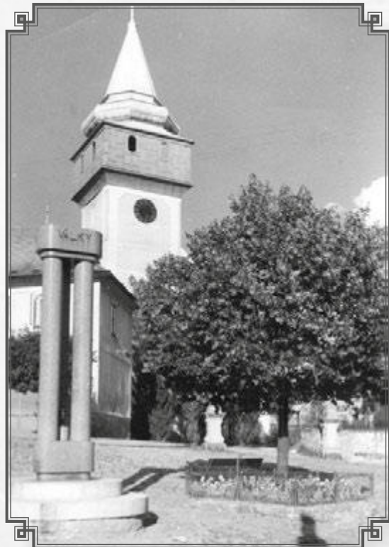
Kostel s pamětním sloupem