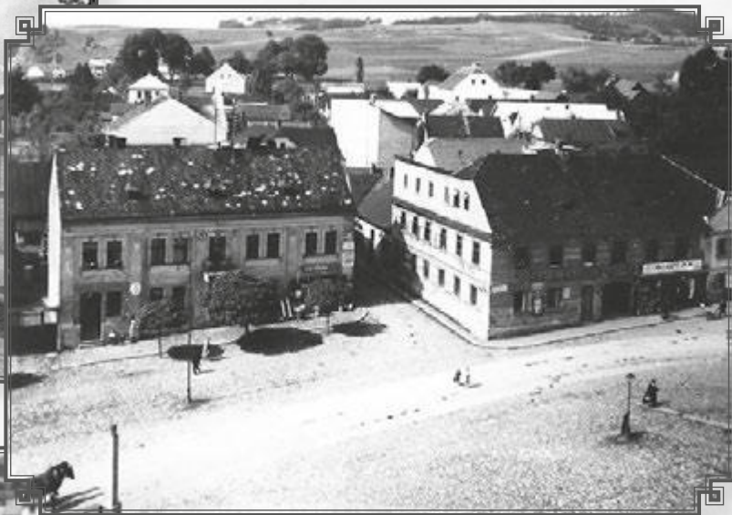
Pohled z věže kostela