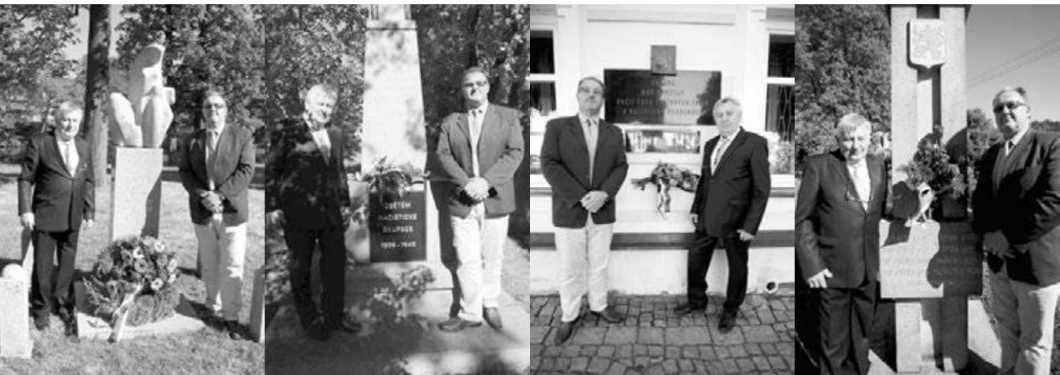
Položením věnce nebo květin u pamětní desky na budově radnice, u památníku na levém břehu Sázavy, v Dolní Březince a v Mrzkovicích uctilo vedení radnice oběti obou světových válek.