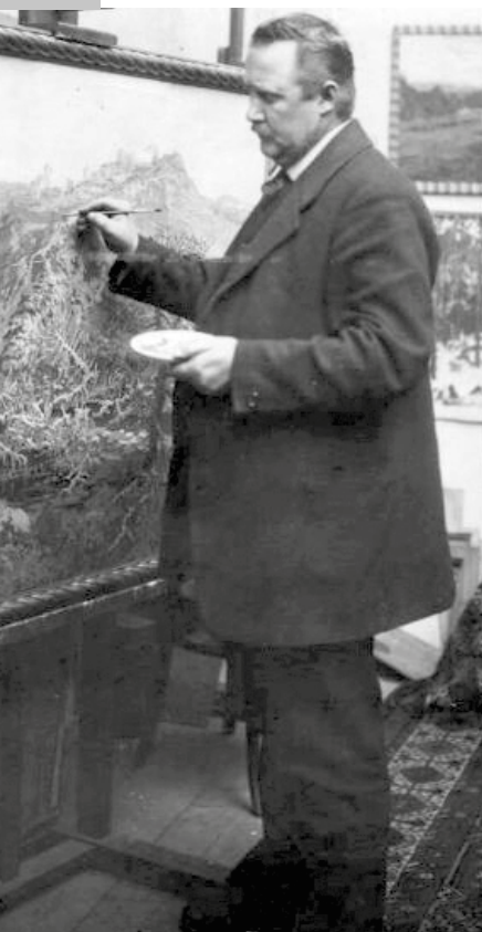
Jaroslav Panuška ve svém ateliéru