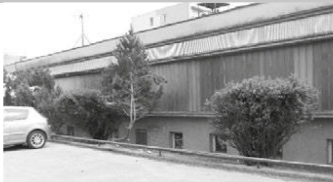
Takhle to tam vypadá letos v době kvetení po drastické údržbě