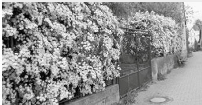
Takhle vypadá stríhaný živý plot, o který je pečováno s odbornou znalostí