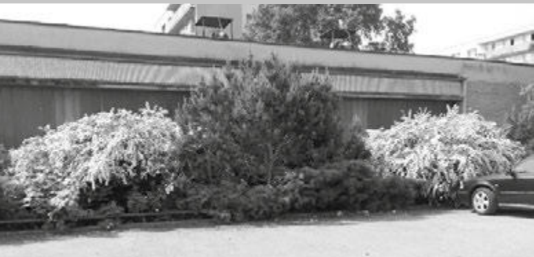
Tak vypadaly tavolníky i ostatní okrasná zeleň u tzv. Telekomu v květnu 2016