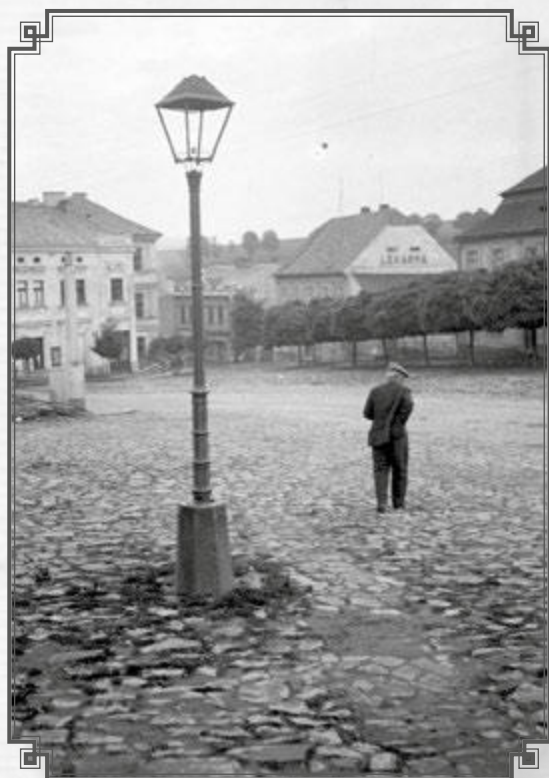
Spodní část náměstí se stromořadím