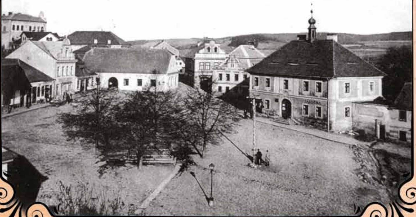
Náměstí z doby Rakouska-Uherska.