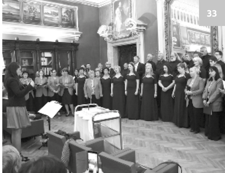
Proč bychom se netěšili ze Smetanovy Prodané nevěsty zpívaly oba sbory společně