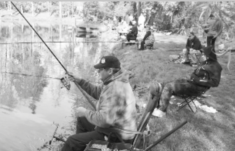
Hráz zámeckého rybníku obsazená soutěžícími rybáři