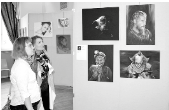
Tradičně pestrá byla paleta vystavených obrazů