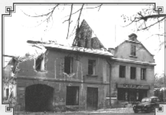
Zde se pokračovalo