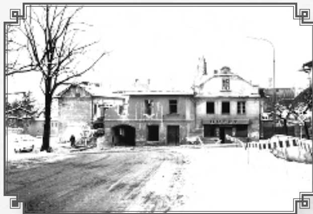
Pohled na blok domů připravených k demolicí