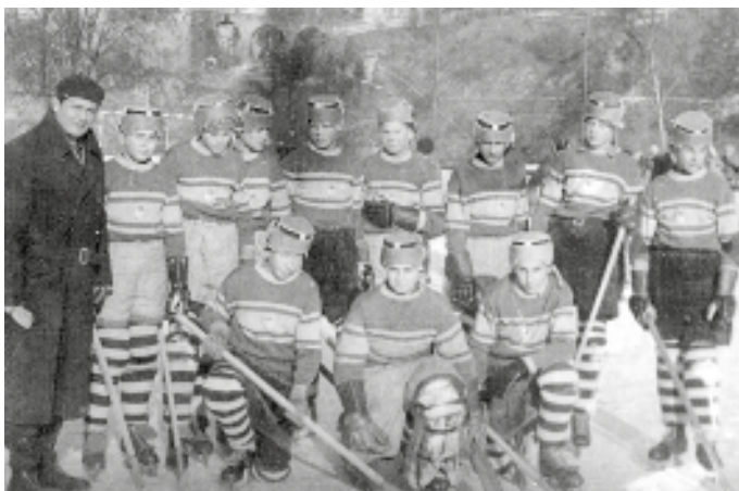
Okresní přebor žáků v hokeji, rok cca 1956