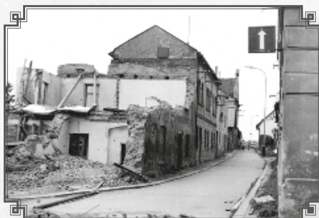
Zbytky domu Novákových-Vincencových