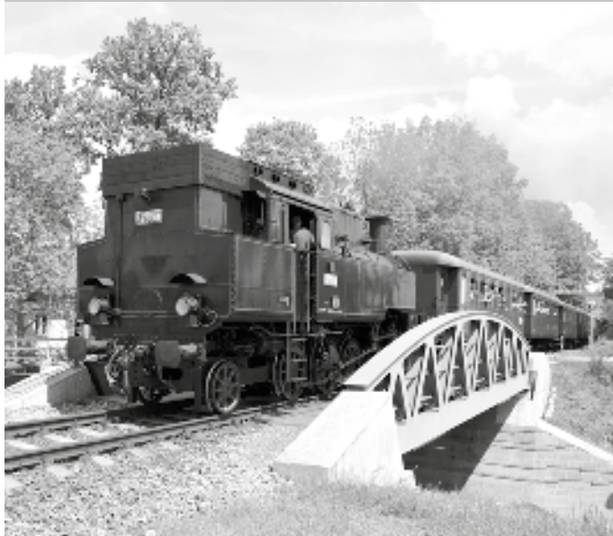
Téměř stoletá babička lokomotiva 423 009 s historickými vagóny na novém železničním mostě v Lánecké ulici

Po čtyřech letech se do Světlé nad Sázavou vrátil vlak tažený parní lokomotivou Postřižinský expres. Tuto vyhlídkovou jízdu historického vlaku pořádá každoročně pivovar v Nymburku na památku spisovatele Bohumila Hrabala, který popsal život v pivovaru v knize Postřižiny. Trasy Postřižinského expresu jsou každý rok jiné, přes nádraží ve Světlé jel v roce 2015 a nyní opět v letošním roce 25. května. Patrně nejzajímavější na celém tom výletním vlaku je to, že je tažen staříčkou parní lokomotivou s označením 423 009, kterou si staří nádražáci pro její sílu pojmenovali Velký bejček. Lokomotiva byla vyrobena v roce 1922 v První českomoravské továrně na stroje v Praze Libni. Vlak přijel do Světlé od Kolína, když zastavil též v Leštině. Ve Světlé měl více než hodinovou zastávku, během které si mohli zájemci prohlédnout historické vagony a zejména parní lokomotivu, kterou nevidí každý den. Vždyť provoz „páry“ byl u nás na železnici oficiálně ukončen v roce 1980, ale od vlaků tažených parními lokomotivami po našich tratích Havlíčkův Brod – Kolín a Světlá nad Sázavou – Čerčany uplynulo mnohem více let. Krátce po poledni se Postřižinský expres vydal po trati Posázavského pacifiku do Zruče nad Sázavou a ze Zruče se vracel přes Kutnou Horu, Kolín a Poděbrady zpět do Nymburku.