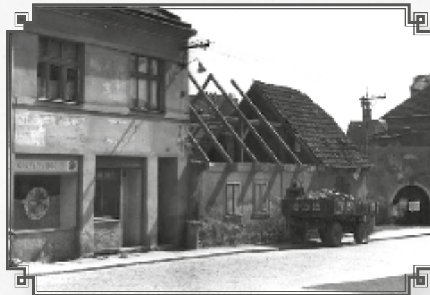
Demolice domku před Zajíčkovými – zde byla původní mlékárna