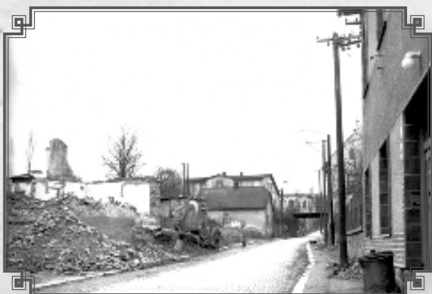
Lánecká ul., vlevo dnes bytový dům 700