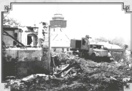
Pohled ze zbořeniště na kostel