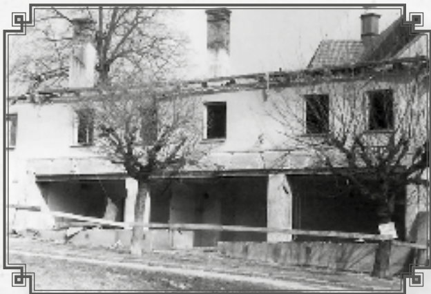
Demolice – Pickův dům pod radnicí