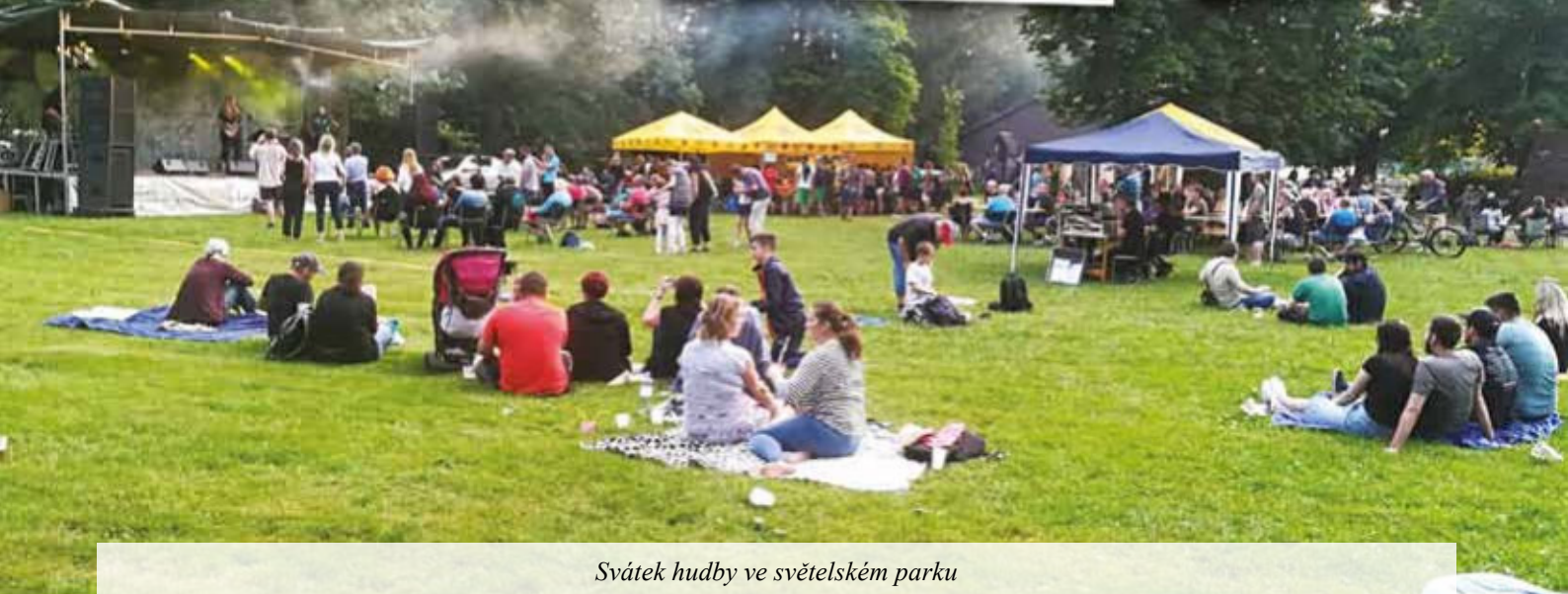
Svátek hudby ve světelském parku