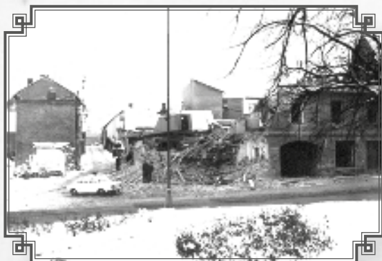
Začátek likvidace bloku