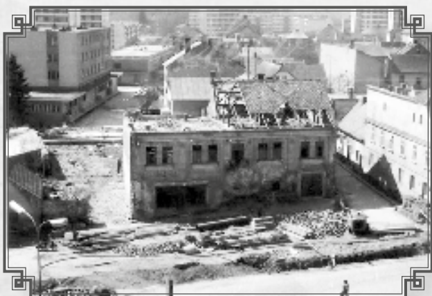
Demolice domu Novákových-Vincencových