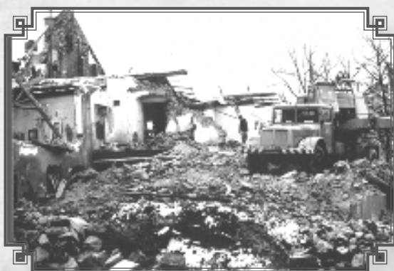
Pohled od jihozápadní strany