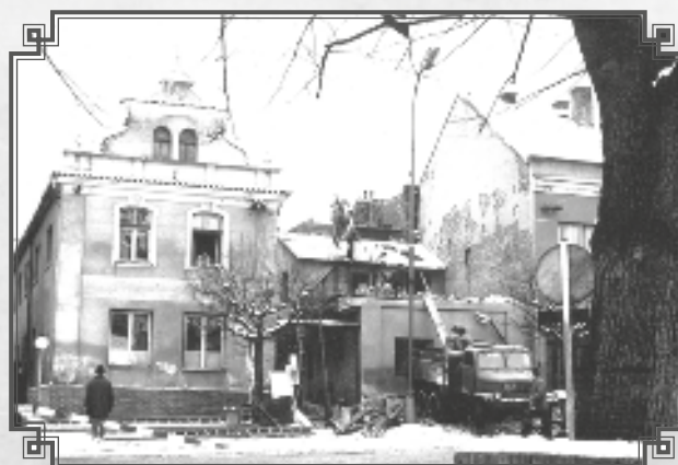
Likvidace domu Krupičkových