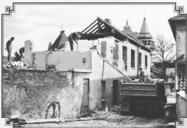
Demolice domu a obch. Vlčkových