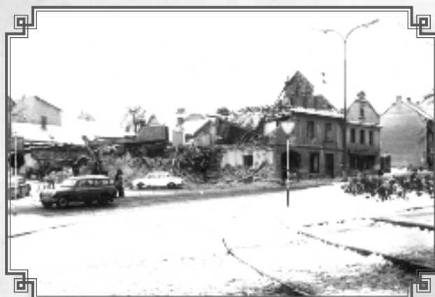
Pohled na probíhající práce