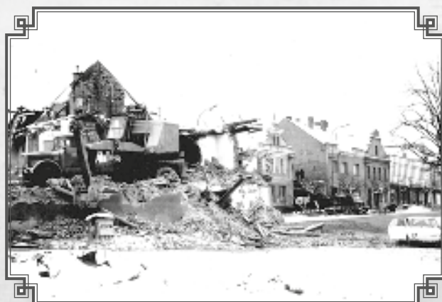
Probíhající práce na západním bloku a v pozadí dům Krupičkových