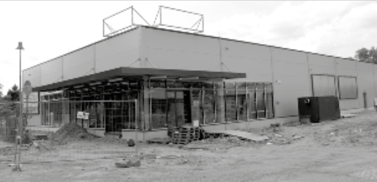
Objekt budoucího supermarketu Billa, stav 20. června 2019

Světelští zákazníci očekávají otevření Centra obchodu a služeb v Zámecké ulici, především supermarketu Billa. Ne že by neměli kde nakupovat, je v tom především zvědavost a očekávání něčeho nového. Když se v loňském roce začalo hovořit o výstavbě Billy ve