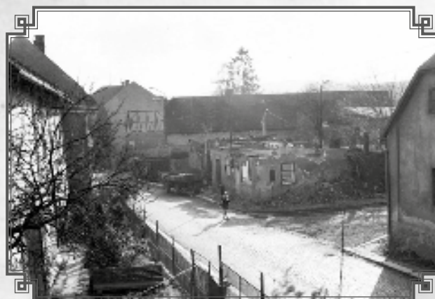
Lánecká ul. začátek demolice pro budoucí výstavbu bytového domu č. p. 700