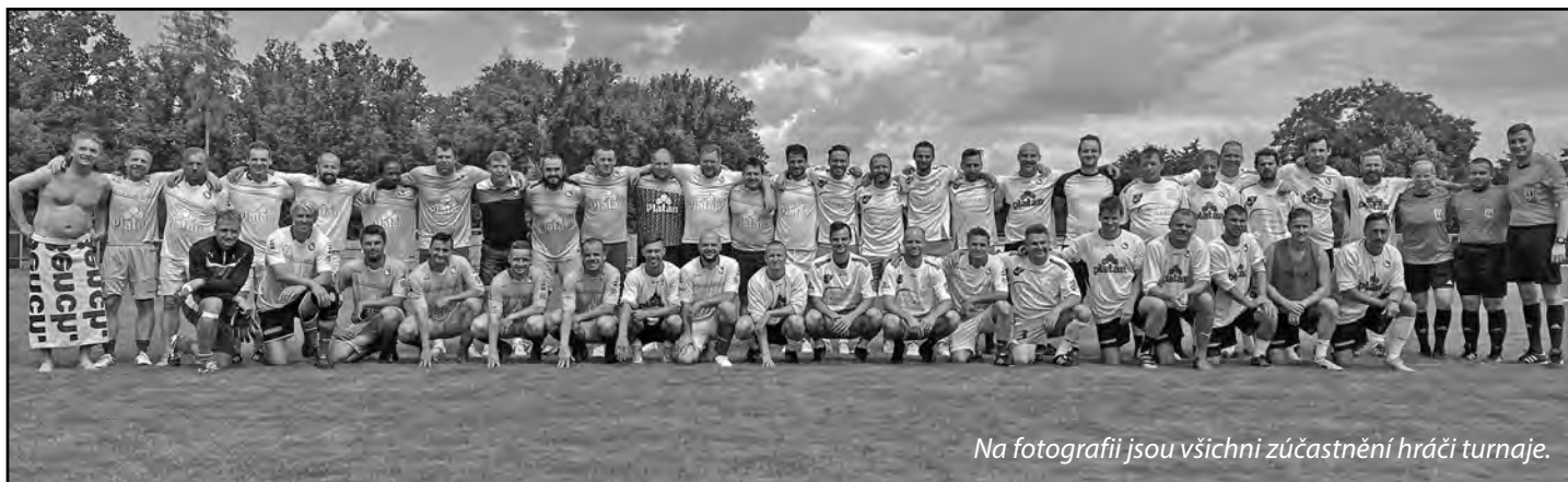
Na fotografii jsou všichni zúčastnění hráči turnaje.

O turnajích mladší a starší přípravky jsme informovali v minulém čísle.