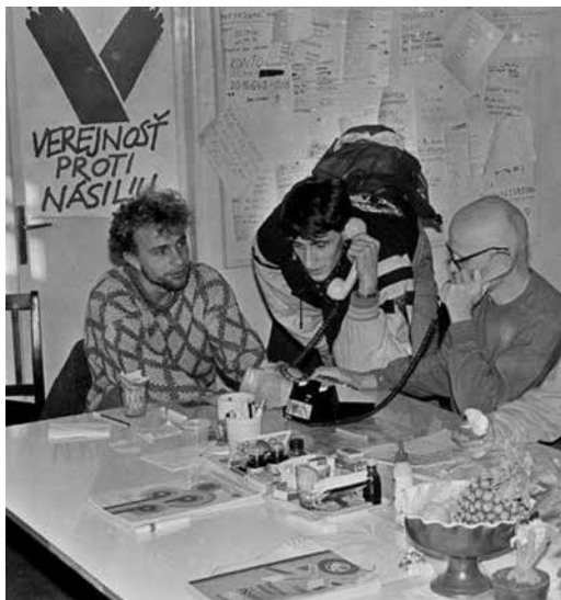
10 | Stávkové ústředí studentů v Praze

K prohlášení OF se přihlásili také v den zahájení stávků, tedy v pondělí 20. listopadu, vysokoškolští studenti. Zástupci OF se v ten den sešli s premiérem L. Adamcem, 5 který následně neuspěl na mimořádné plenární schůzi vlády ČSSR, ČSR a SSR se svým požadavkem vyšetřit neadekvátní zásah na Národní třídě. Plénium místo toho vyjádřilo obavu nad vývojem situace a souhlas s opatřeními, která měla obnovit pořádek. V pondělí večer začalo OF plánovat první velkou demonstraci po 17. listopadu, a to již na Václavském náměstí. Ozvučení bylo přislíbeno na balkoně vydavatelství Melantrich, termín: úterý 21. listopadu. Na schůzi byla také založena Akční skupina OF, která měla dohlížet nad věcným informováním a burcováním krajů mimo Prahu.