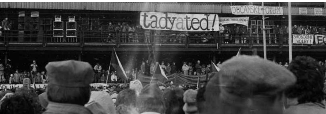
14 | Demonstrace na Letné očima účastníka

Ve 14 hod. začala na Letné největší demonstrace naší historie: zúčastnilo se jí přes osm set tisíc lidí. Akci přenášela (stejně jako dopolední mši v chrámu sv. Víta) Československá televize, která se tento den spolu s rozhlasem přihlásila ke generální stávce. Na demonstraci přečetl V. Havel nesouhlasné stanovisko OF se změnami v ÚV KSČ a zopakoval, že OF je nadále pro konstruktivní dialog s vládou. Během několika hodin se u mikrofonu vystřídala řada osobností z nejrůznějších odvětví lidského života, mj. také řada herců i zpěváků (např. J. Hutka, který se pár hodin předtím vrátil z emigrace). Velké demonstrace se konaly také v dalších městech. Do generální stávky se přihlásilo už na pět set padesát podniků a závodů.