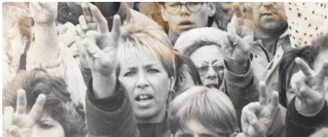
17 | Z demonstrace v Českých Budějovicích

ní hranic s Rakouskem, a to do 4. prosince. Že se mění nejen atmosféra v zemi, ale také vládnoucí vrstva, pochopila již i Státní bezpečnost, která zahájila rozsáhlou skartaci obrovského množství dokumentů. Karlu Krylovi byla také po dvaceti jedna letech vyhnanství povolena jednodenní návštěva Československa – aby se mohl zúčastnit pohřbu své matky.