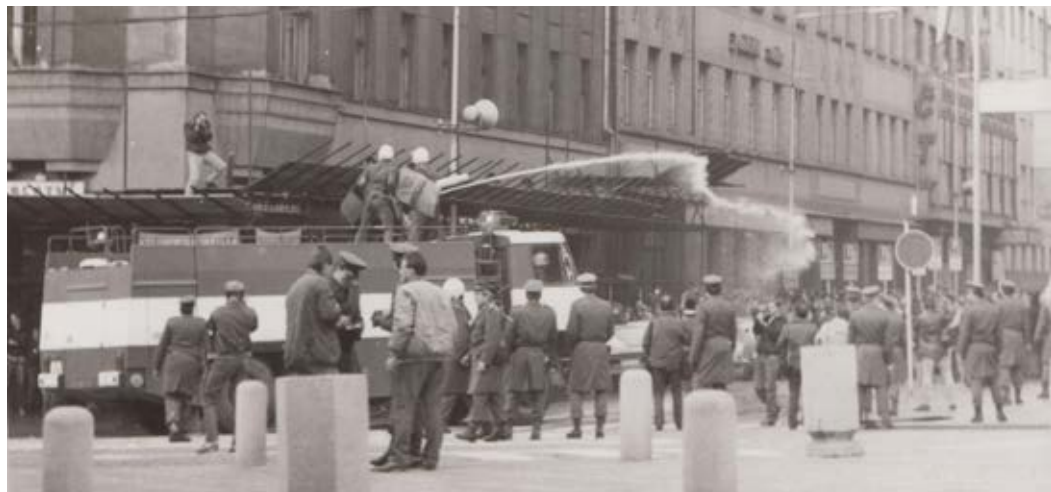
3 | Vodní dělo v akci

čas od času je podpořila nějaká veřejně známá osobnost, až začala československá veřejnost v r. 1988 po dvaceti letech veřejně demonstrovat. Tyto demonstrace ještě přívlastek „masové“ neměly. První početné protestní akce se uskutečnily až na jaře r. 1989 při tzv. „Palachově týdně“.