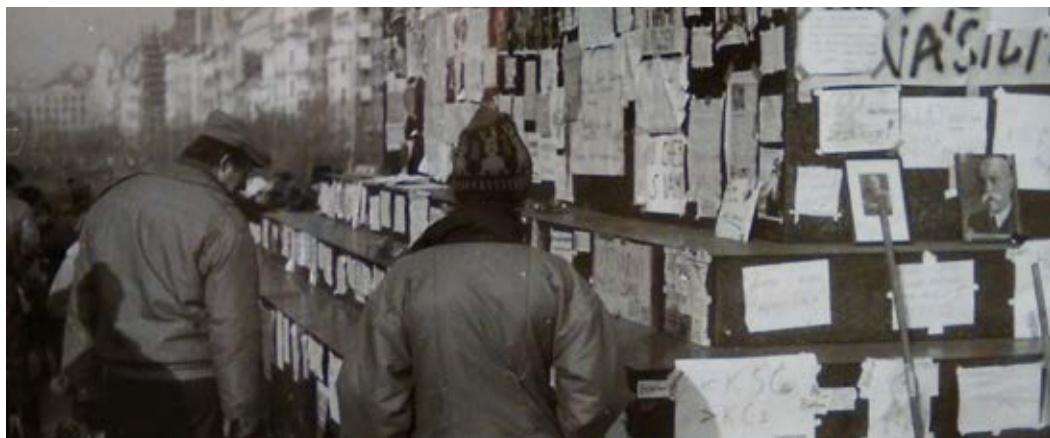
5 | Ten se tehdy ještě odmítl setkat s V. Havlem, který tak musel zůstat ve vestibulu.